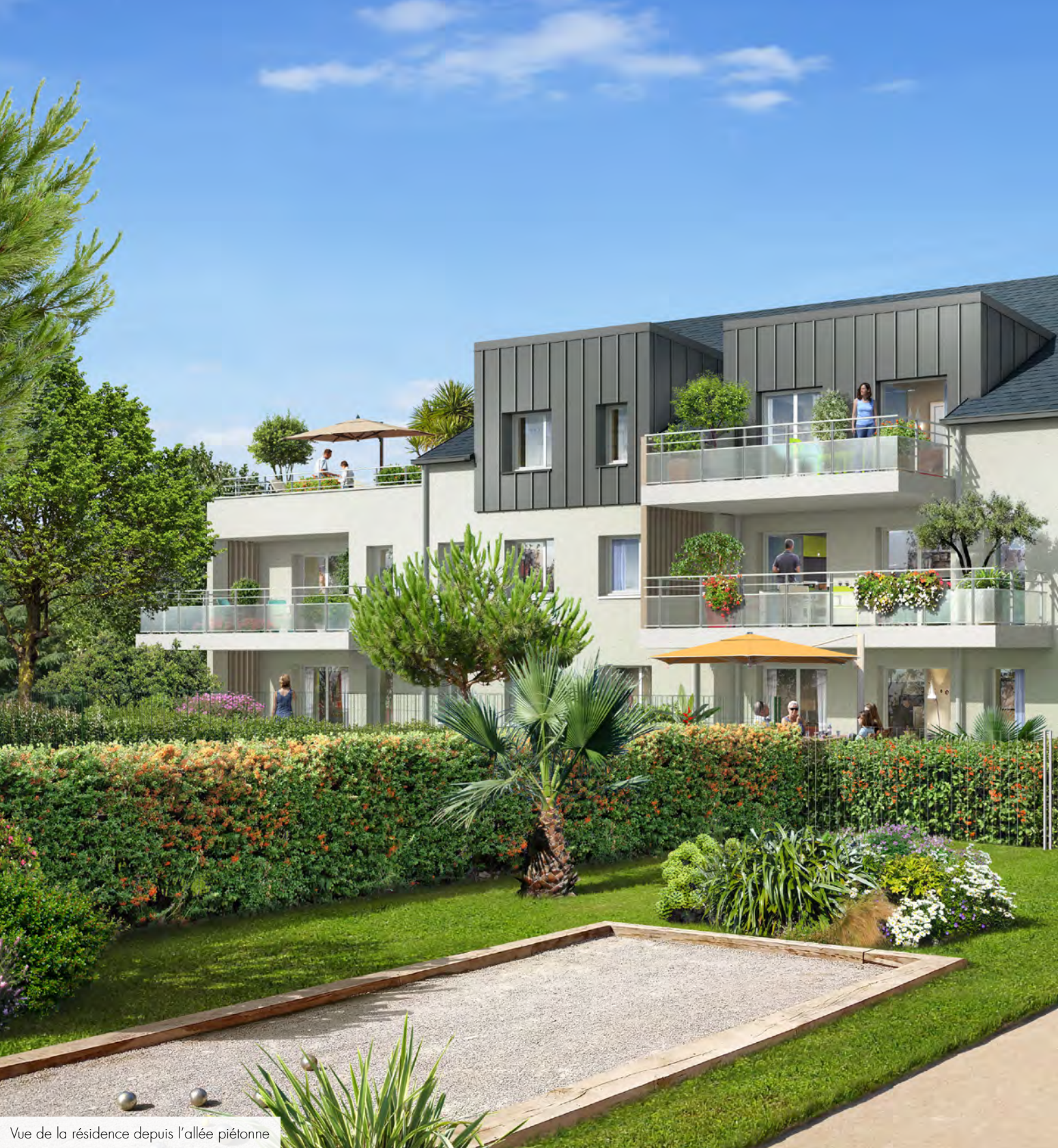
Vue de la résidence depuis l'allée piétonne