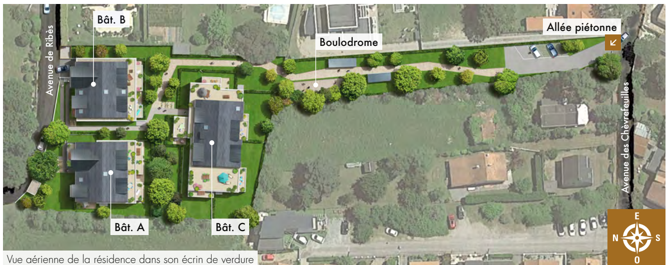
Vue aérienne de la résidence dans son écrin de verdure