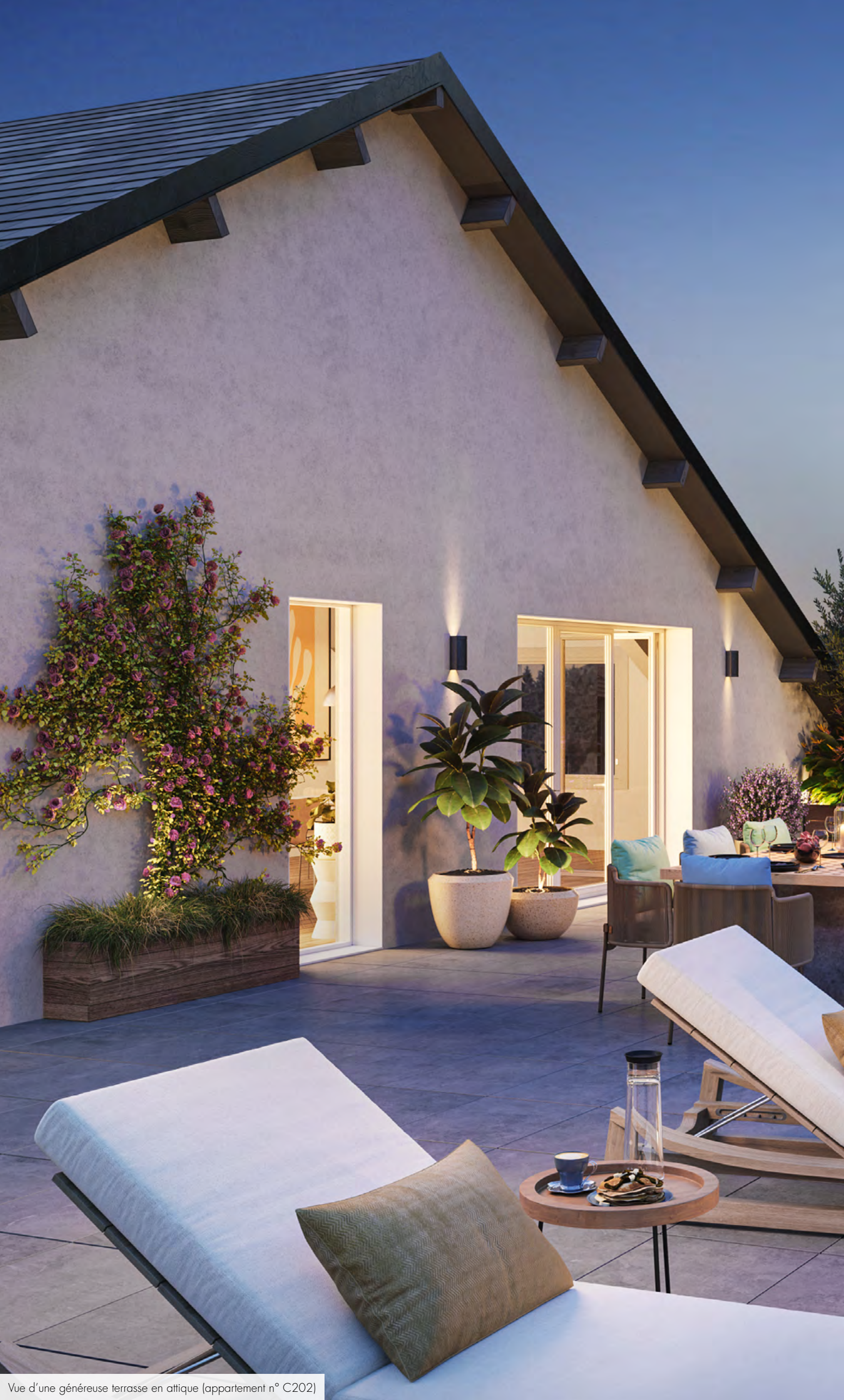
Vue d'une généreuse terrasse en attique (appartement n° C202)