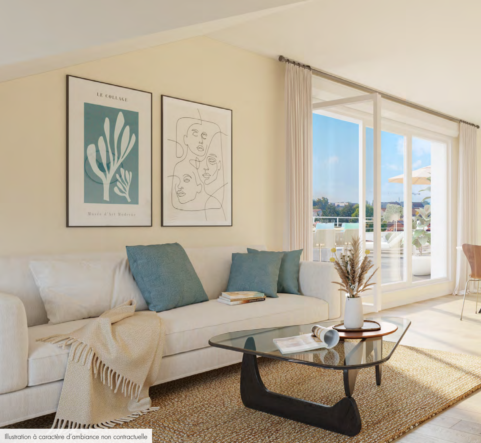
Illustration à caractère d'ambiance non contractuelle