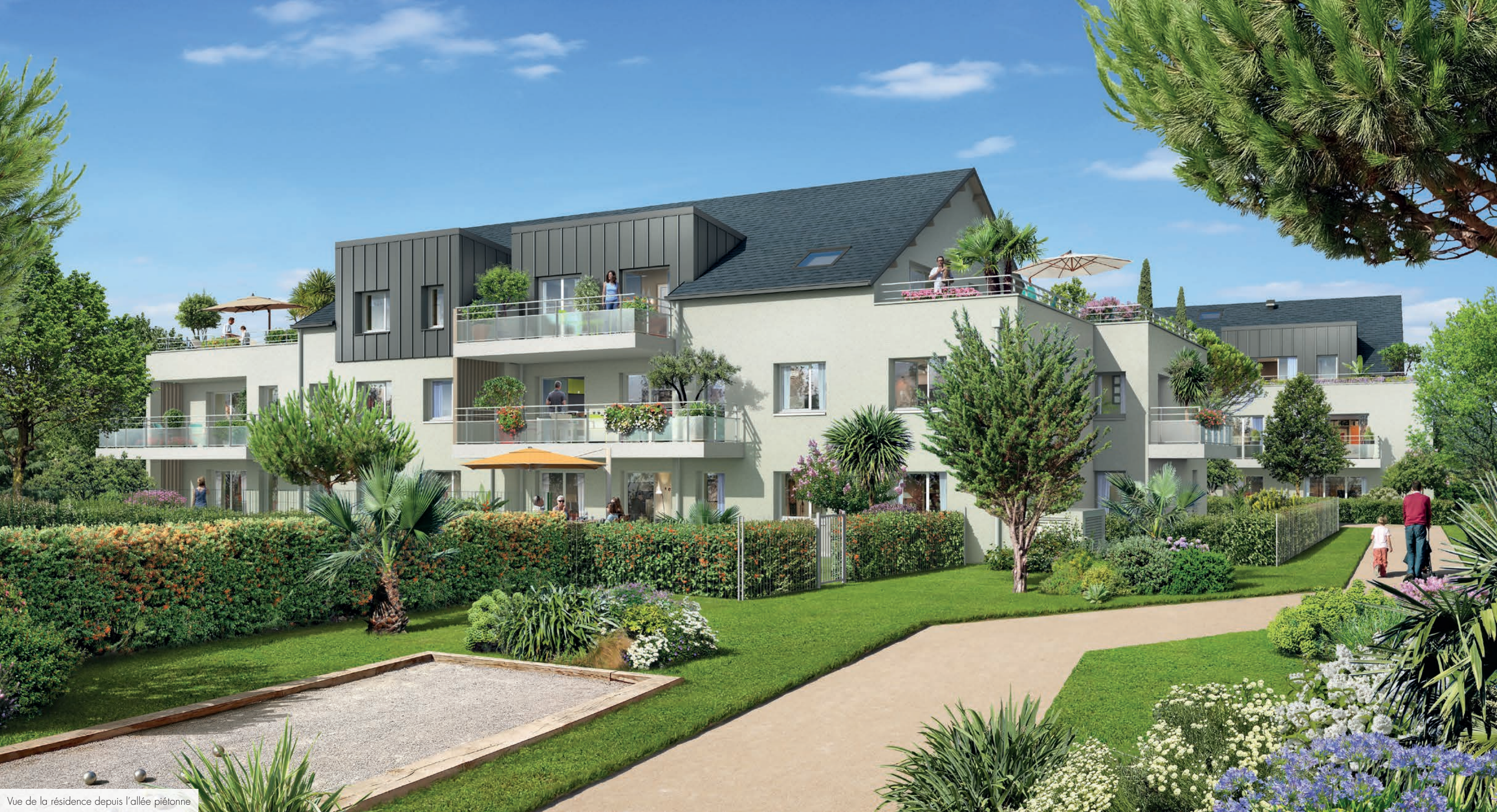
Vue de la résidence depuis l'allée piétonne.