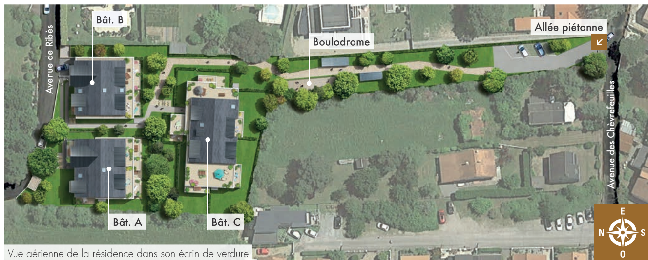
Vue aérienne de la résidence dans son écrin de verdure