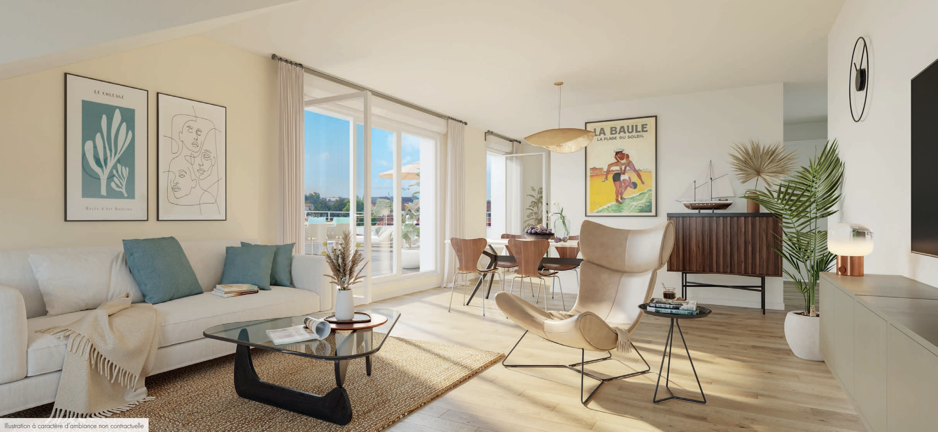
Illustration à caractère d'ambiance non contractuelle