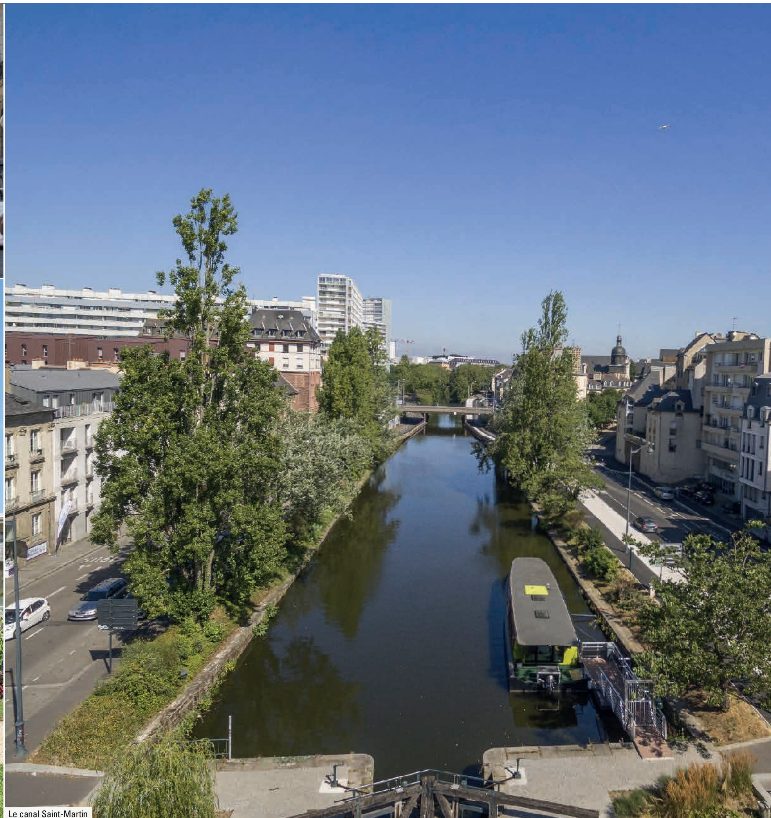
Le canal Saint-Martin