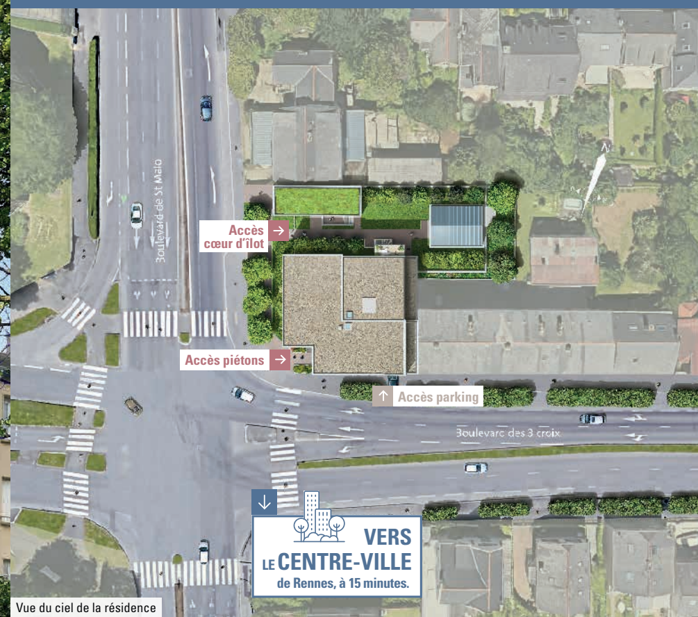
Vue du ciel de la résidence

Le soin apporté à cette réalisation se découvre également dans le hall d'entrée, décoré avec soin par un architecte.