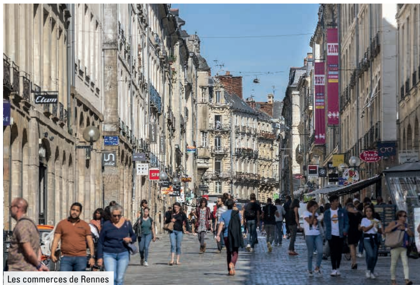
Les commerces de Rennes