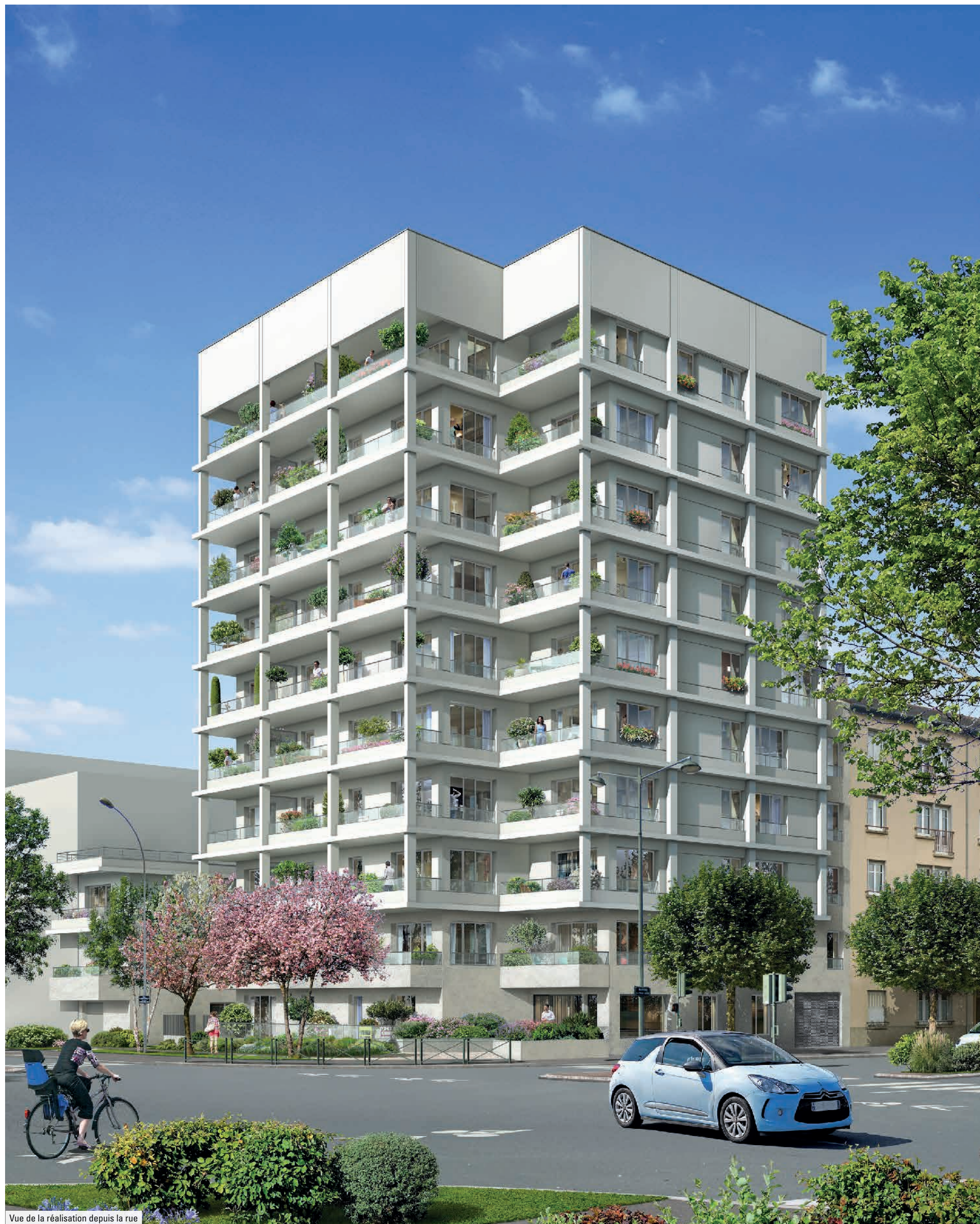
Vue de la réalisation depuis la rue