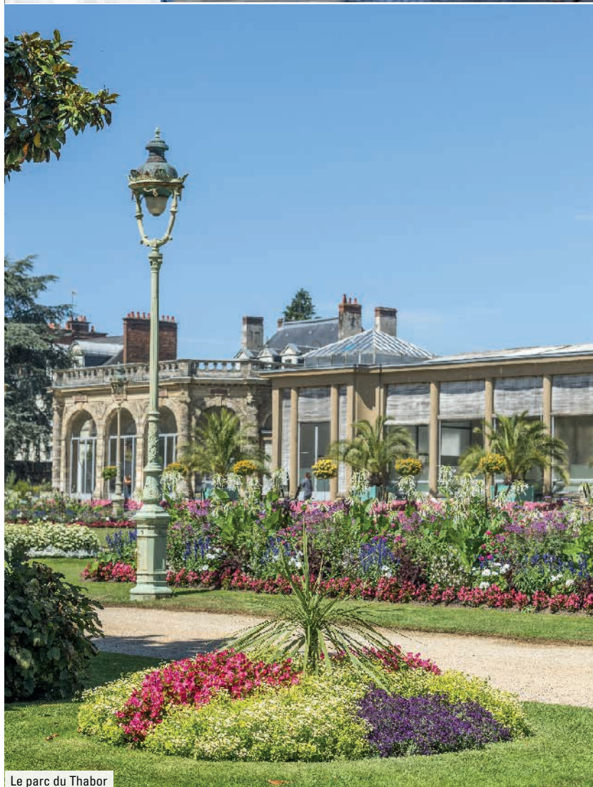
Le parc du Thabor