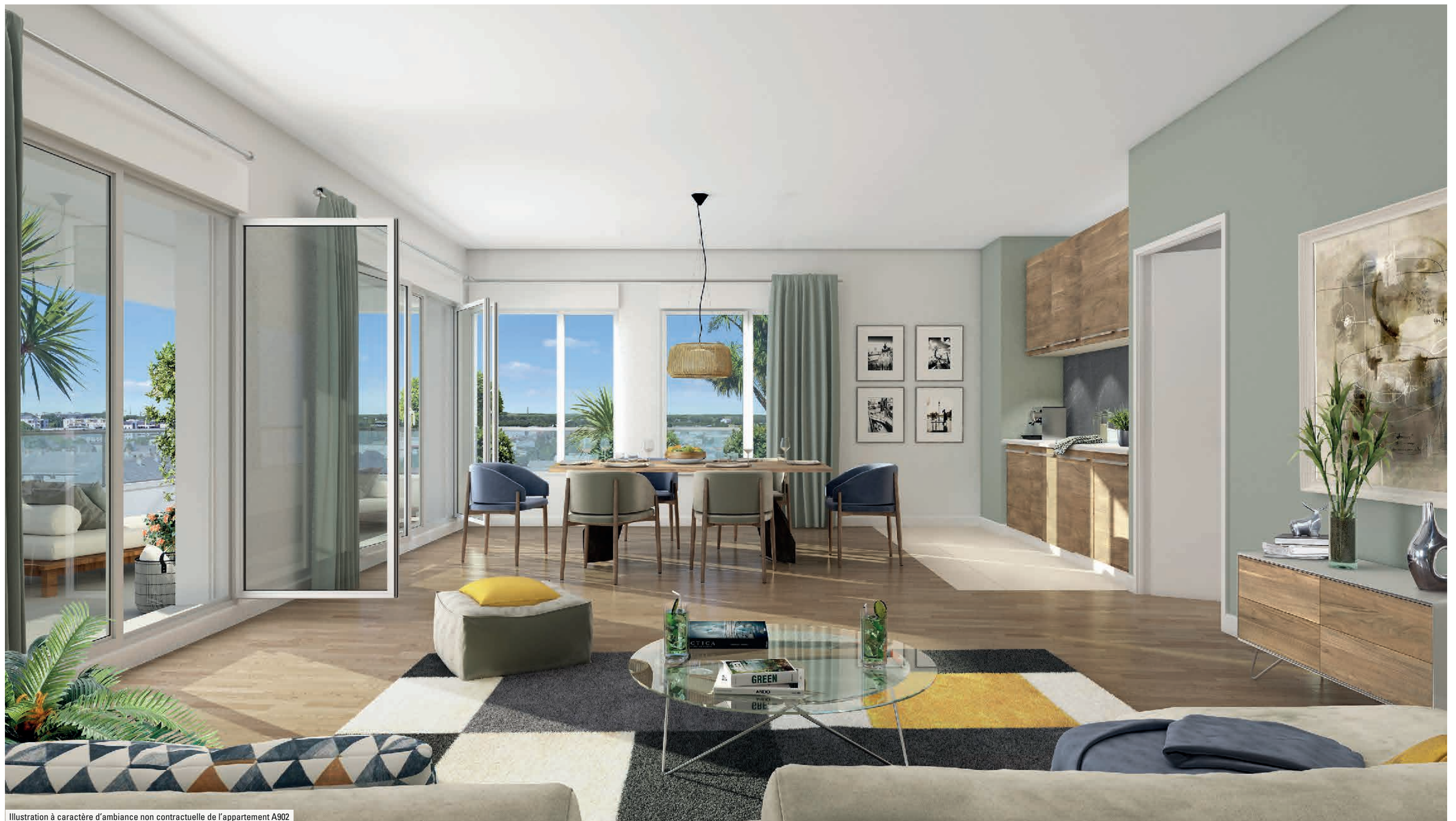
Illustration à caractère d'ambiance non contractuelle de l'appartement A902