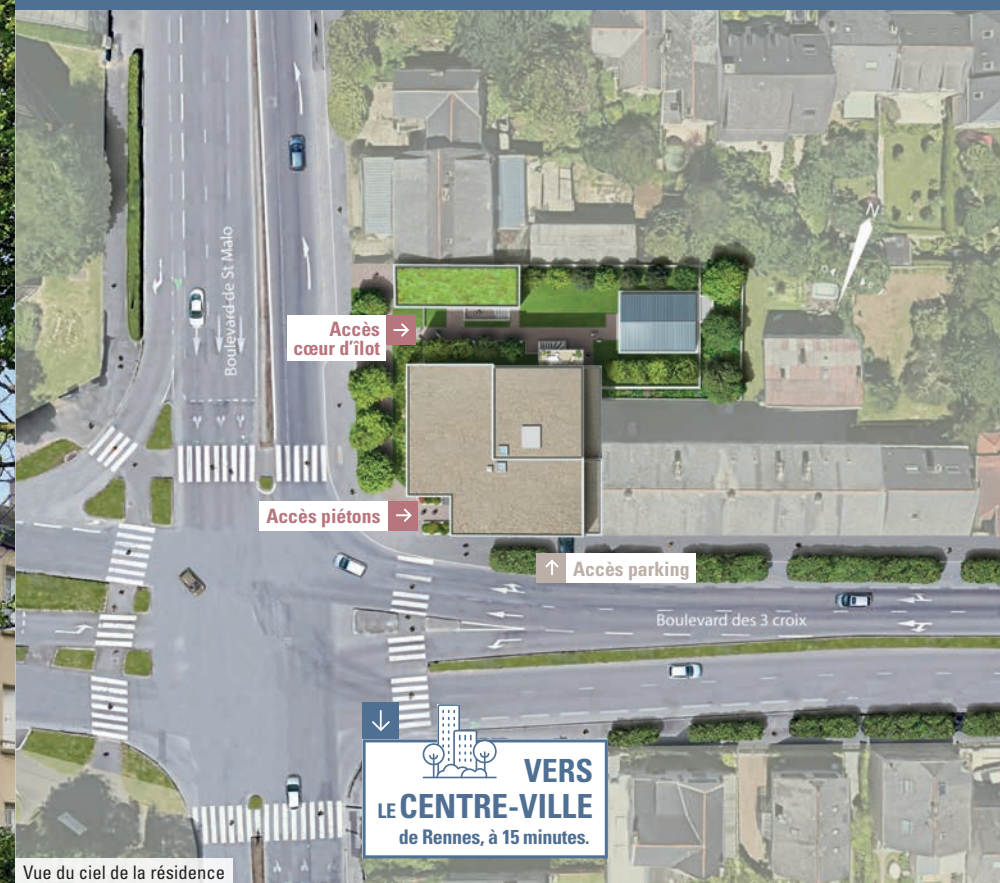
Vue du ciel de la résidence

Le soin apporté à cette réalisation se découvre également dans le hall d'entrée, décoré avec soin par un architecte.