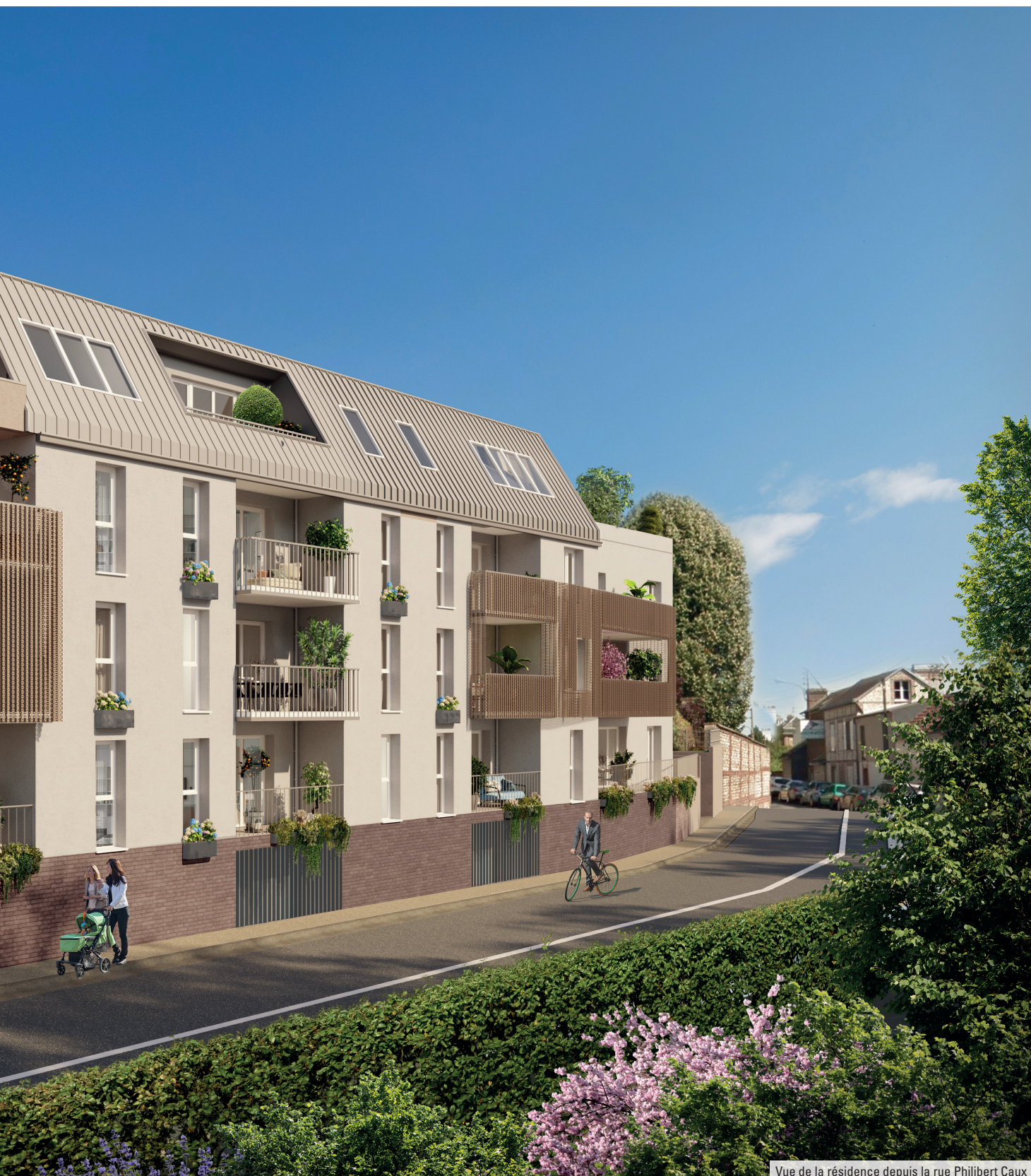
Vue de la résidence depuis la rue Philibert Caux