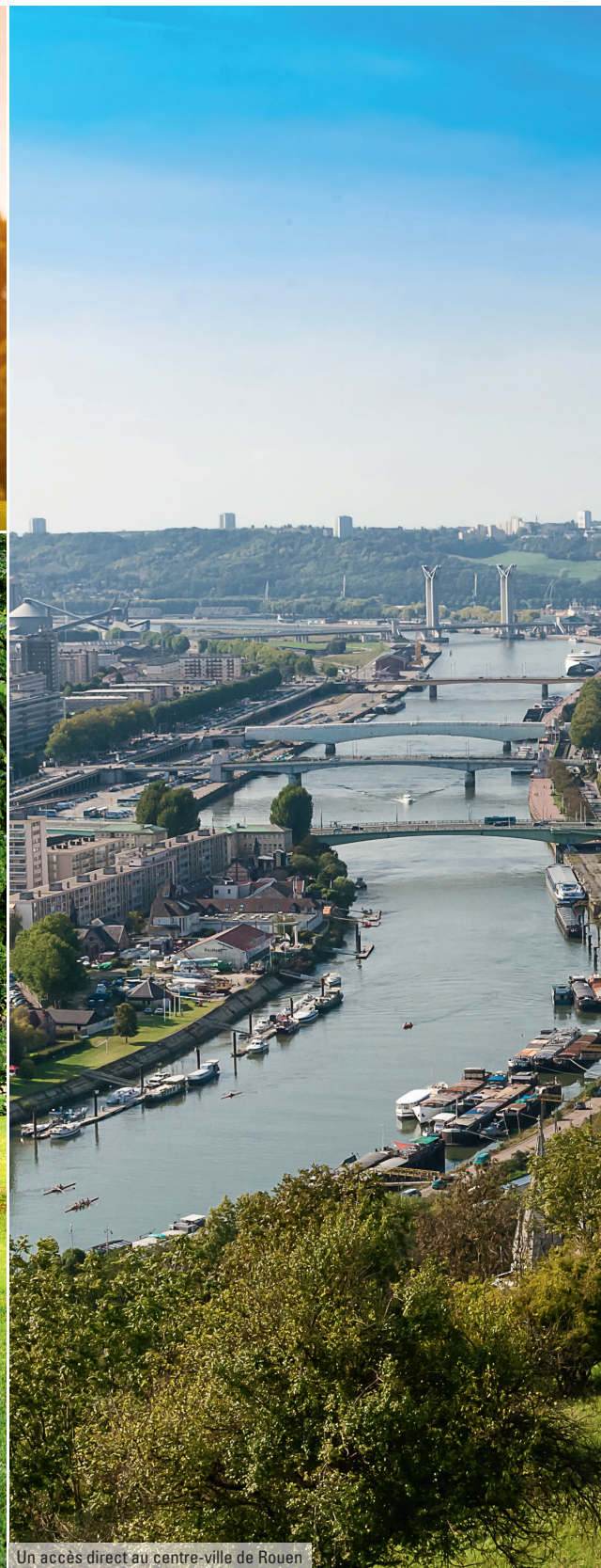
Un accès direct au centre-ville de Rouen

Apprécier les charmes d'une ville à taille humaine et garder Rouen bien en vue