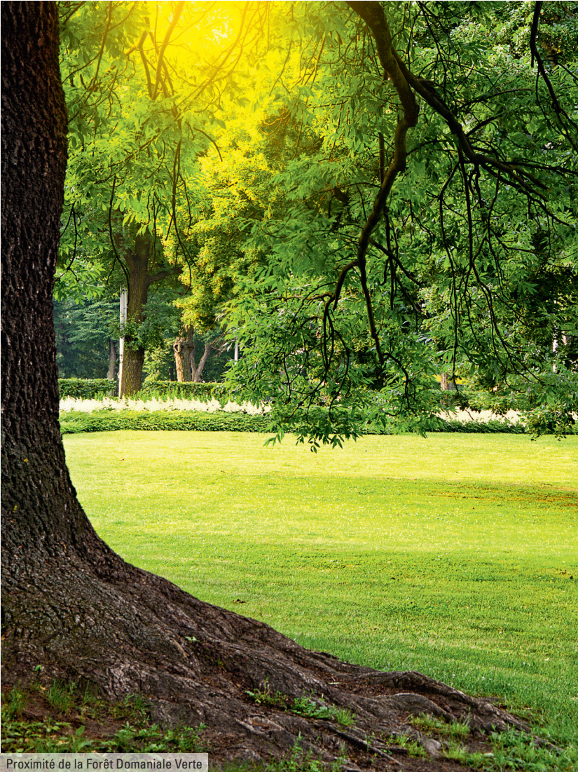
Proximité de la Forêt Domaniale Verte