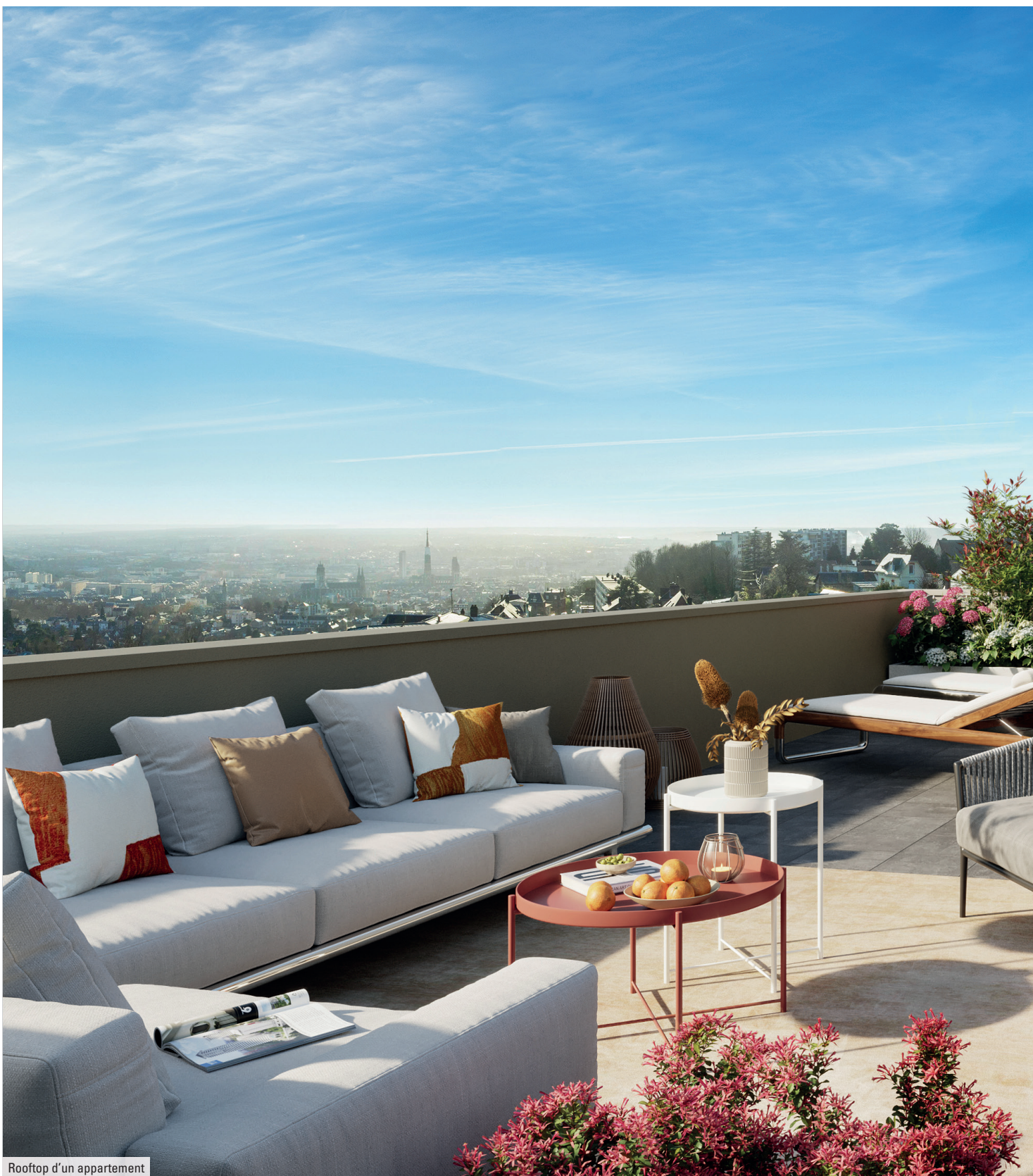
Rooftop d'un appartement