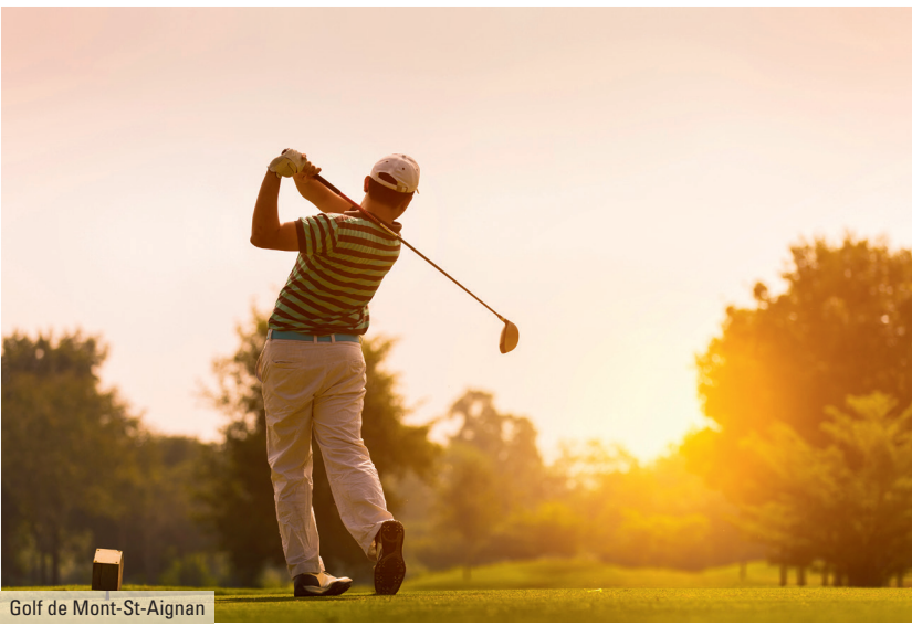
Golf de Mont-St-Aignan