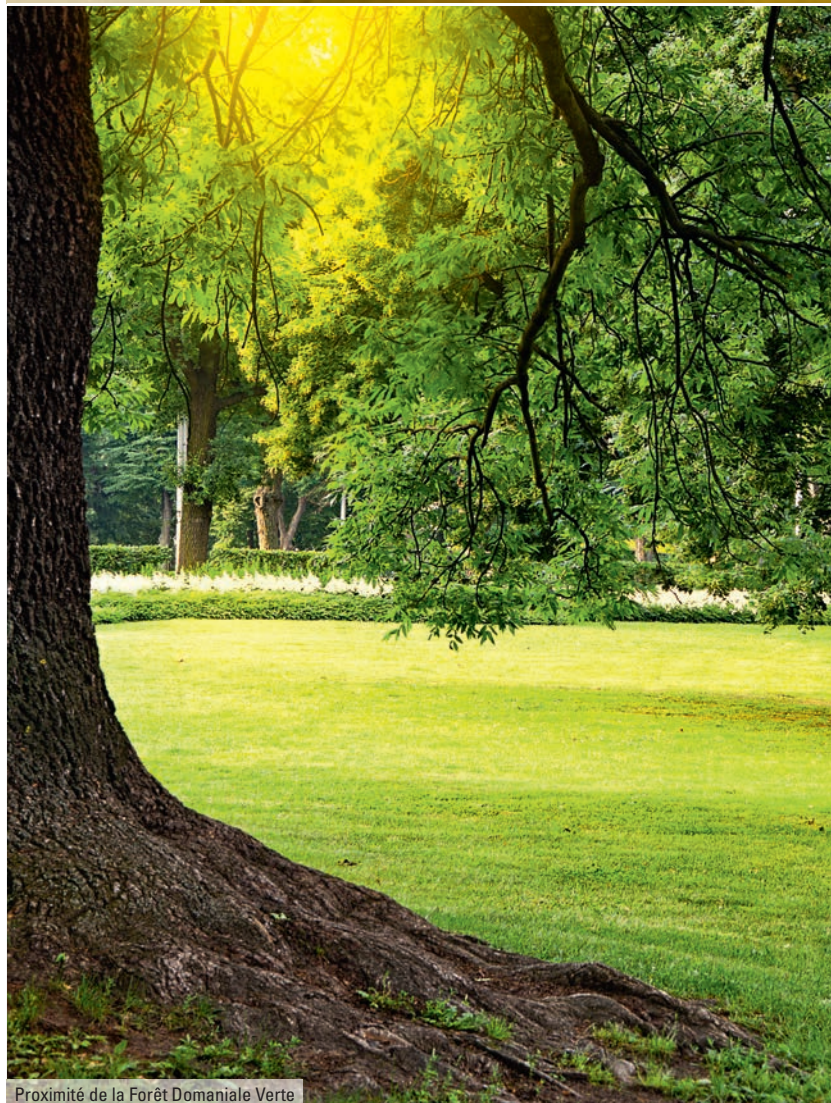
Proximité de la Forêt Domaniale Verte