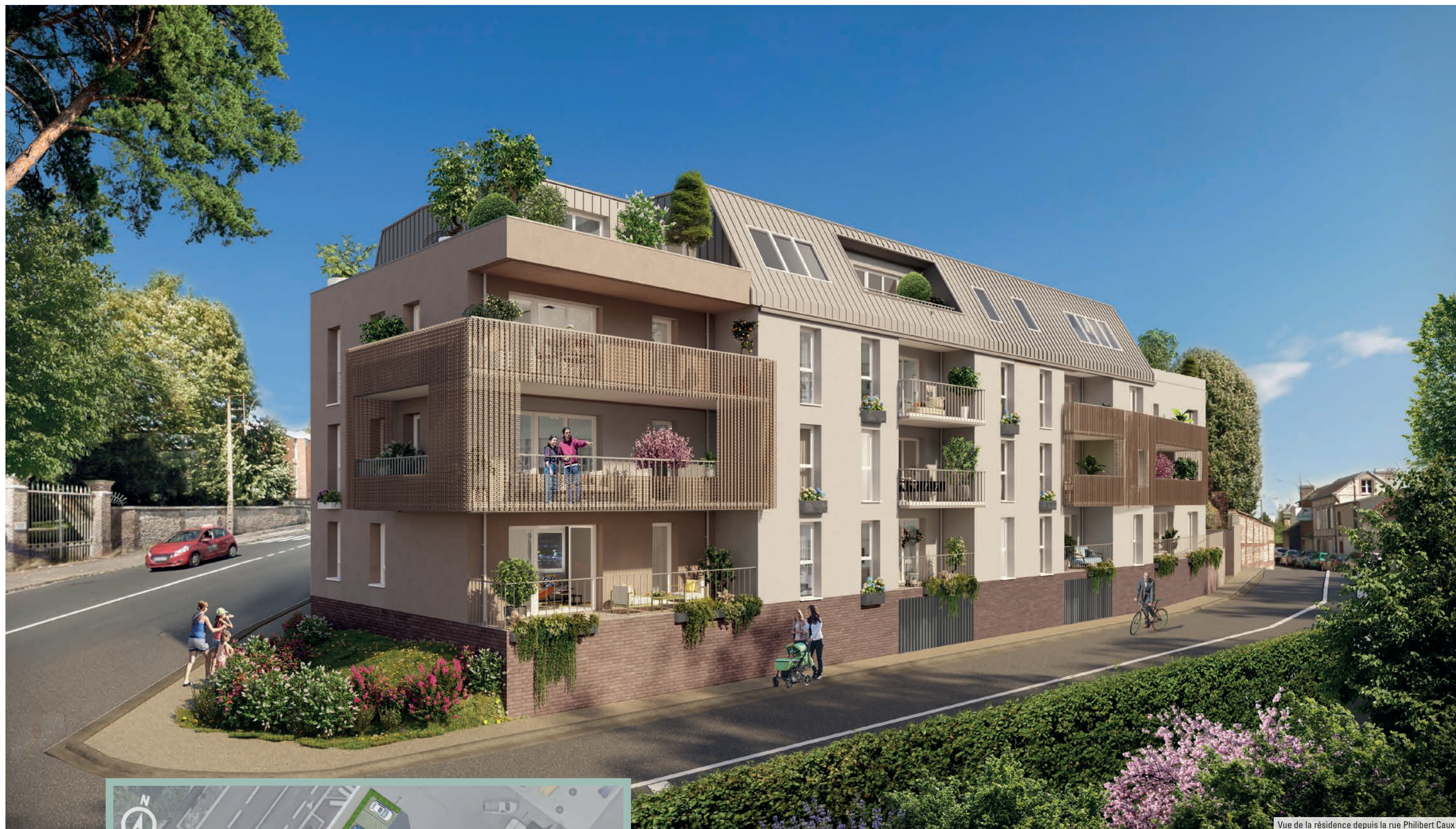
Vue de la résidence depuis la rue Philibert Caux