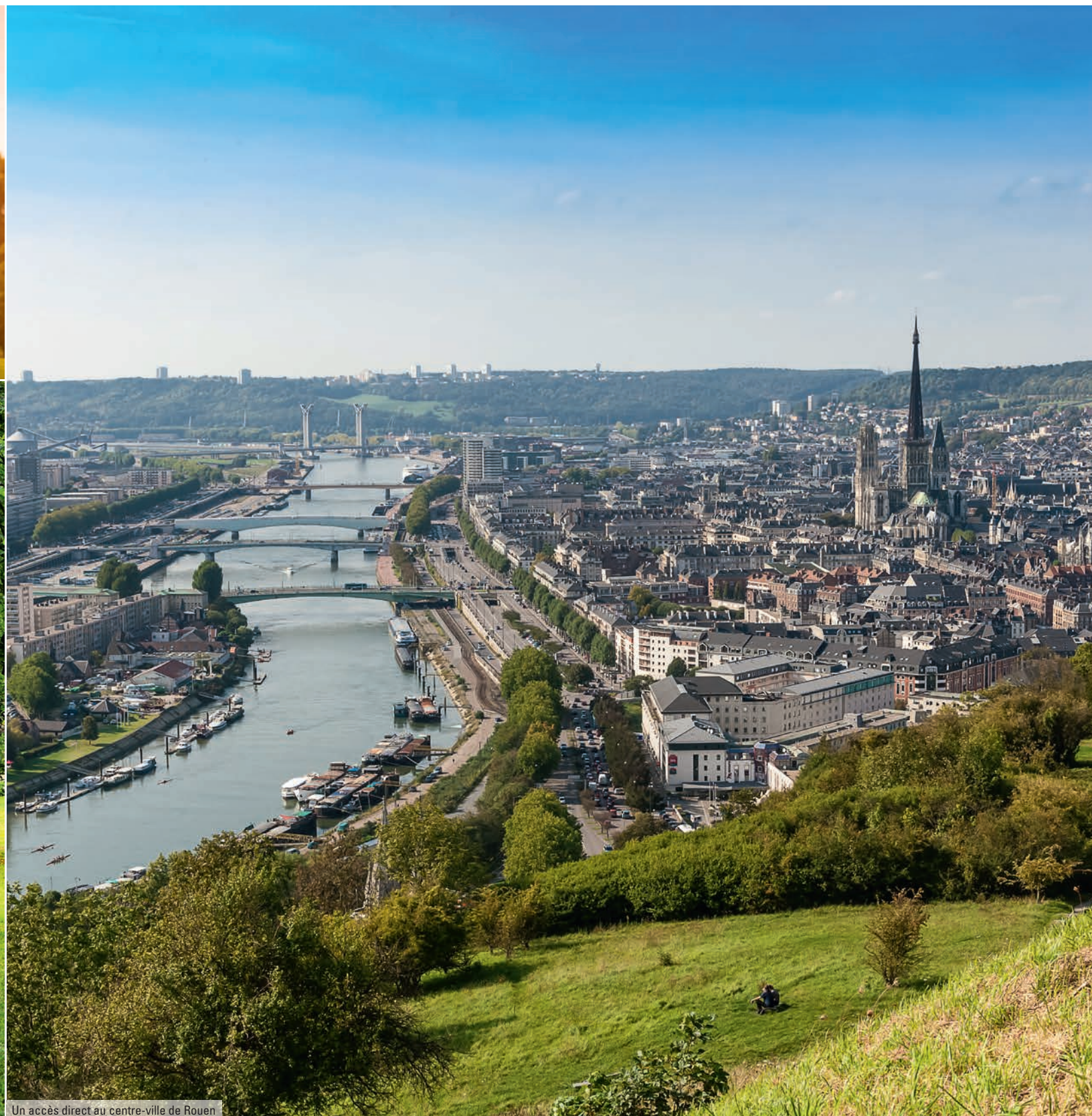
Un accès direct au centre-ville de Rouen