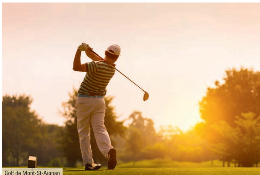
Golf de Mont-St-Aignan