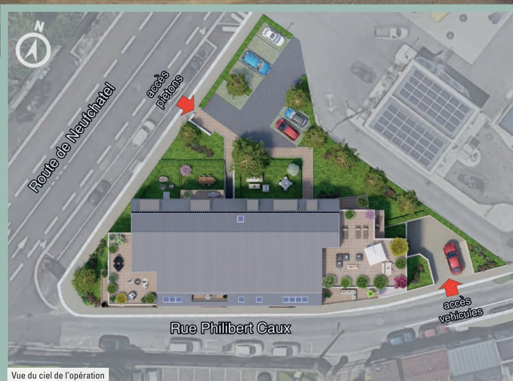
Vue du ciel de l'opération