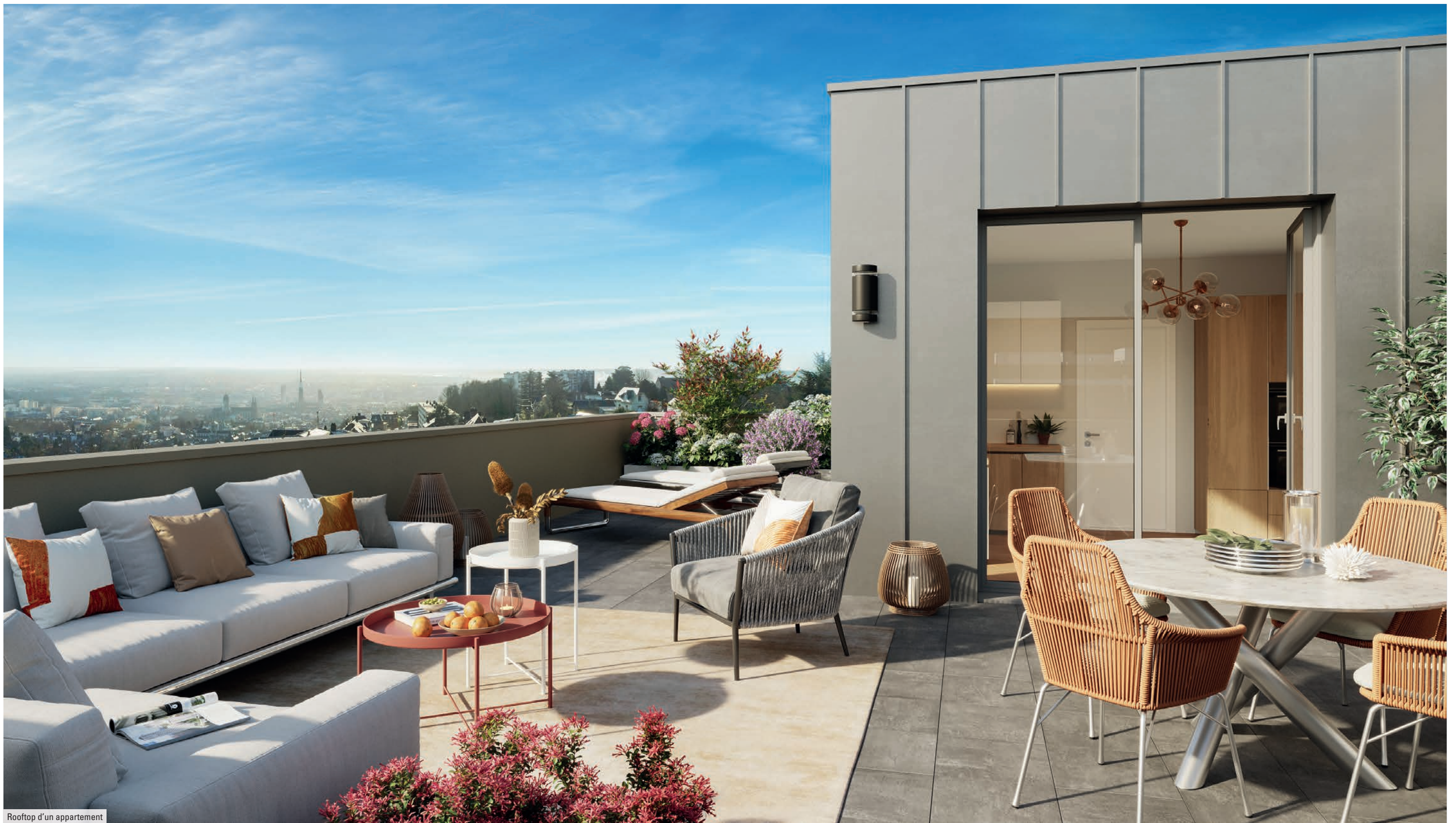
Rooftop d'un appartement