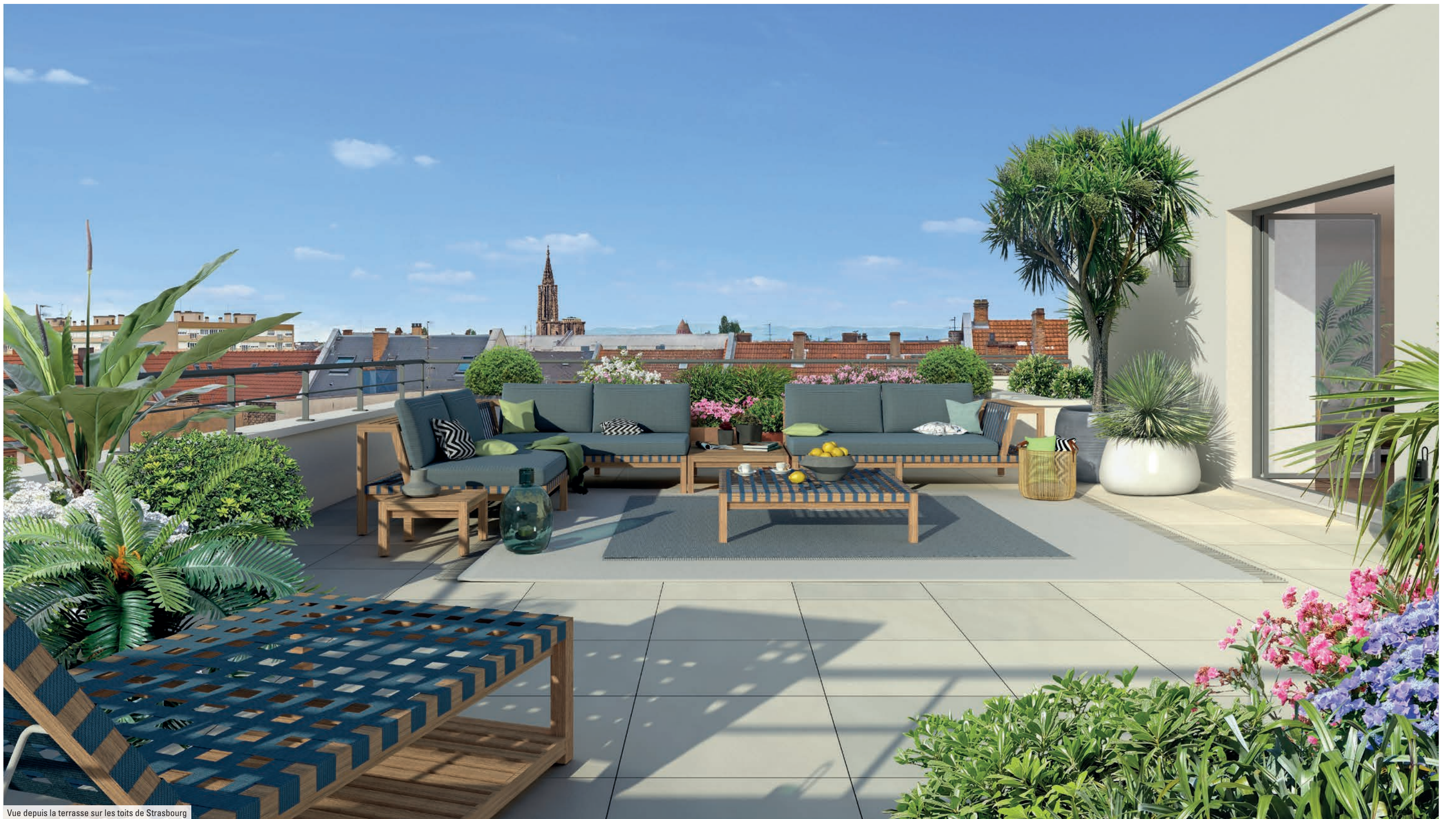
Vue depuis la terrasse sur les toits de Strasbourg