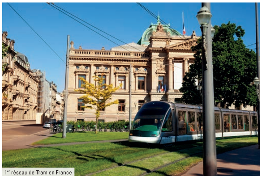
1 er réseau de Tram en France