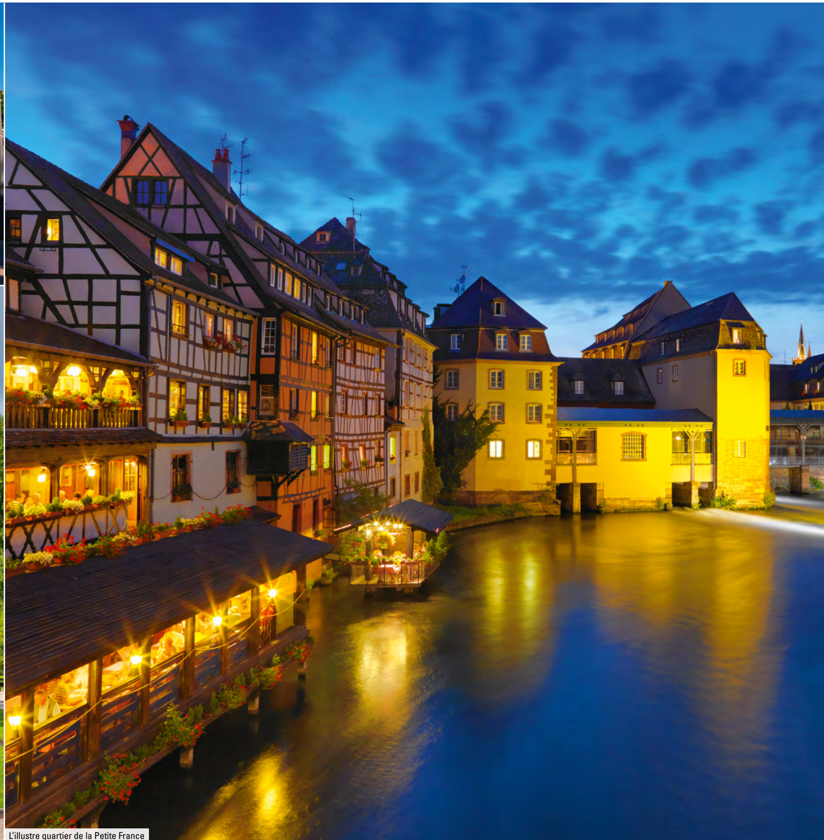
L'illustre quartier de la Petite France