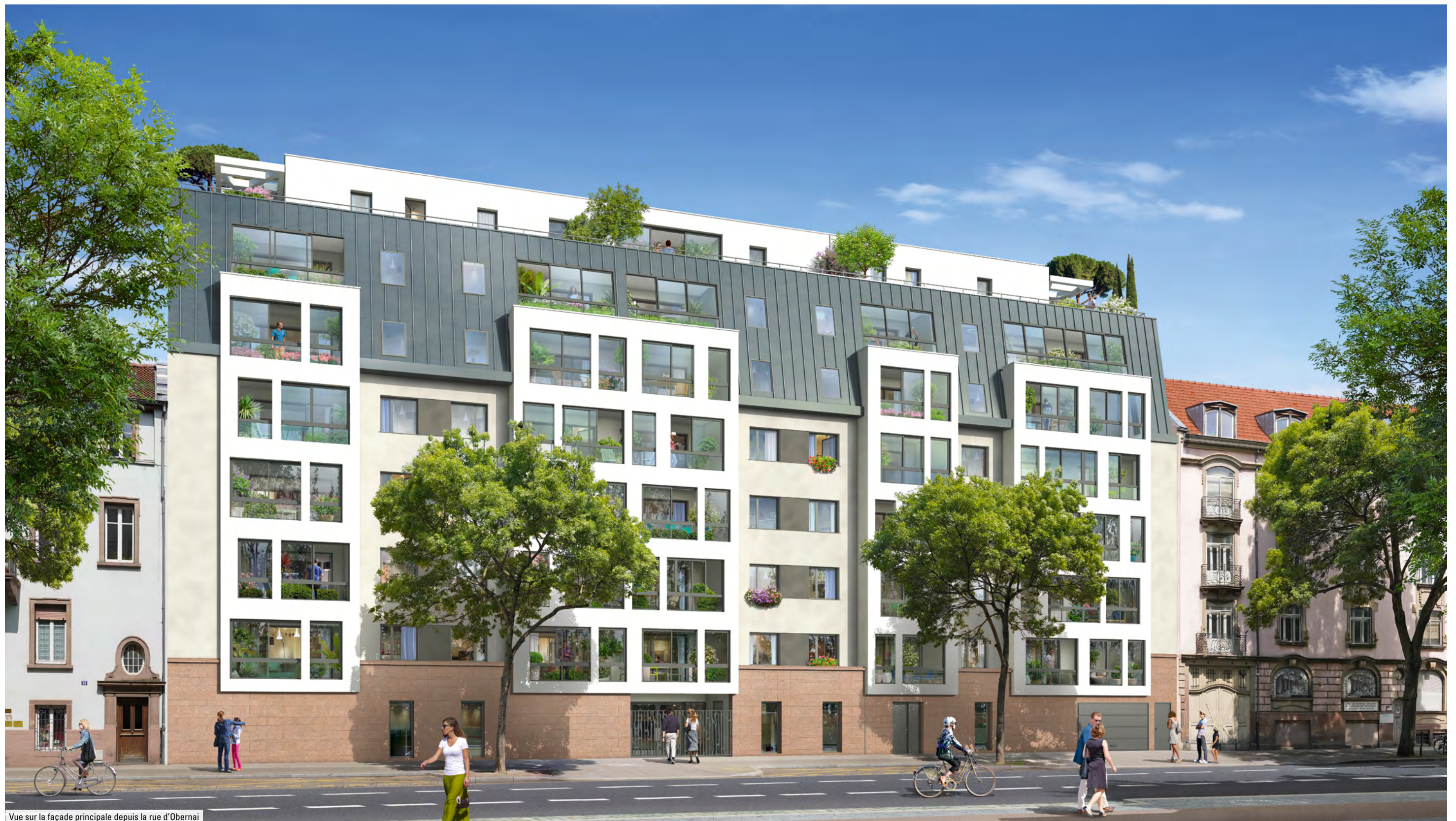
Vue sur la façade principale depuis la rue d'Obernai