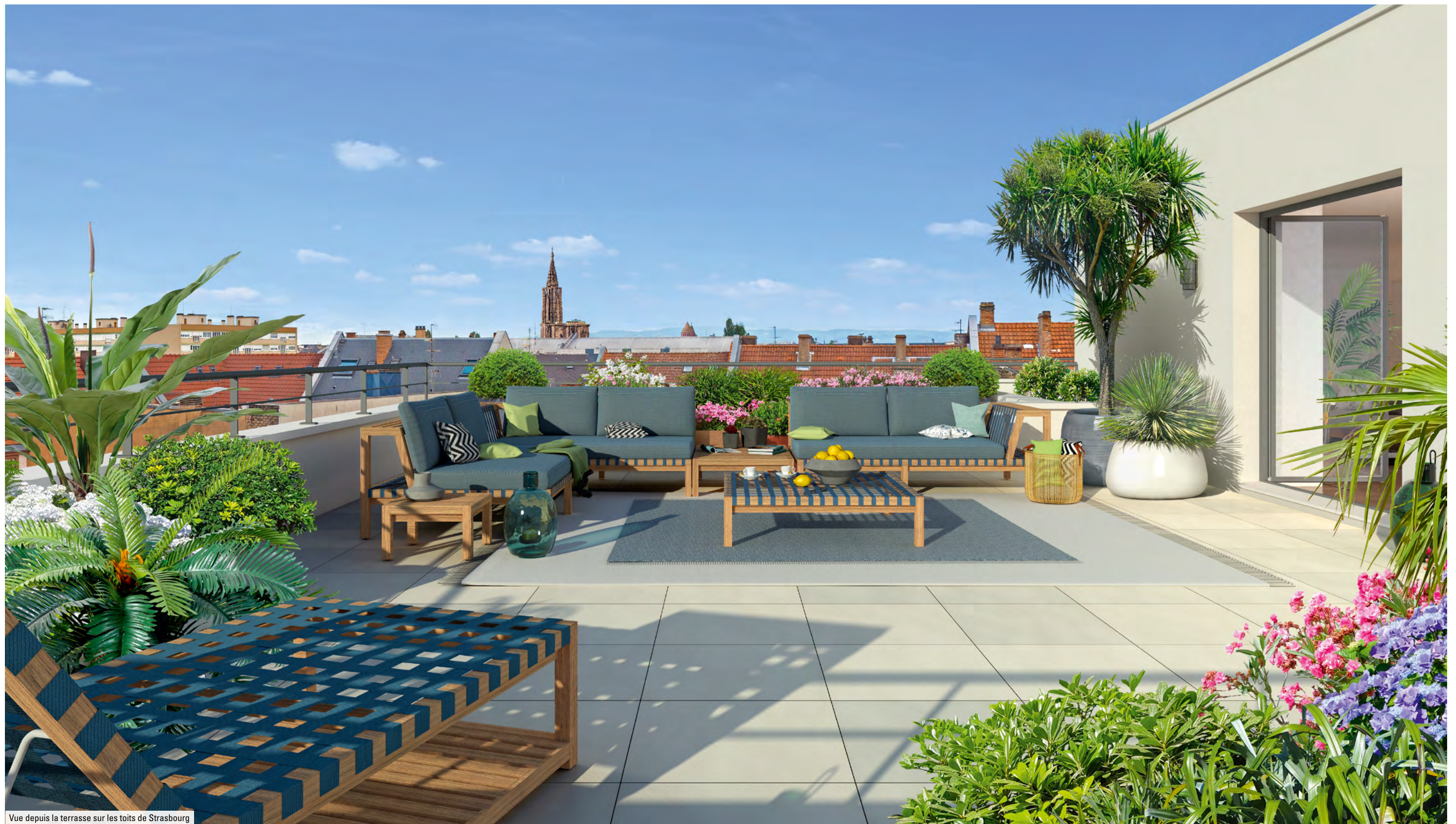
Vue depuis la terrasse sur les toits de Strasbourg