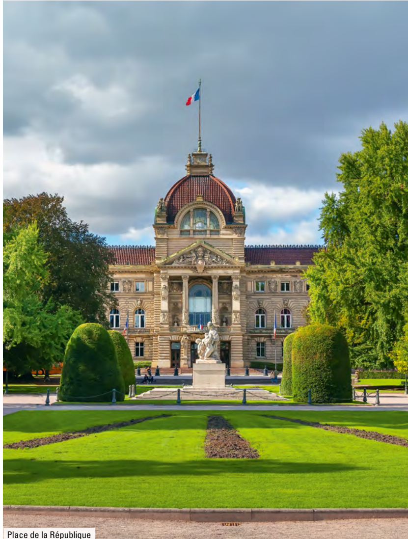
Place de la République