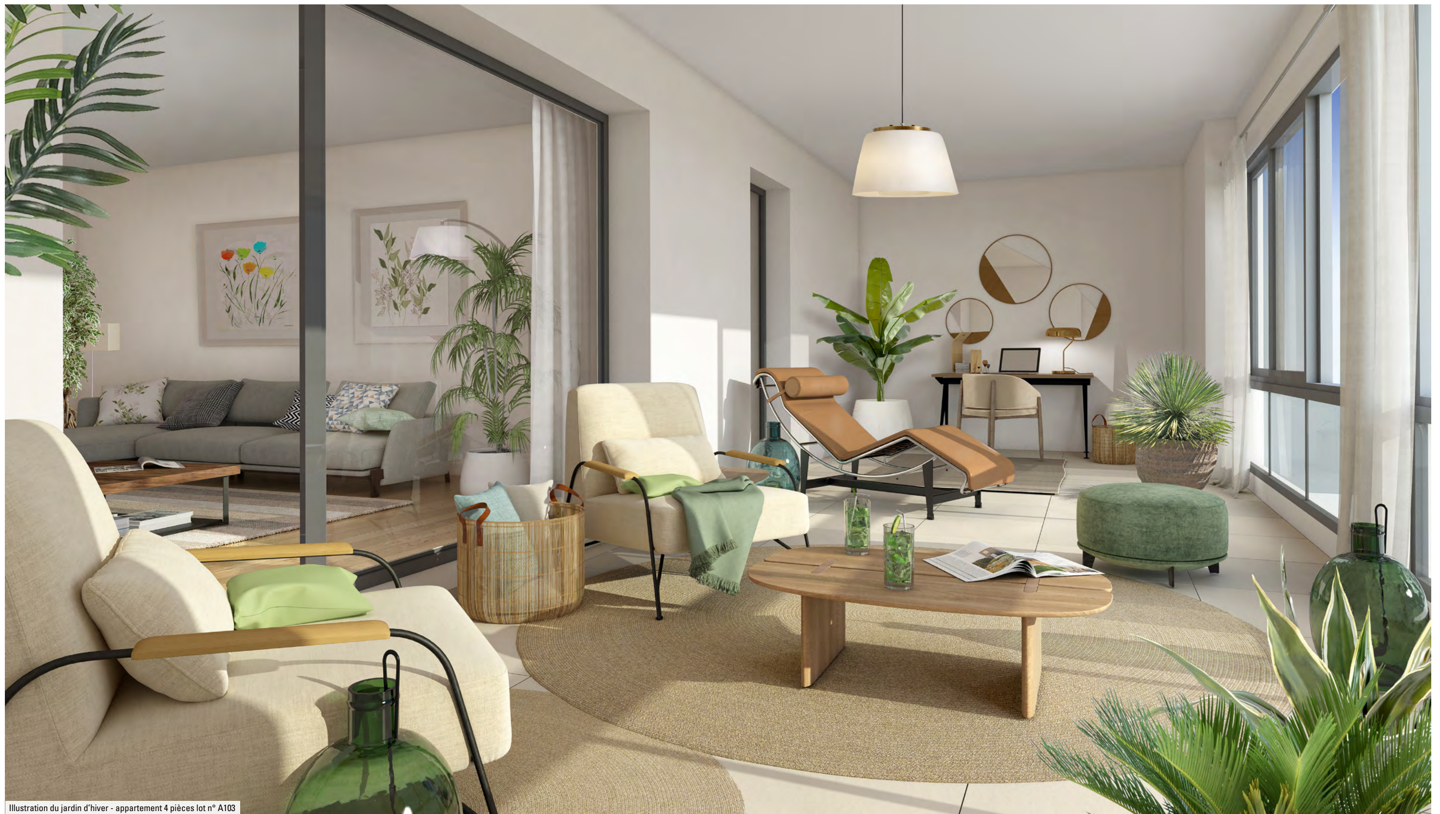
Illustration du jardin d'hiver - appartement 4 pièces lot n° A103