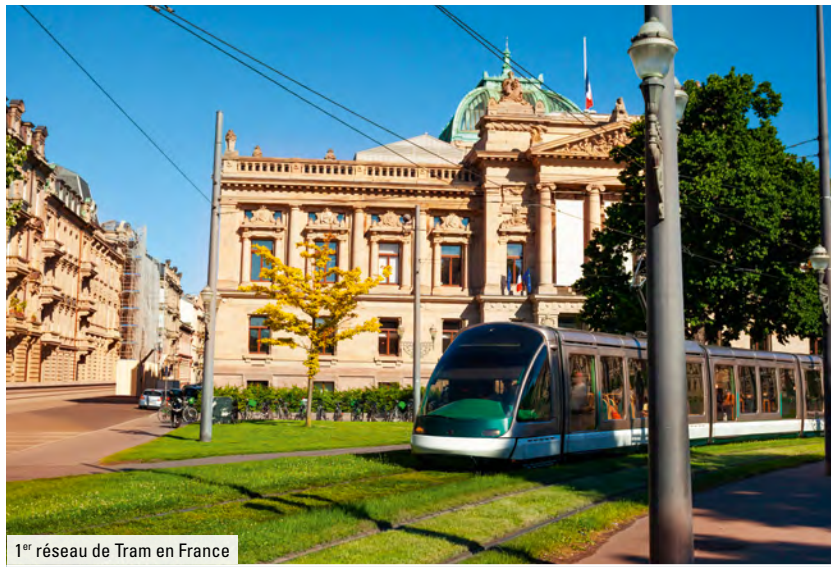
1 er réseau de Tram en France