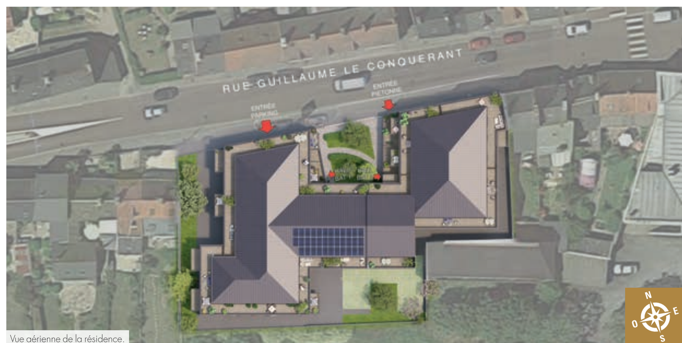
Vue aérienne de la résidence.