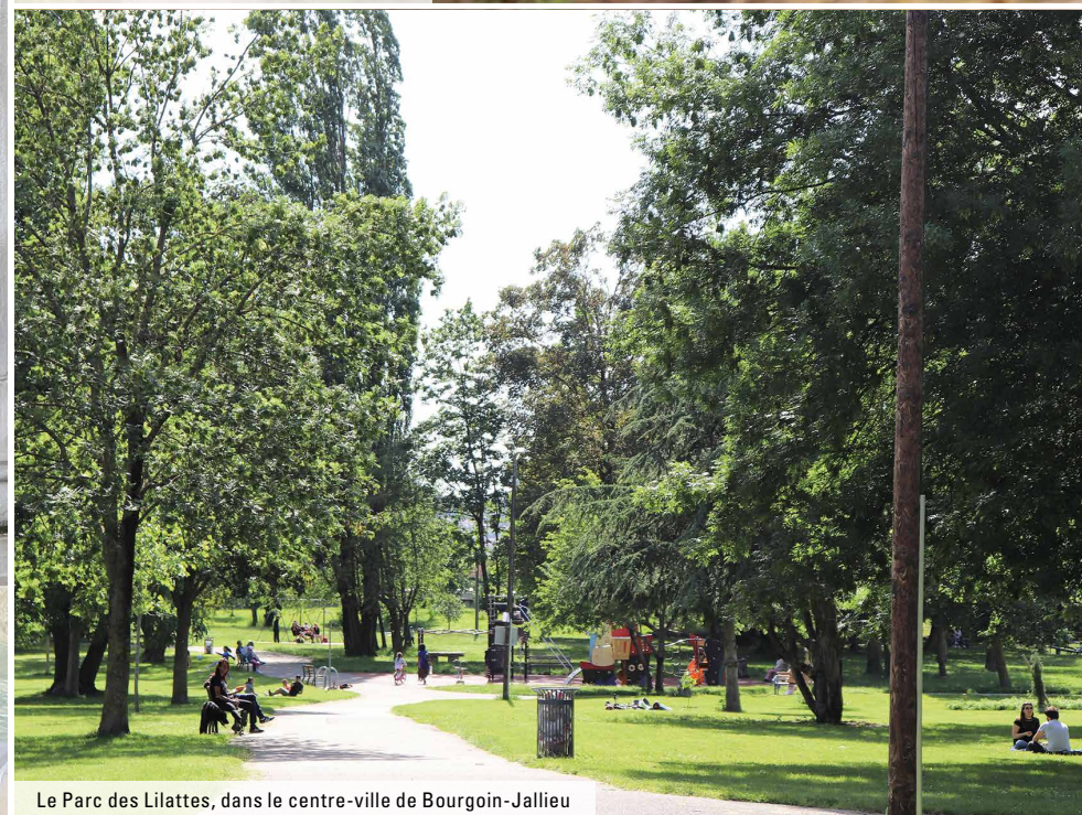
Le Parc des Lilattes, dans le centre-ville de Bourgoin-Jallieu