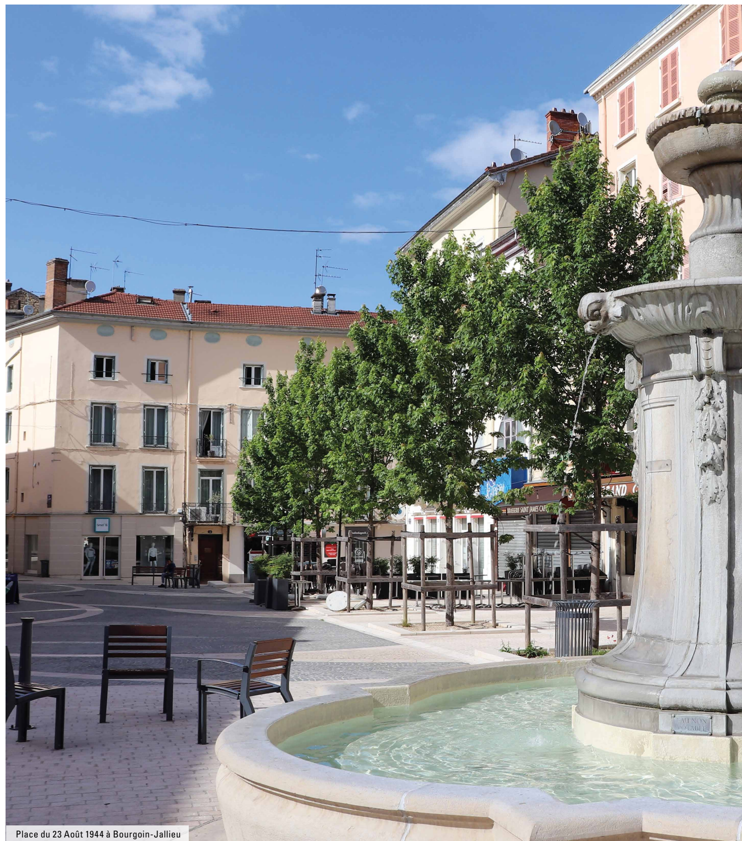
Place du 23 Août 1944 à Bourgoin-Jallieu