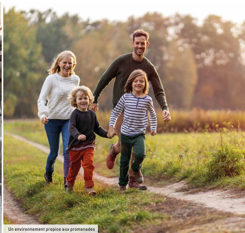
Un environnement propice aux promenades