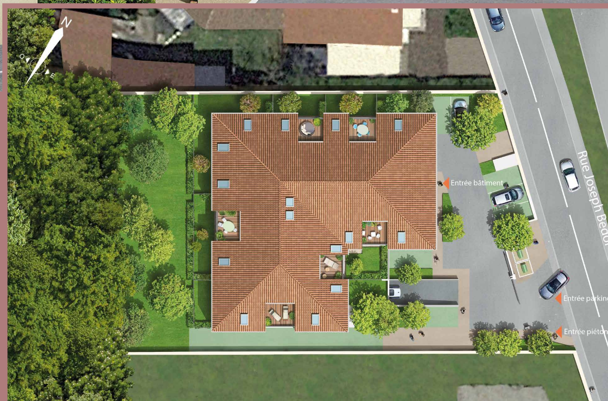
Plan masse de la réalisation

Visuel non contractuel à caractère d'ambiance