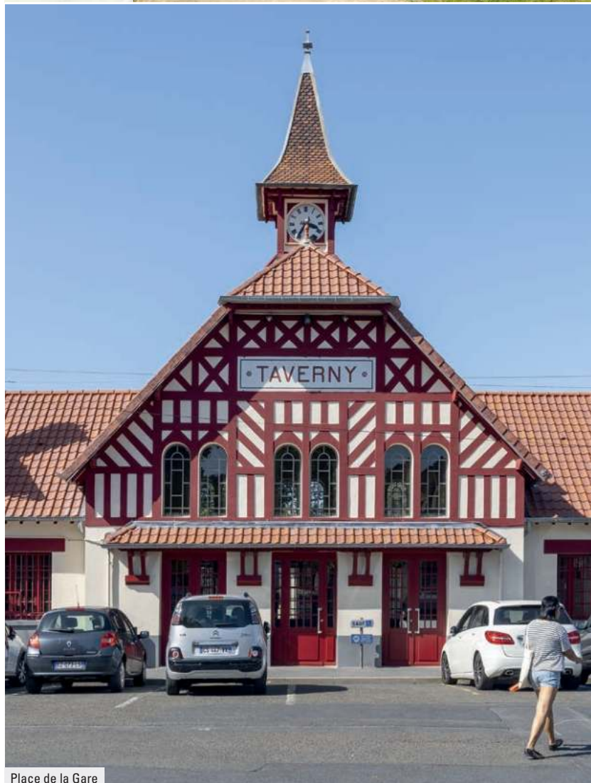
Place de la Gare