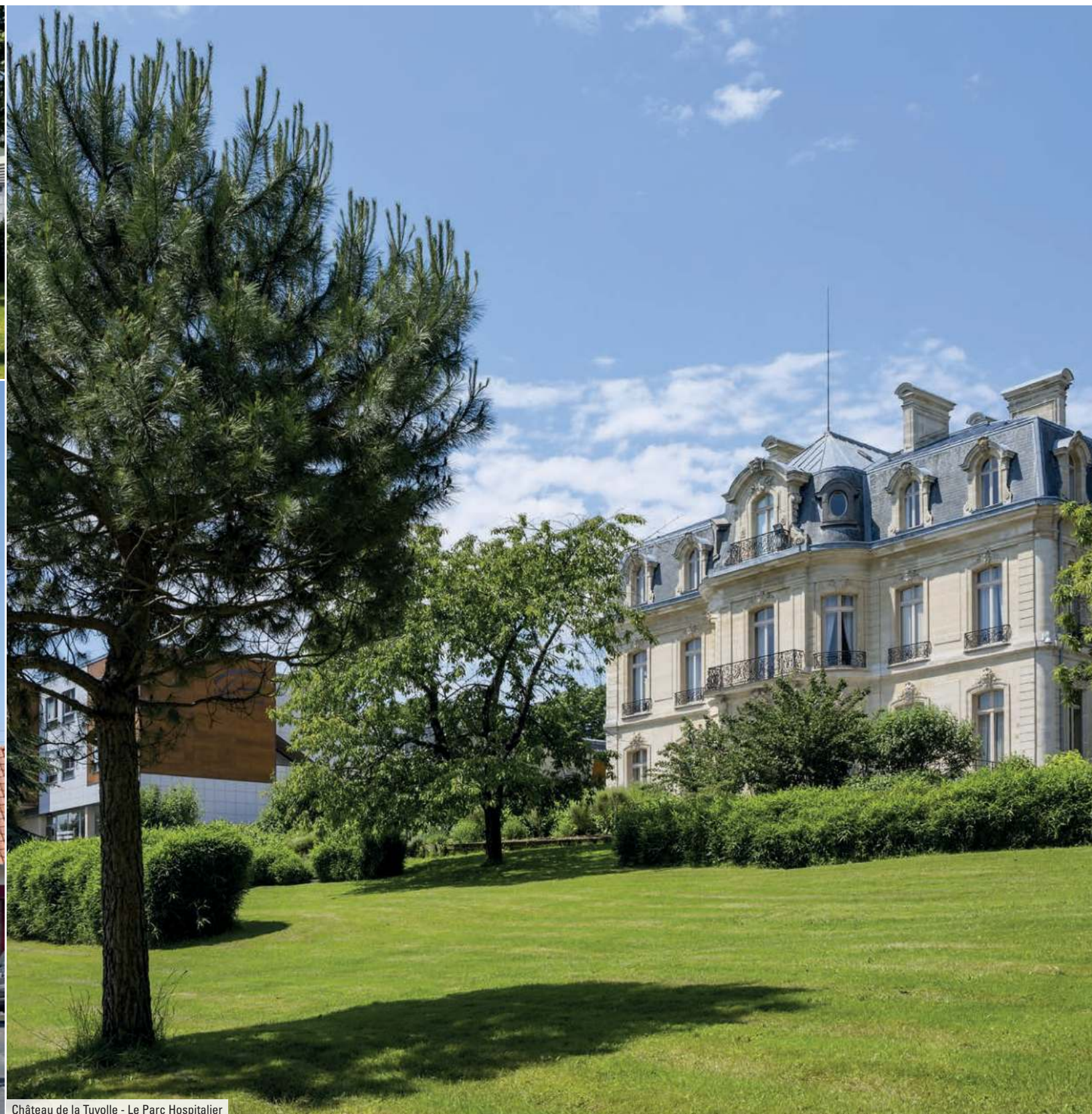
Château de la Tuyolle - Le Parc Hospitalier