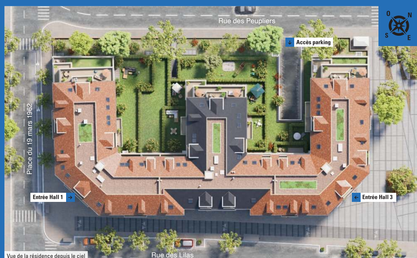
Vue de la résidence depuis le ciel

"Les Allées de Sainte-Honorine" s'inscrit dans la mouvance de l'architecture raffinée des deux premières réalisations signées Kaufman & Broad, situées de part et d'autre de ce nouvel opus. De 4 étages avec combles, elle arbore des lignes élégantes, s'inspirant notamment de celles des immeubles anciens, et offre un cachet indéniable.