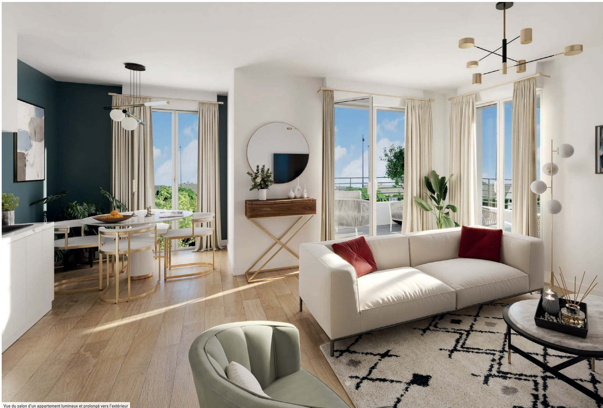
Vue du salon d'un appartement lumineux et prolongé vers l'extérieur