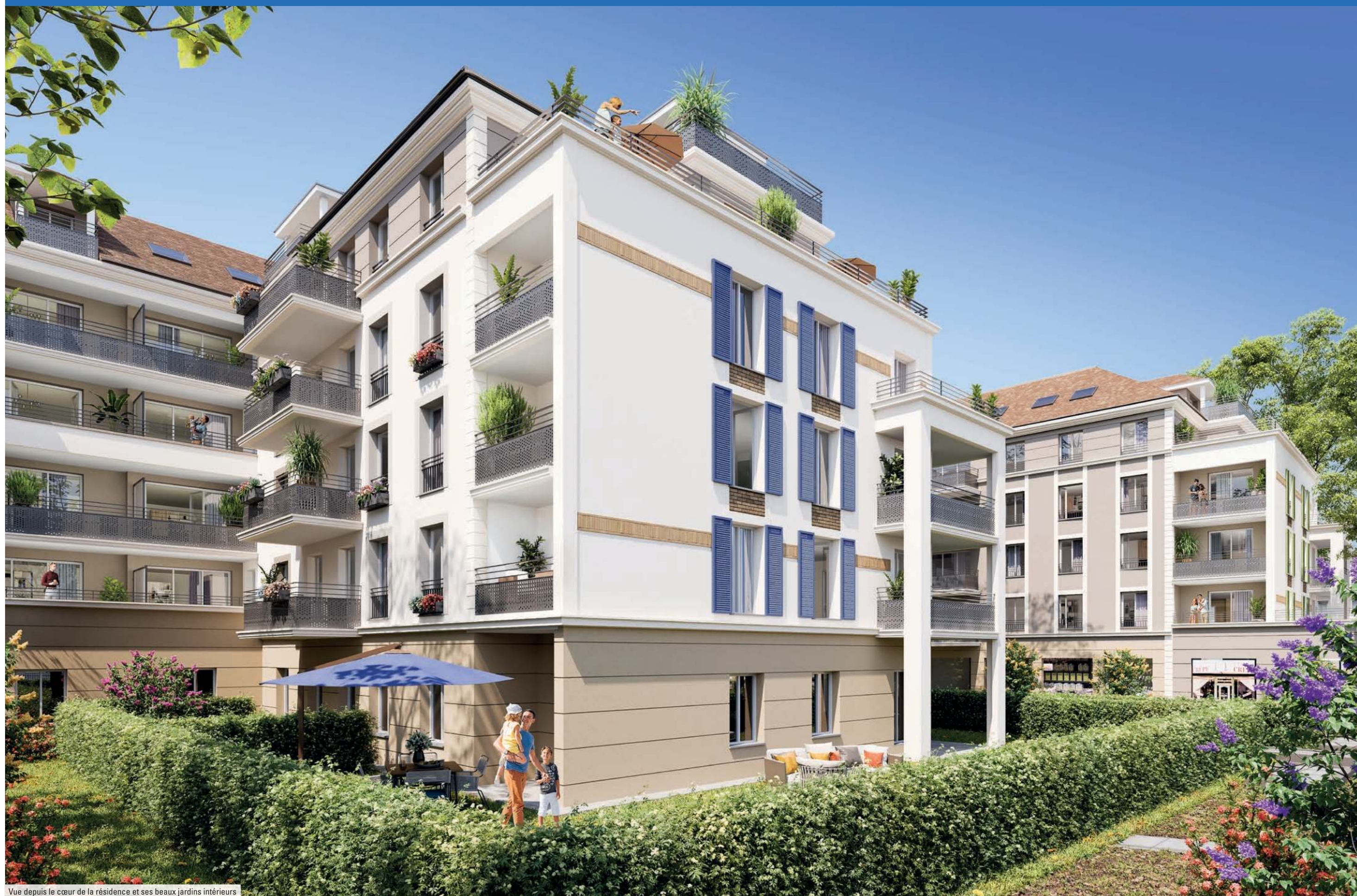
Vue depuis le cœur de la résidence et ses beaux jardins intérieurs

Apprécier chaque jour la sérénité d'un beau cœur d'îlot paysager et profiter ainsi d'un art de vie sans concession.