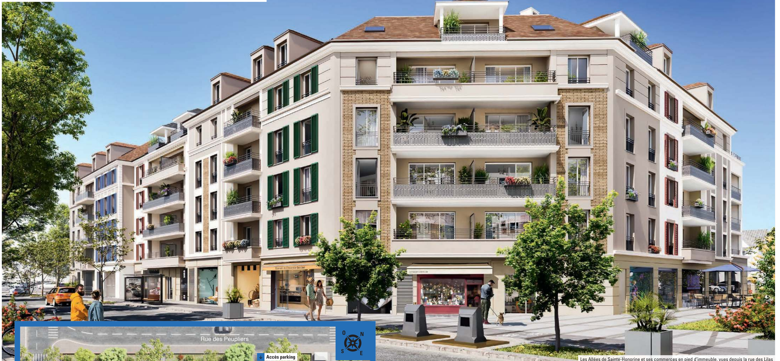
Les Allées de Sainte-Honorine et ses commerces en pied d'immeuble, vues depuis la rue des Lilas

Tout le cachet d'une architecture raffinée, aux lignes sobres et contemporaines.