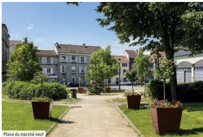
Place du marché neuf