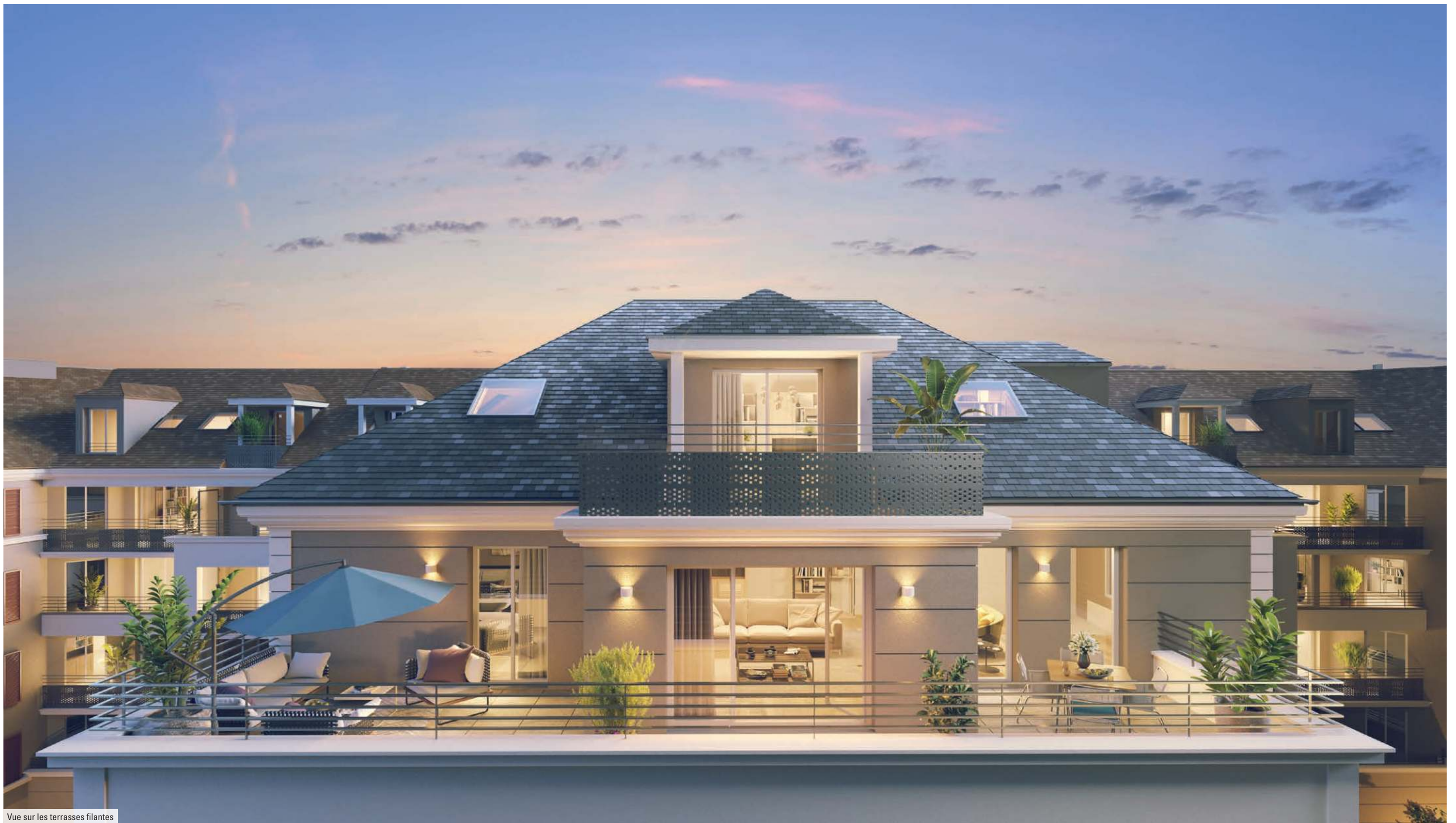
Vue sur les terrasses filantes