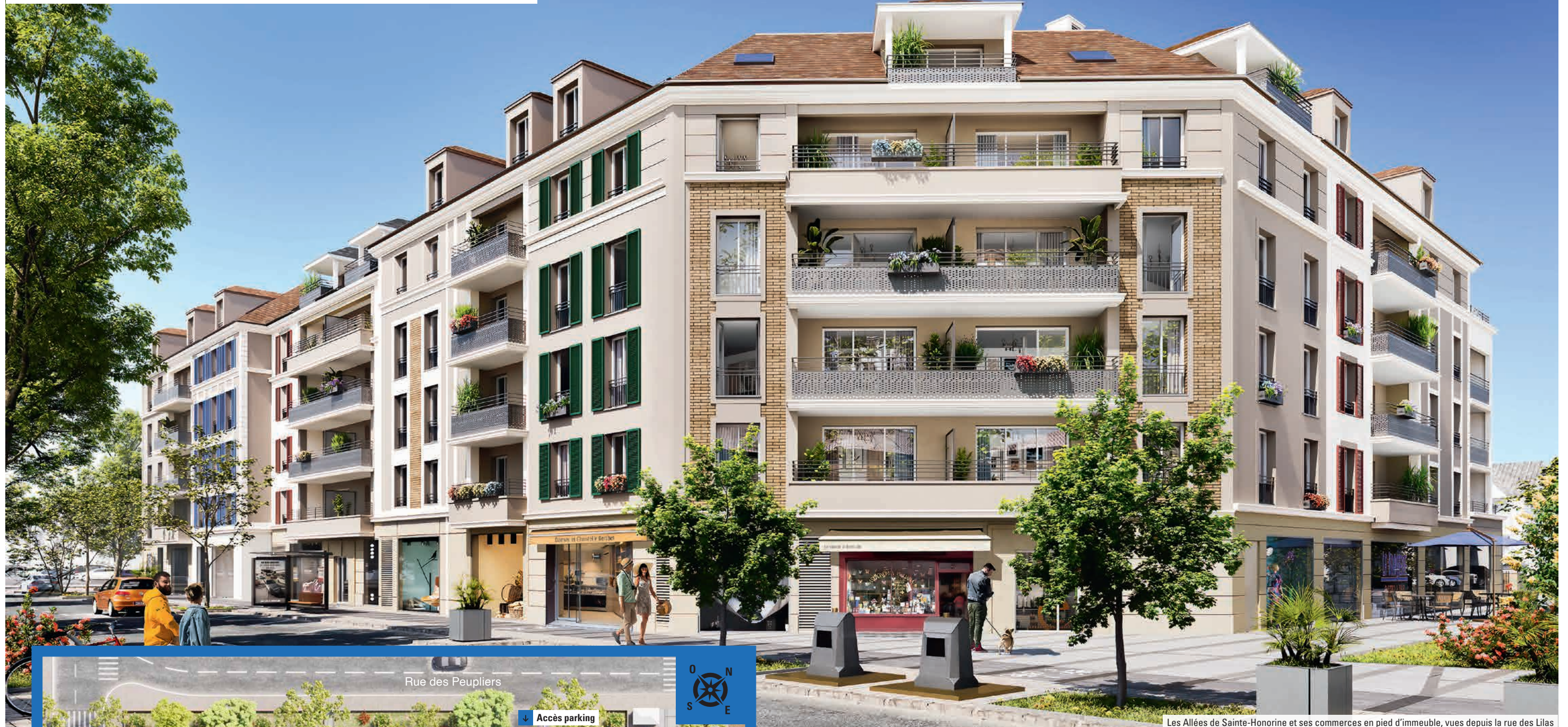
Les Allées de Sainte-Honorine et ses commerces en pied d'immeuble, vues depuis la rue des Lilas

Tout le cachet d'une architecture raffinée, aux lignes sobres et contemporaines.