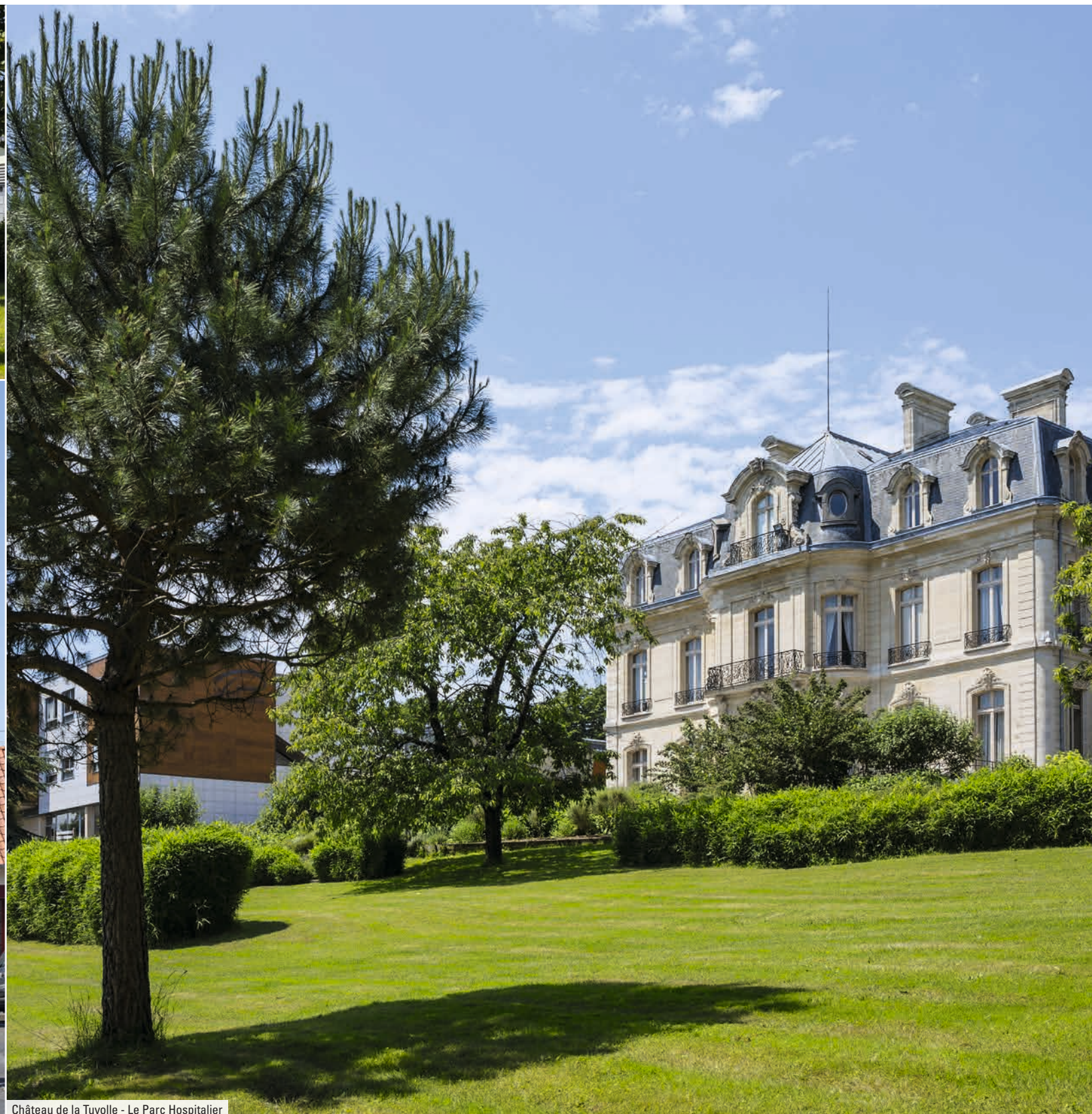
Château de la Tuyolle - Le Parc Hospitalier