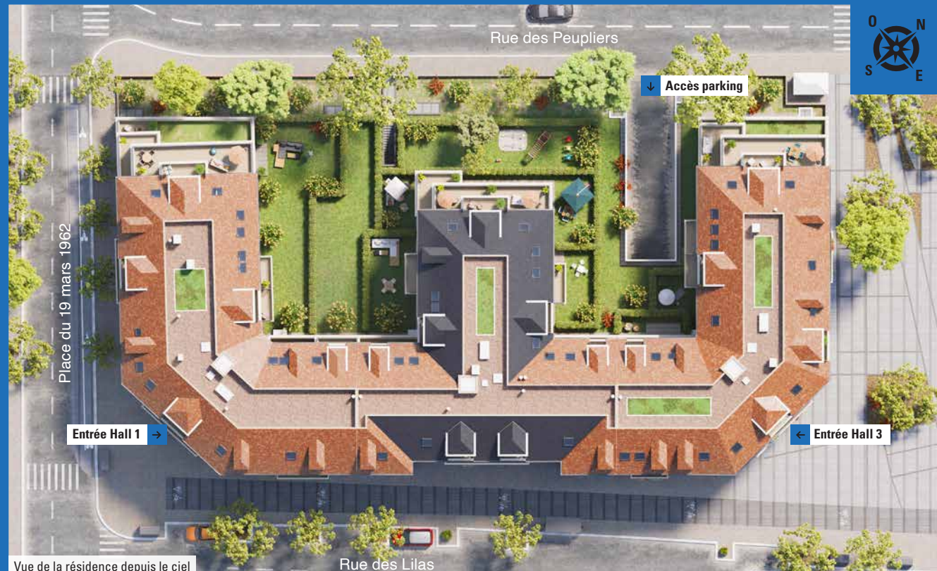
Vue de la résidence depuis le ciel

"Les Allées de Sainte-Honorine" s'inscrit dans la mouvance de l'architecture raffinée des deux premières réalisations signées Kaufman & Broad, situées de part et d'autre de ce nouvel opus. De 4 étages avec combles, elle arbore des lignes élégantes, s'inspirant notamment de celles des immeubles anciens, et offre un cachet indéniable.