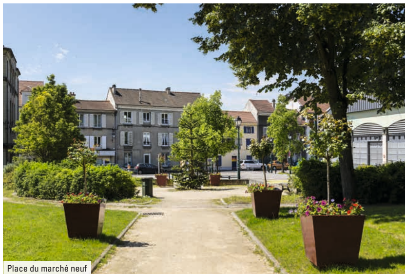
Place du marché neuf