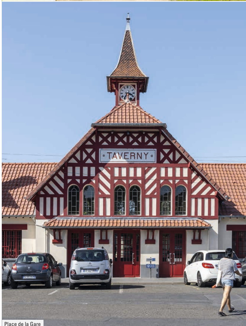
Place de la Gare