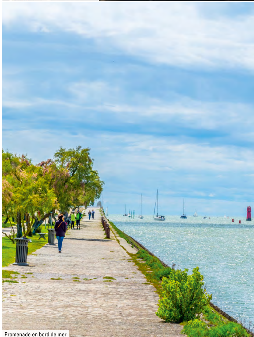
Promenade en bord de mer