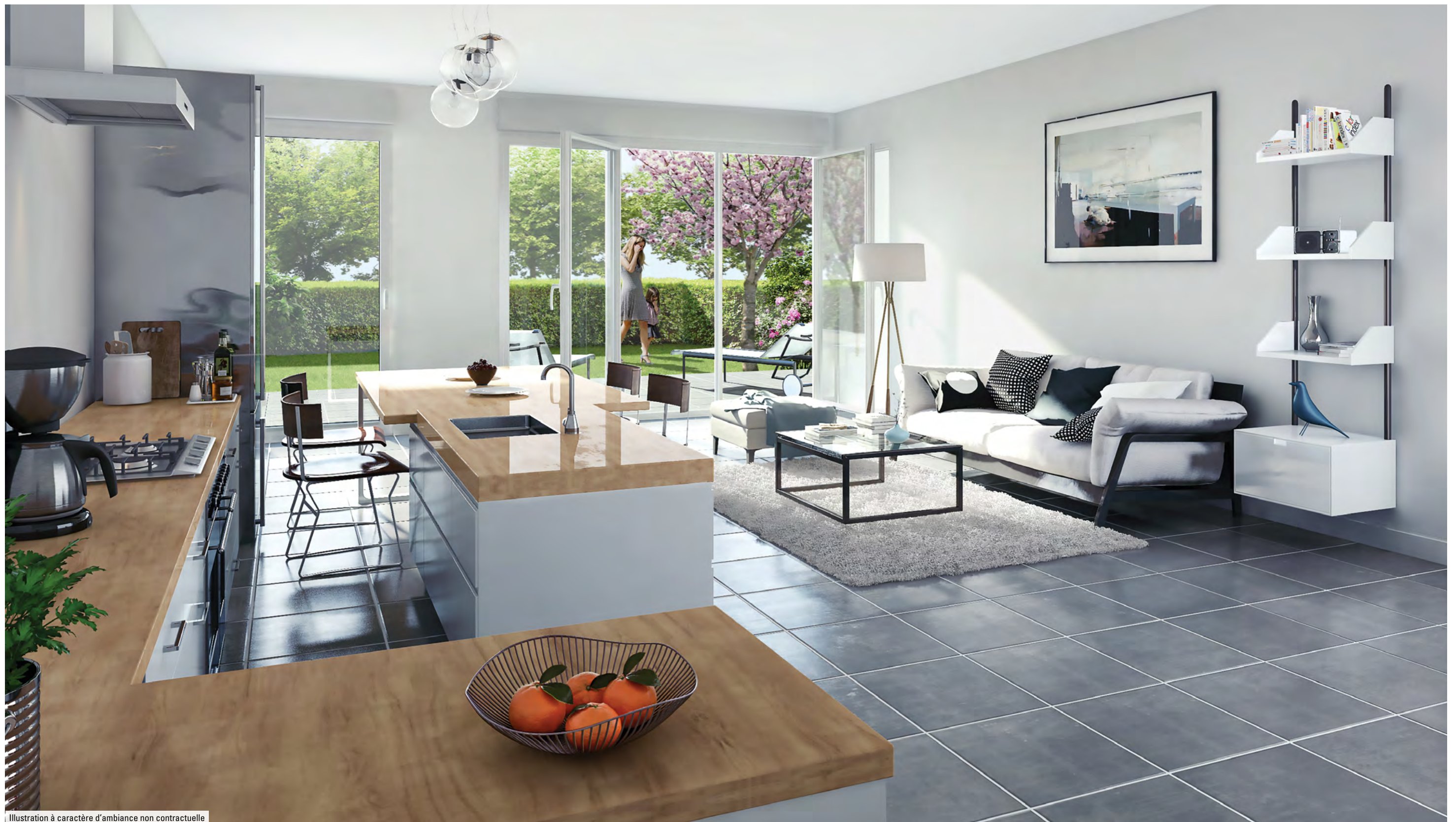
Illustration à caractère d'ambiance non contractuelle

Maison ou appartement, choisissez votre style de vie et votre confort.