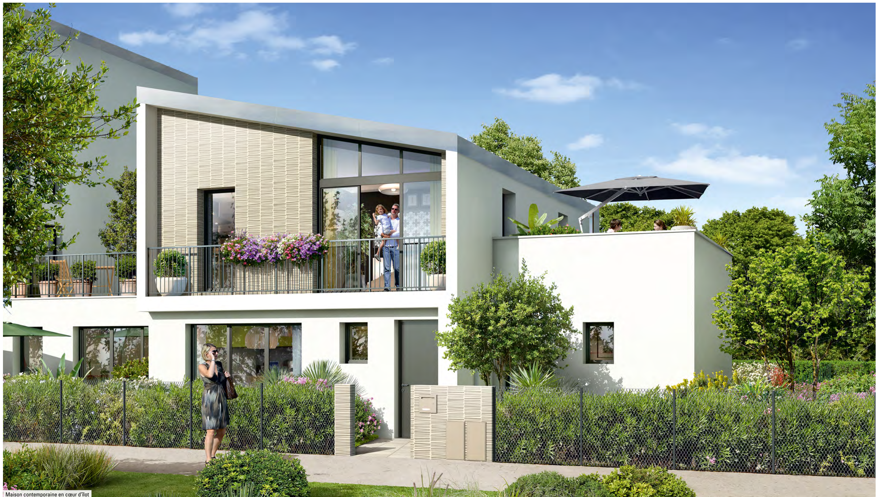
Maison contemporaine en cœur d'îlot

Une conception originale alliant authenticité et écriture contemporaine.