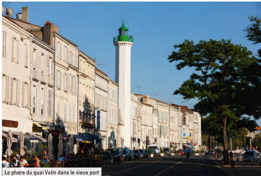
Le phare du quai Valin dans le vieux port