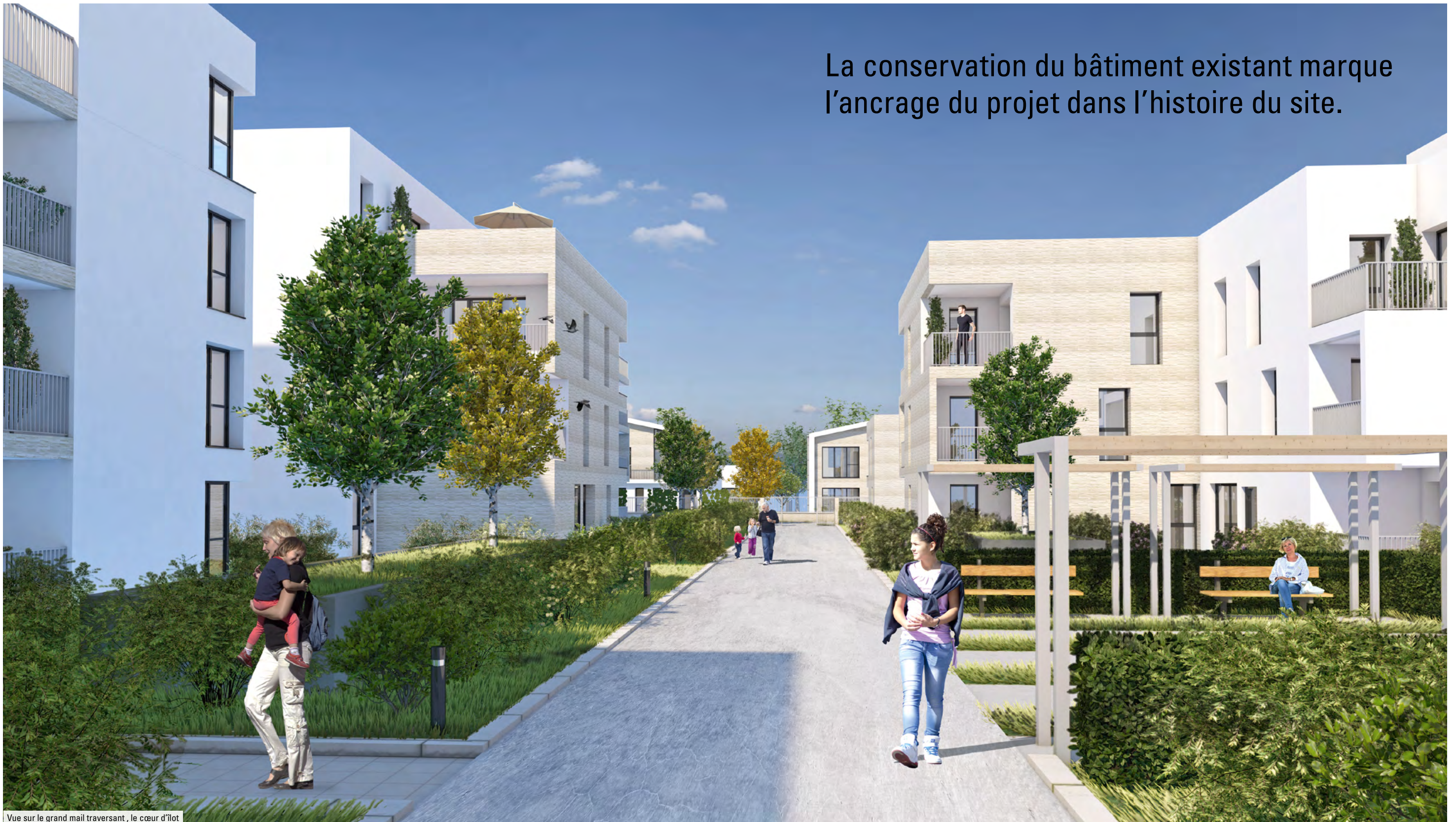
Vue sur le grand mail traversant, le cœur d'îlot

La conservation du bâtiment existant marque l'ancrage du projet dans l'histoire du site.