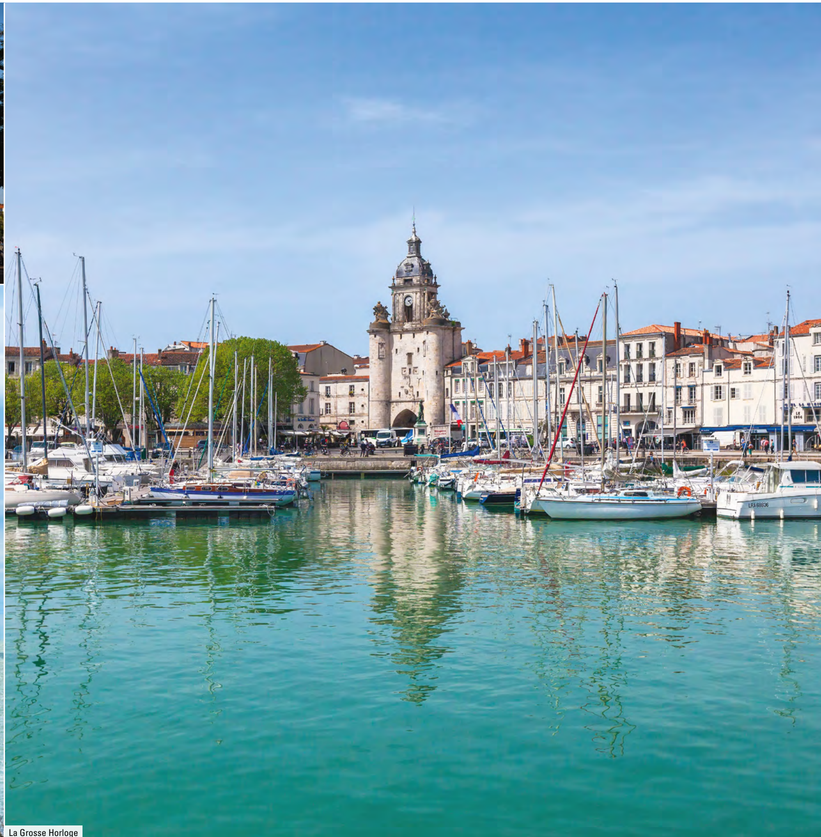
La Grosse Horloge