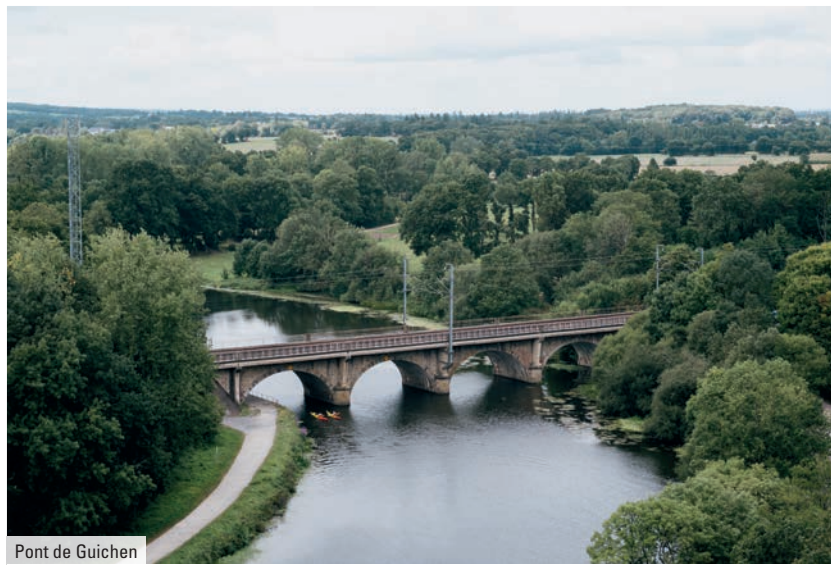
Pont de Guichen