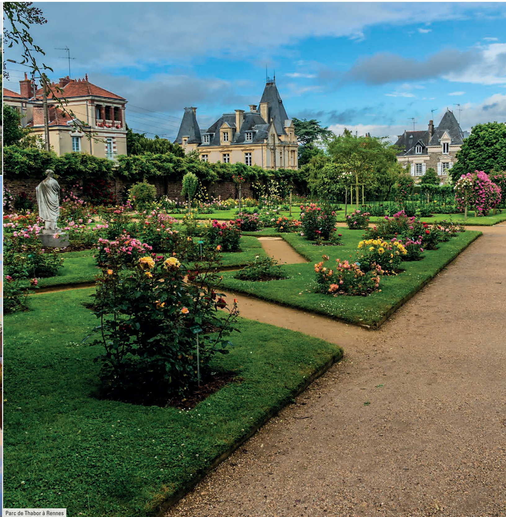
Parc de Thabor à Rennes