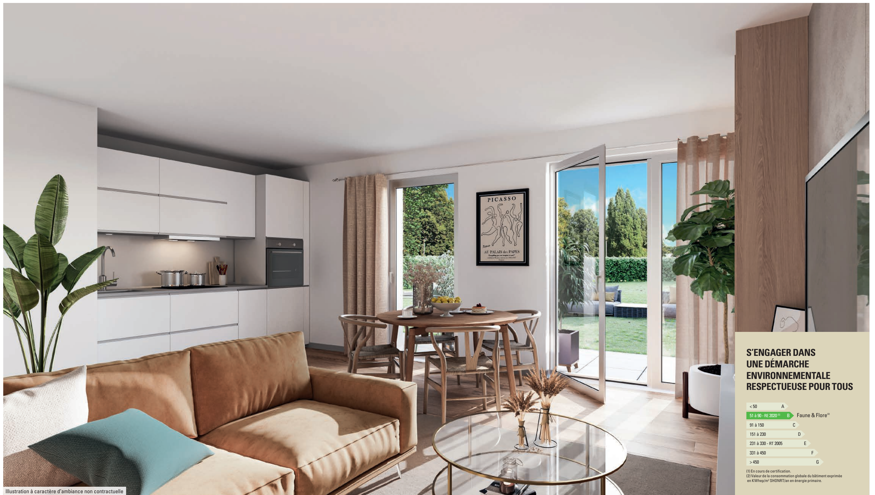
Illustration à caractère d'ambiance non contractuelle

Des appartements où chaque détail participe au confort de vie.