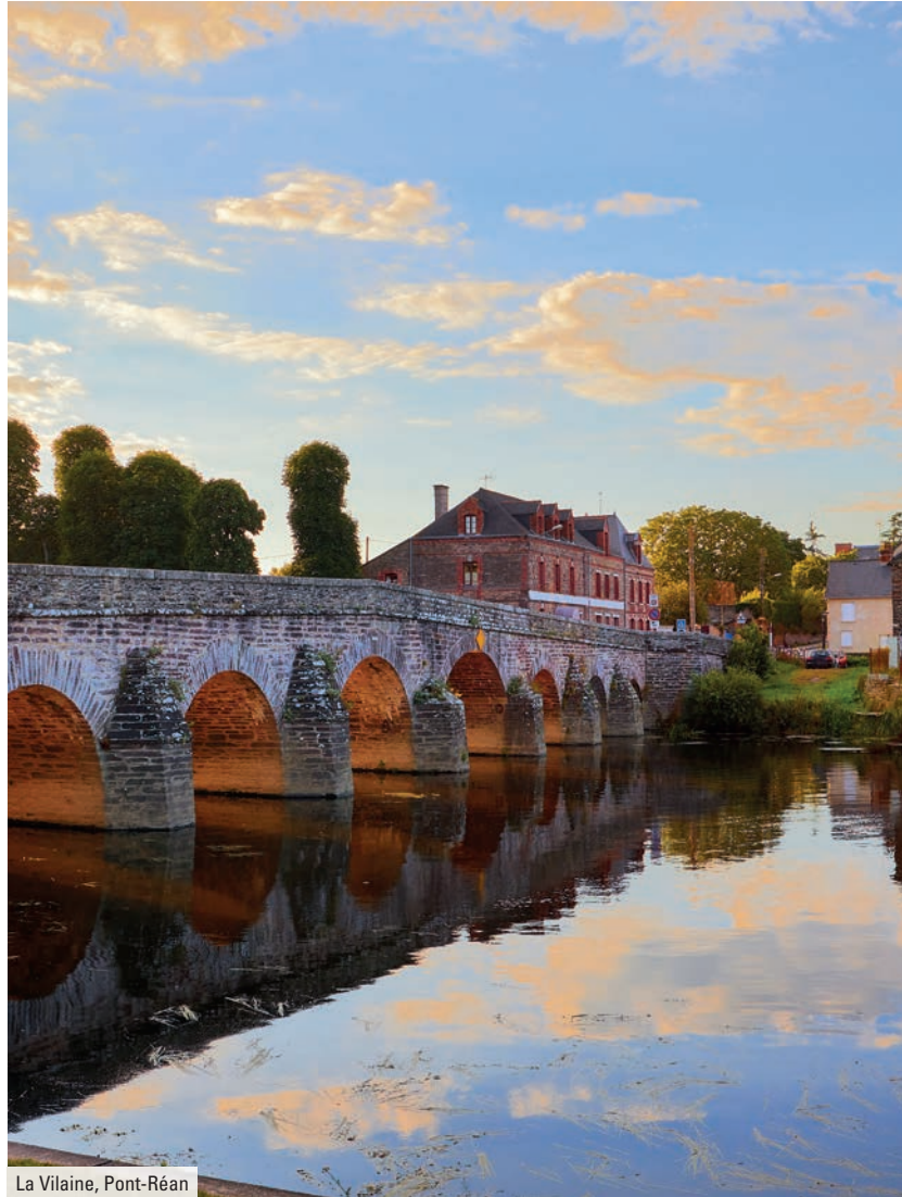
La Vilaine, Pont-Réan