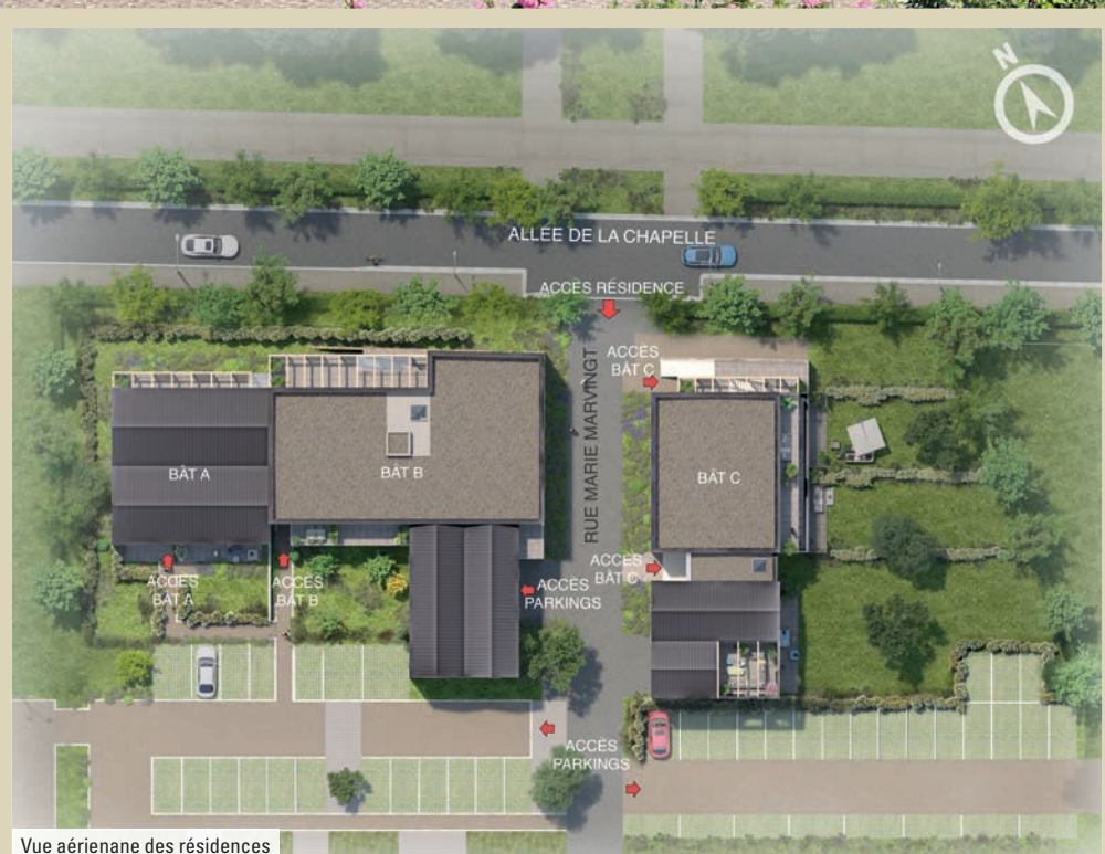
Vue aérienne des résidences