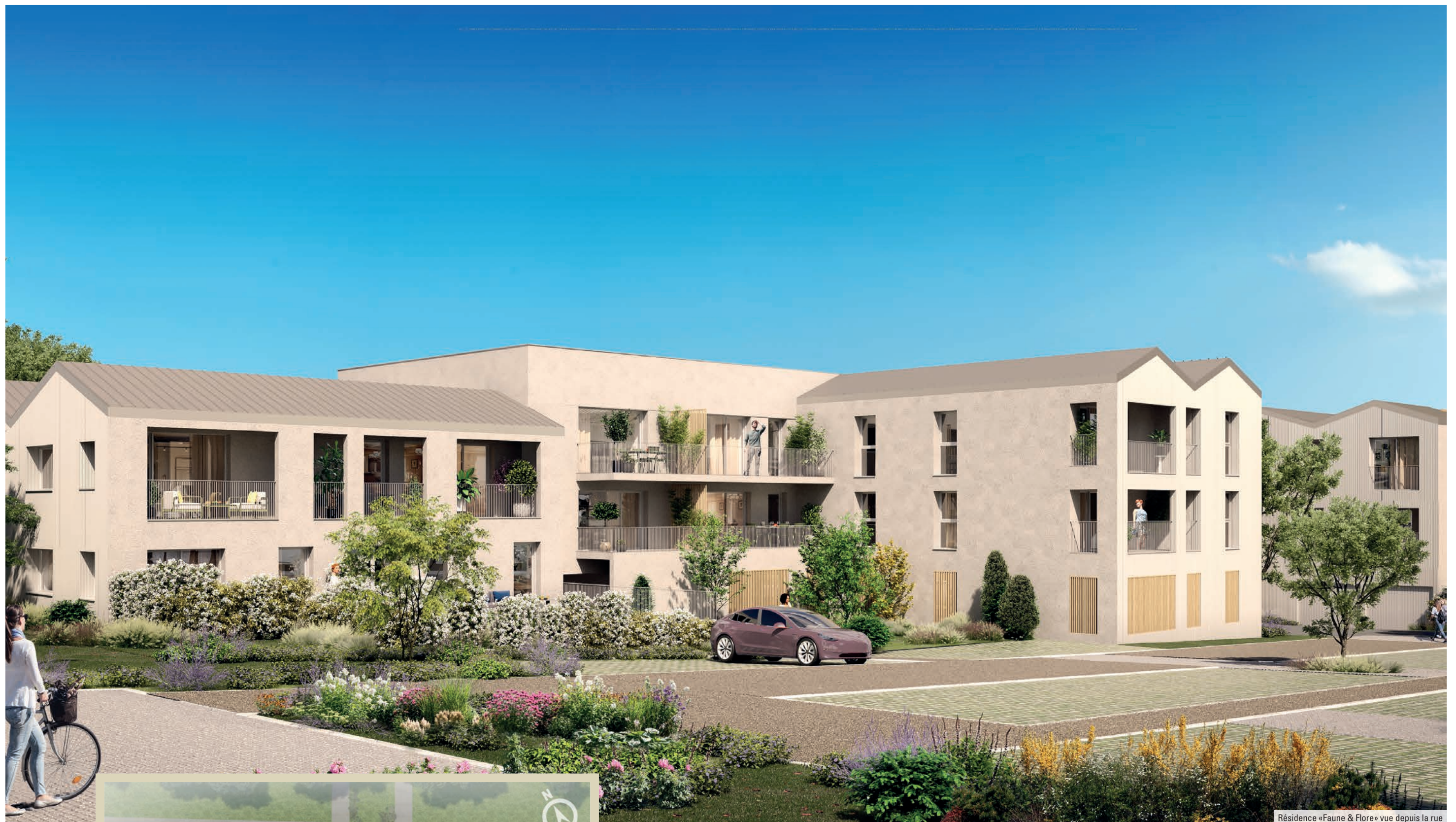
Résidence «Faune & Flore» vue depuis la rue