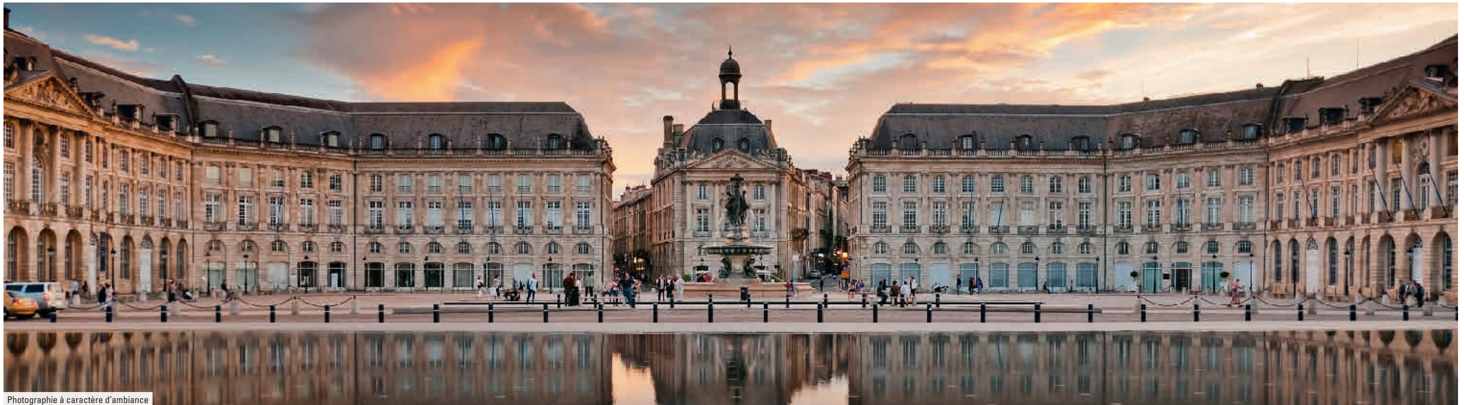
Photographie à caractère d'ambiance

Bordeaux s'est rapidement imposée comme l'une des villes les plus dynamiques de l'hexagone. Plébiscitée pour sa qualité de vie, son arrière-pays préservé, elle n'en finit pas d'attirer entreprises et nouveaux habitants. Pour preuve de ses charmes, Bordeaux prévoit de dépasser le million d'habitants à partir de 2030.