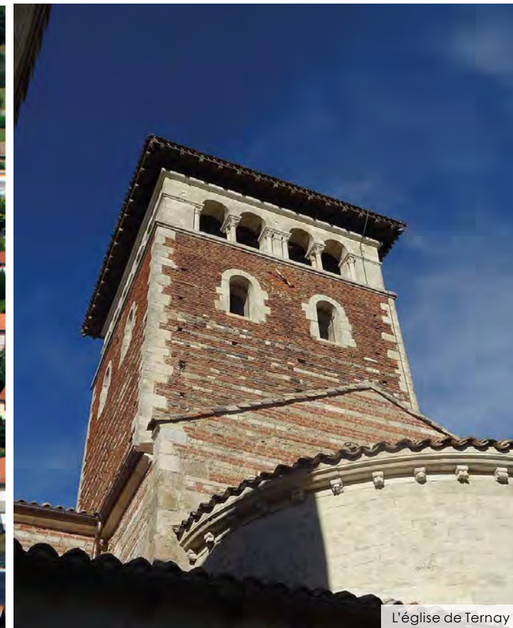
L'église de Ternay