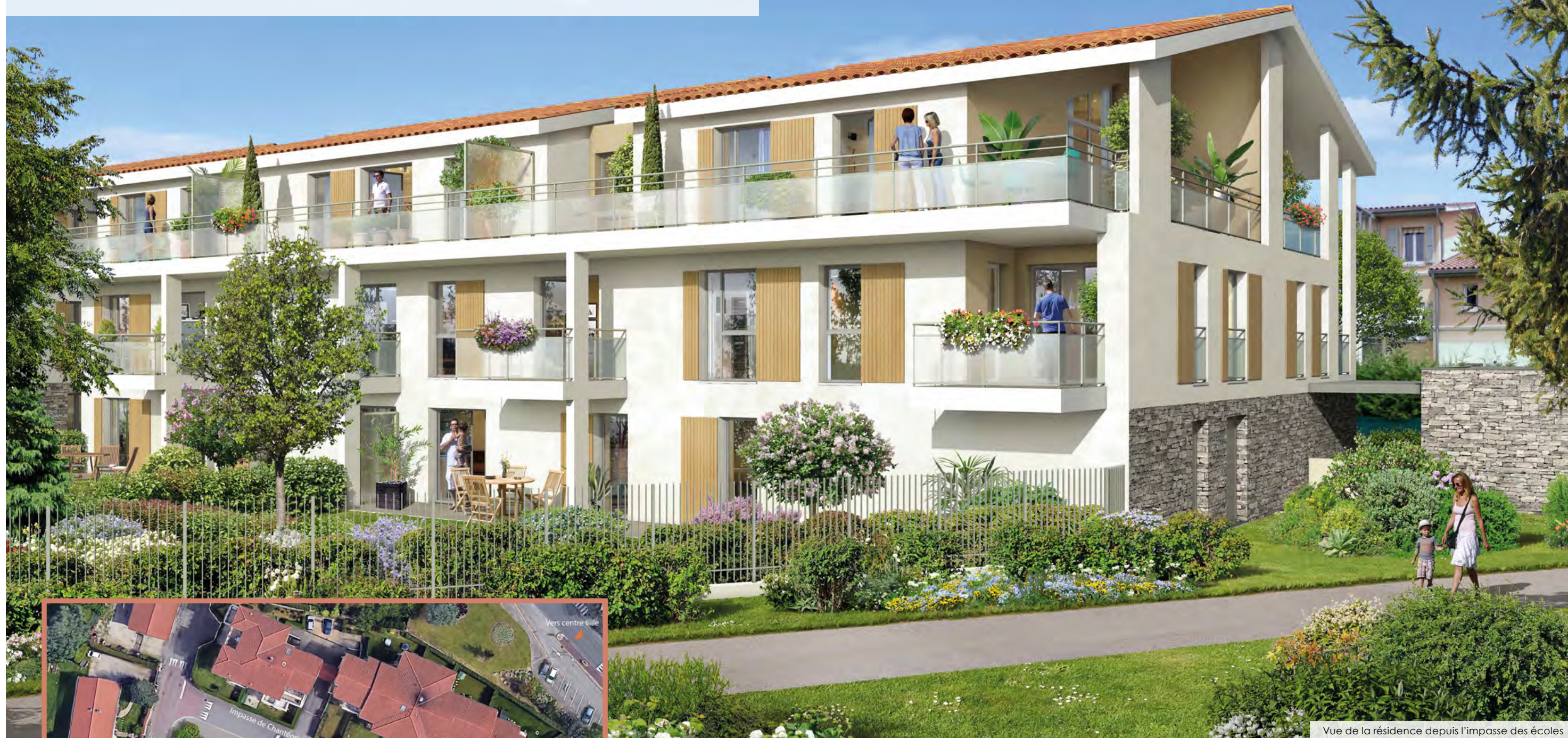
Vue de la résidence depuis l'impasse des écoles

Une résidence paisible, bercée par la verdure, synonyme de douceur de vivre