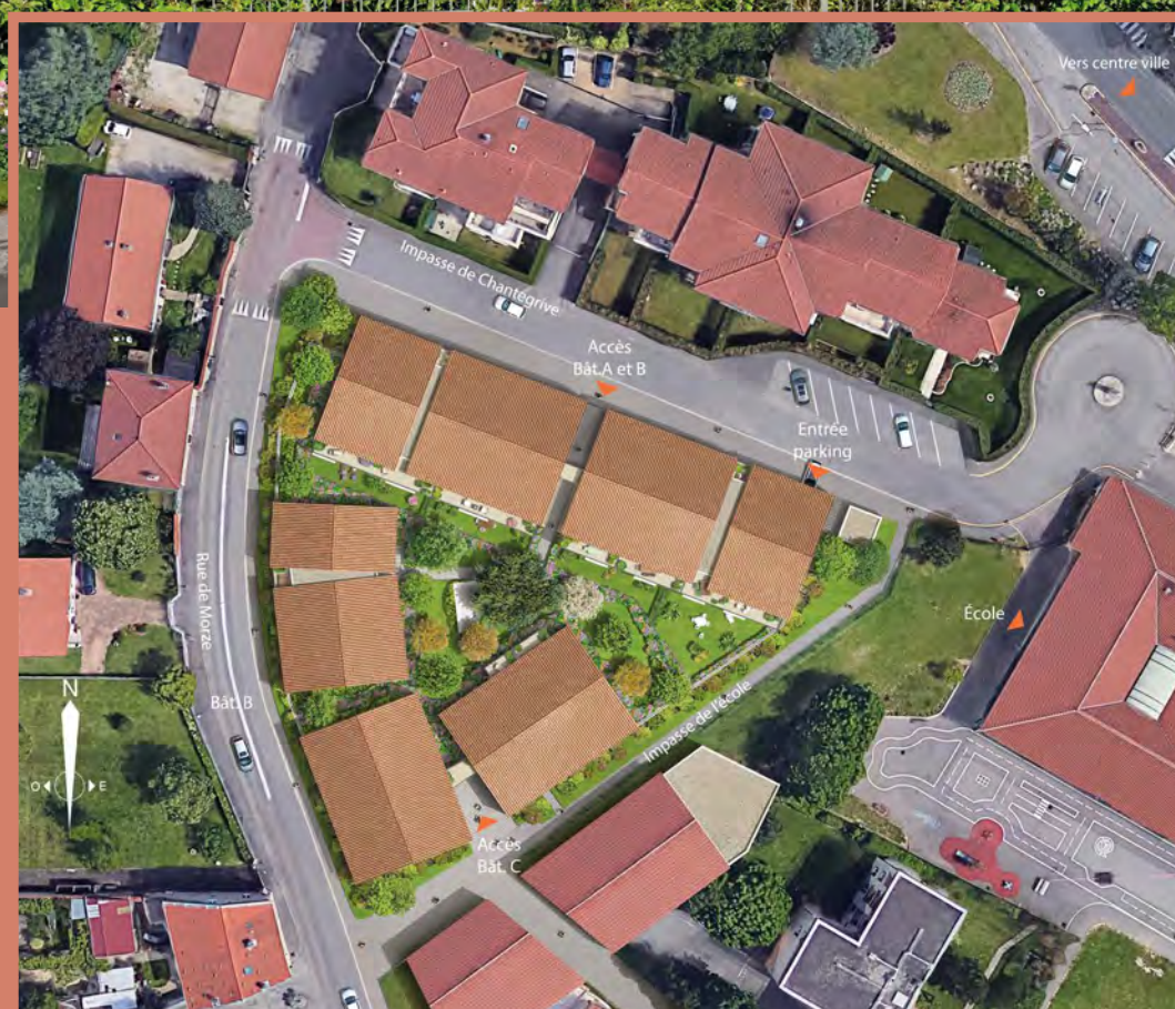
Plan masse de la réalisation

Les Marelles trouvent aisément leur place dans un décor bucolique. Dans un style architectural mêlant modernité et tradition, les 5 volumes d'habitation s'habillent d'une toiture en tuiles, d'un soubassement en pierres et de teintes claires sur ses façades, participant à l'intégration harmonieuse de la résidence dans l'environnement du quartier. L'alliance subtile du bois pour les volets et du verre opacifié réhaussée d'une touche d'aluminium pour les garde-corps donnent tout son caractère à l'ensemble.