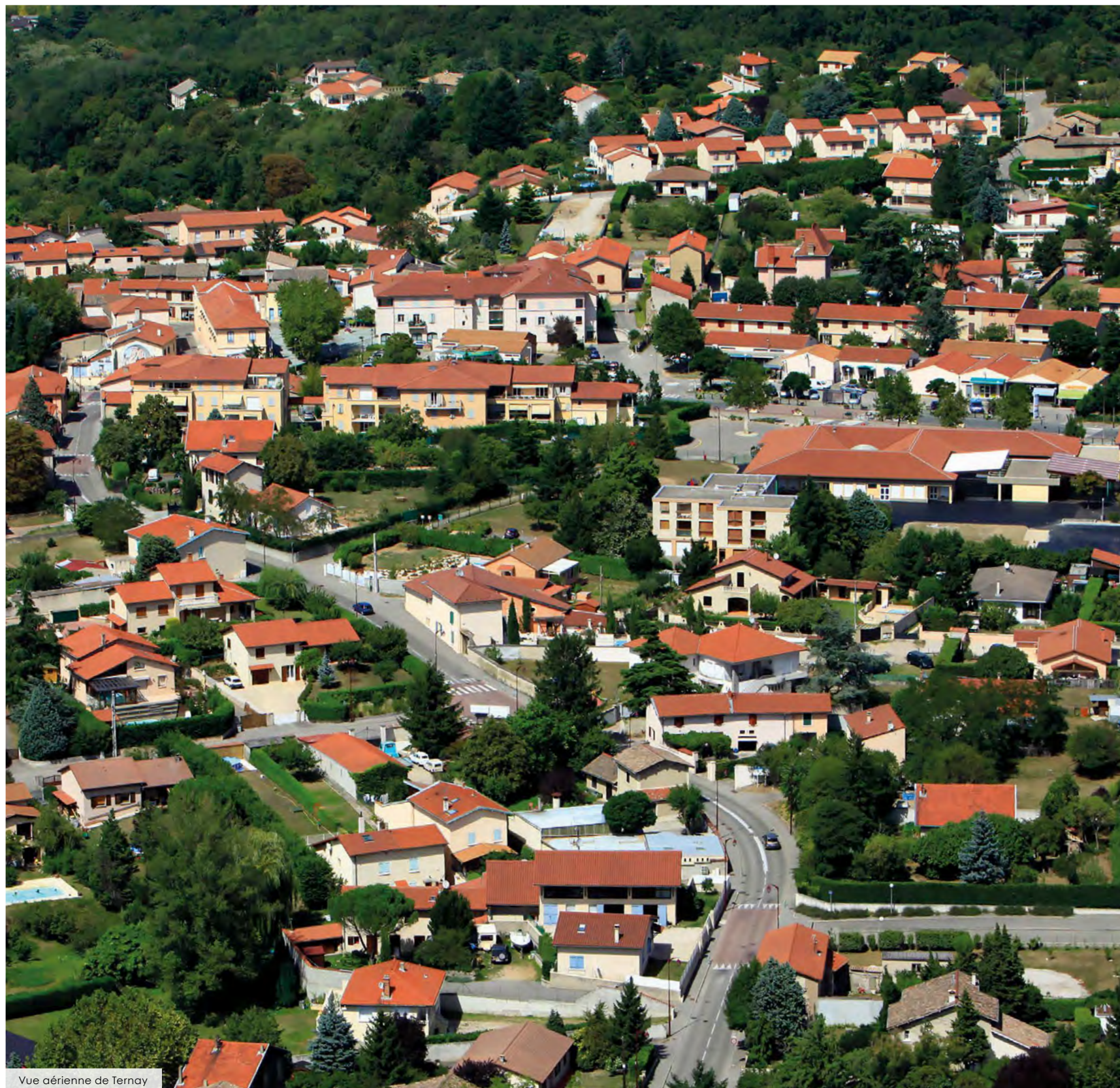
Vue aérienne de Ternay