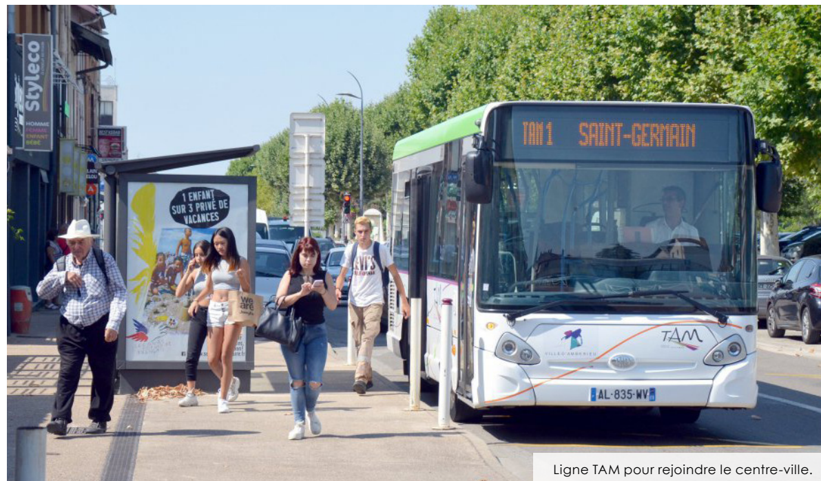
Ligne TAM pour rejoindre le centre-ville.