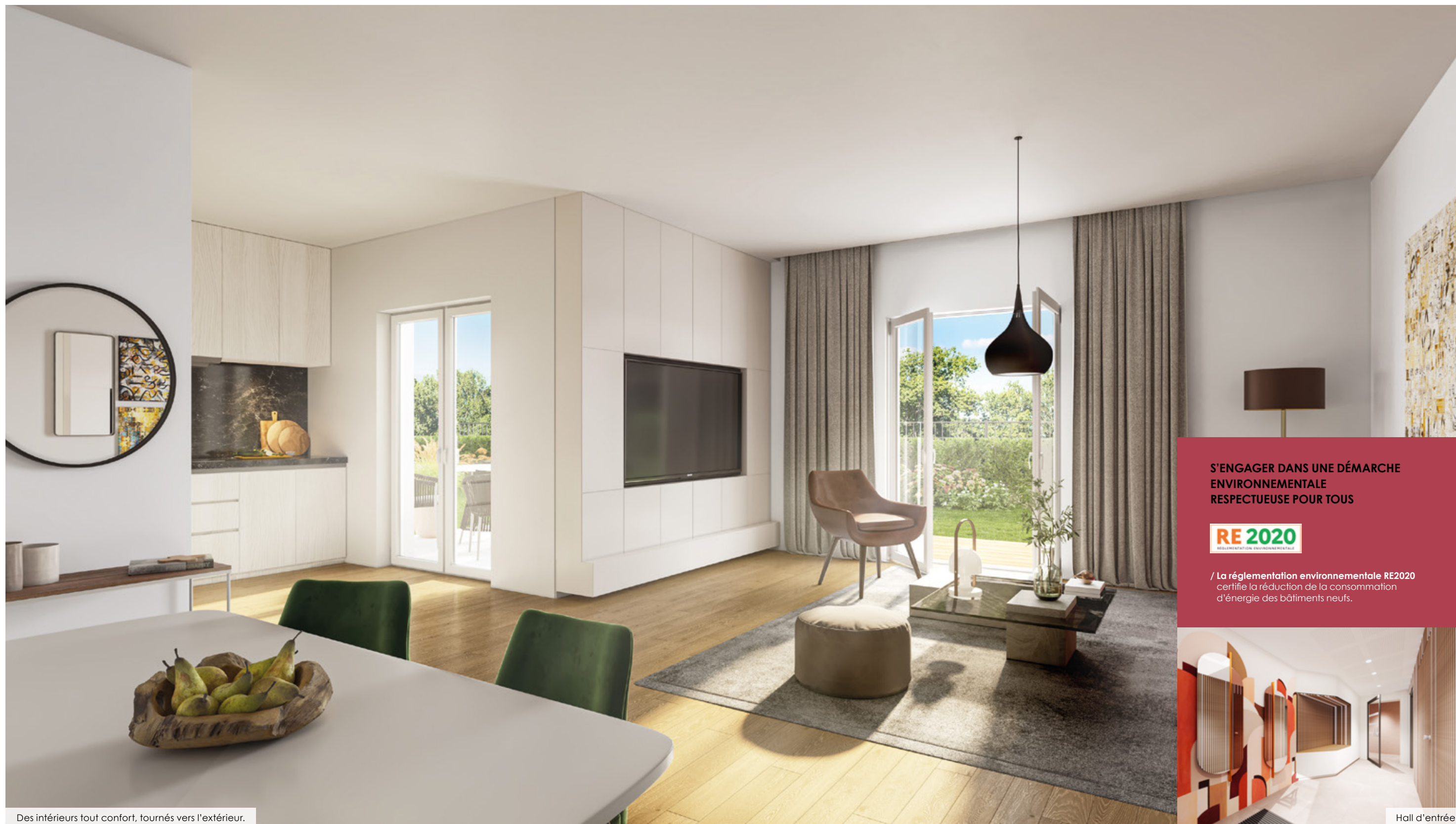
Des intérieurs tout confort, tournés vers l'extérieur.