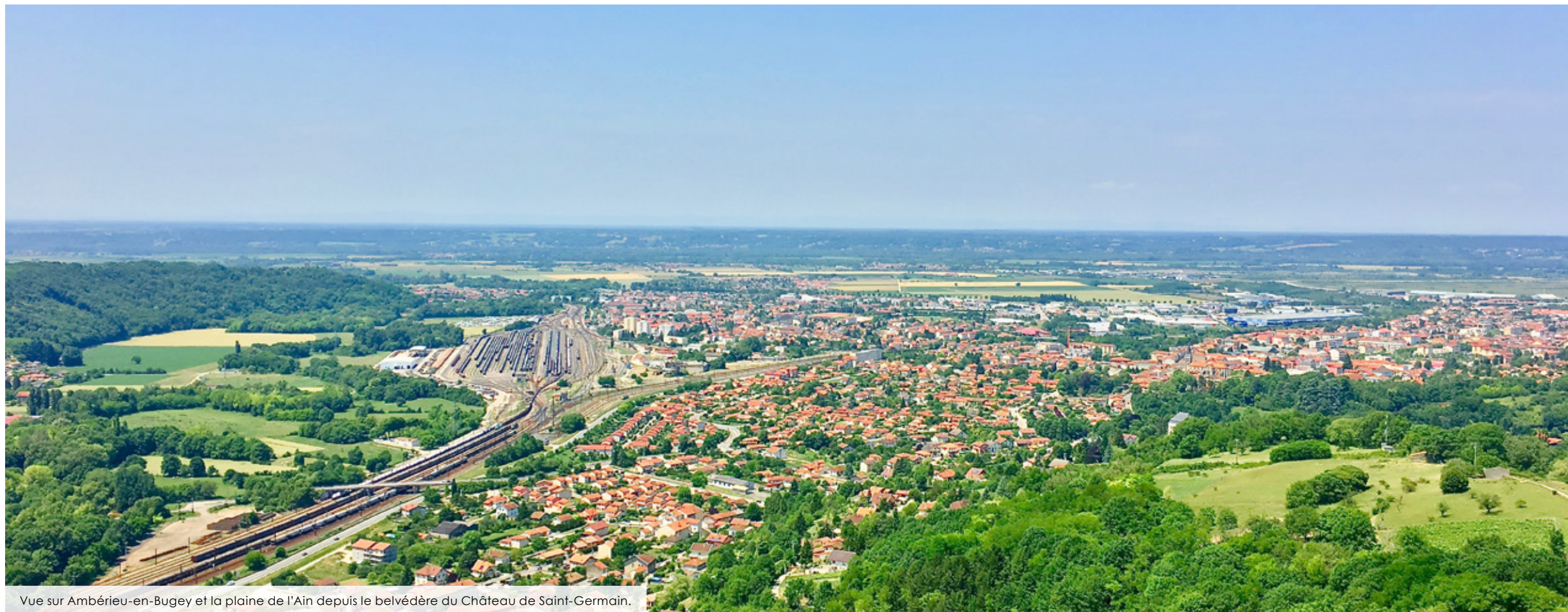
Vue sur Ambérieu-en-Bugey et la plaine de l'Ain depuis le belvédère du Château de Saint-Germain.