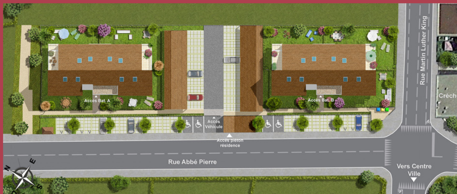
Plan masse de la réalisation

Vue sur la résidence et ses jardins privés.