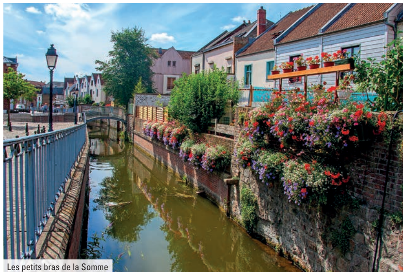
Les petits bras de la Somme