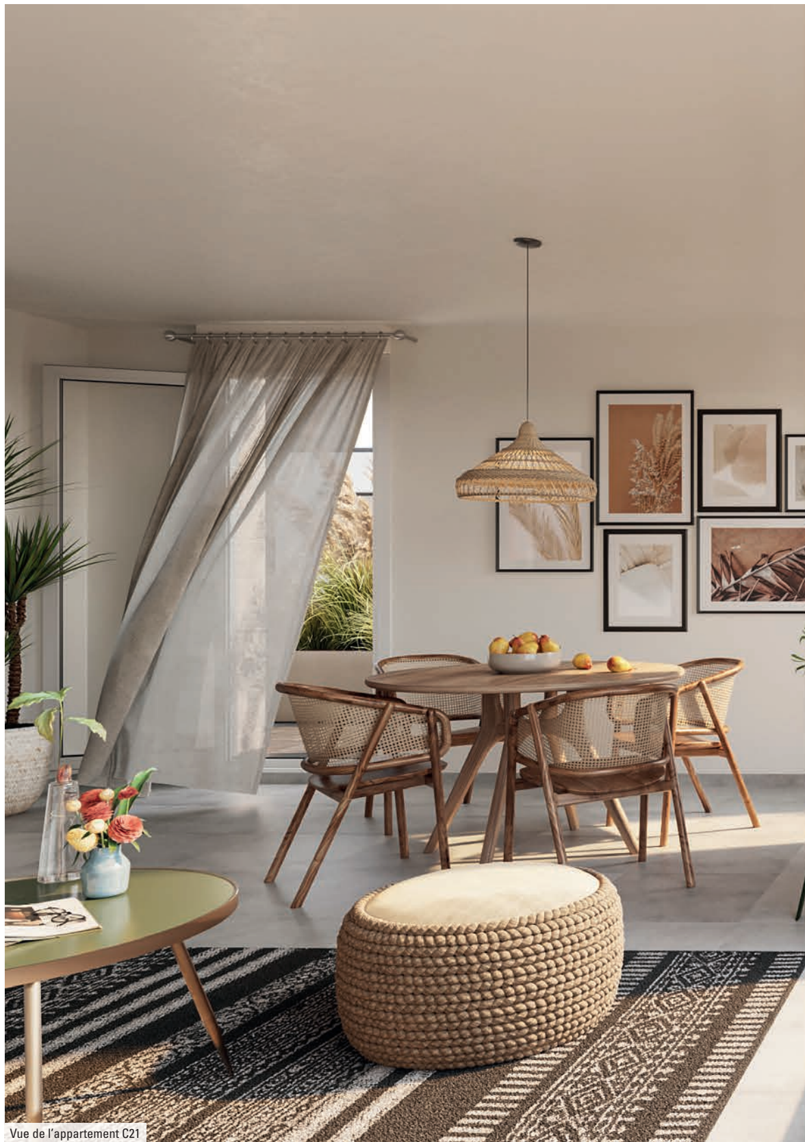
Vue de l'appartement C21