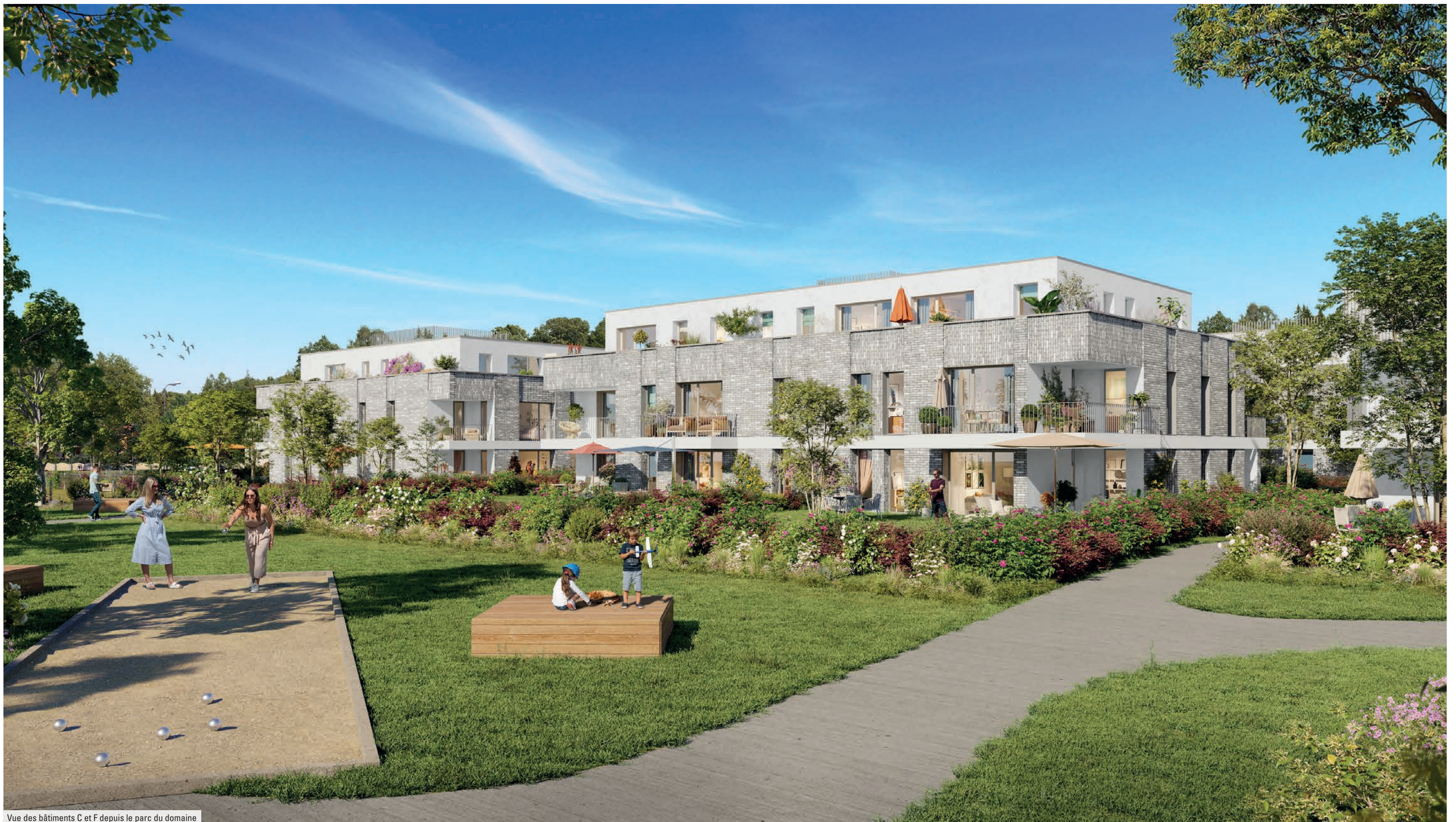
Vue des bâtiments C et F depuis le parc du domaine

Un lieu de vie chaleureux, mêlant esprit campagne et architecture moderne.