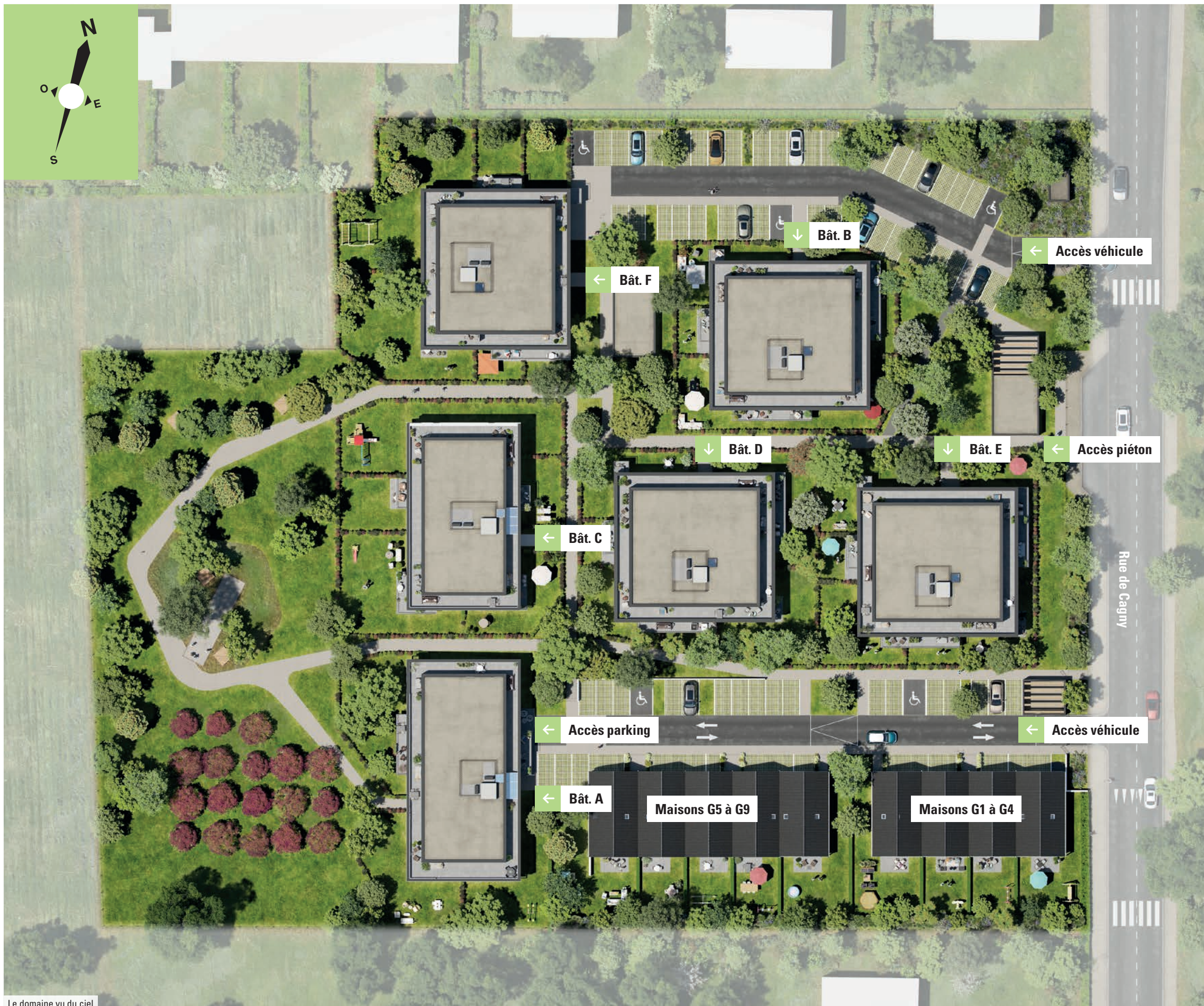
Le domaine vu du ciel

Un domaine agréable et respectueux de l'environnement.