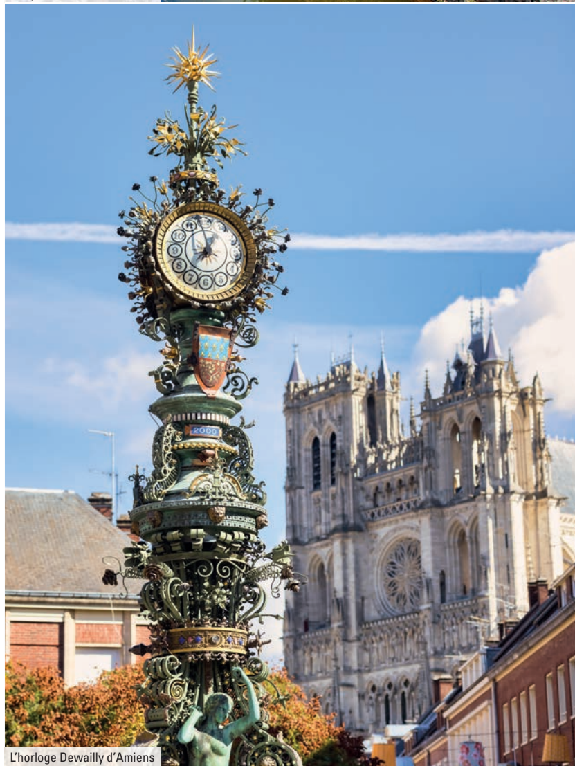
L'horloge Dewailly d'Amiens