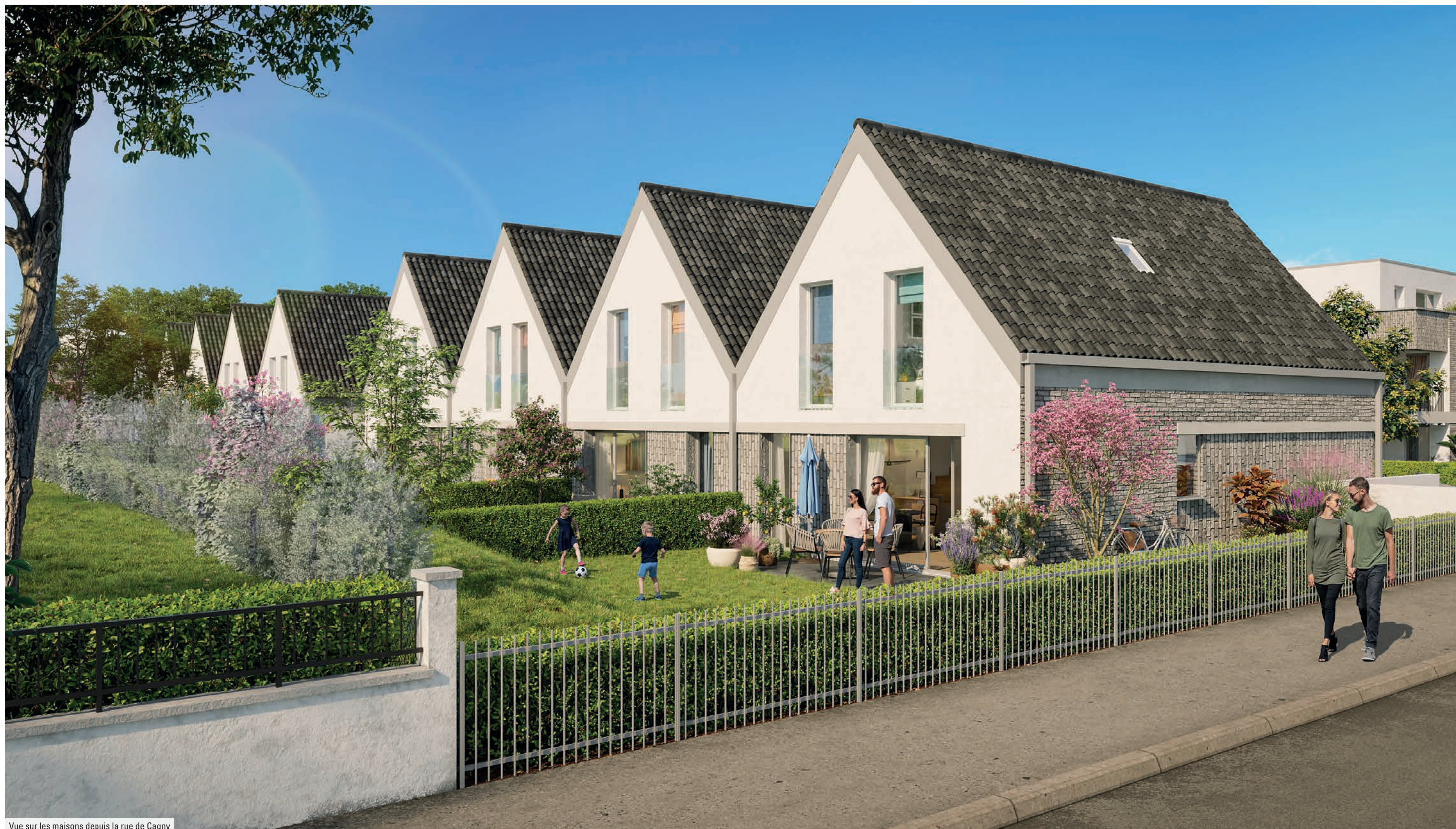
Vue sur les maisons depuis la rue de Cagny

En maison, votre art de vivre entre espace et nature.