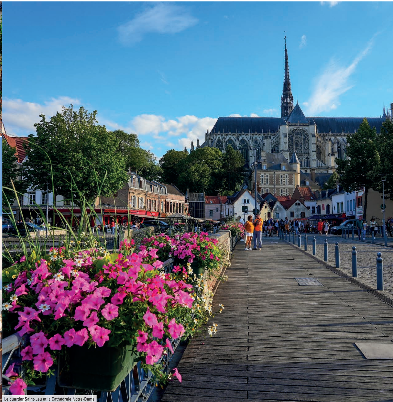
Le quartier Saint-Leu et la Cathédrale Notre-Dame