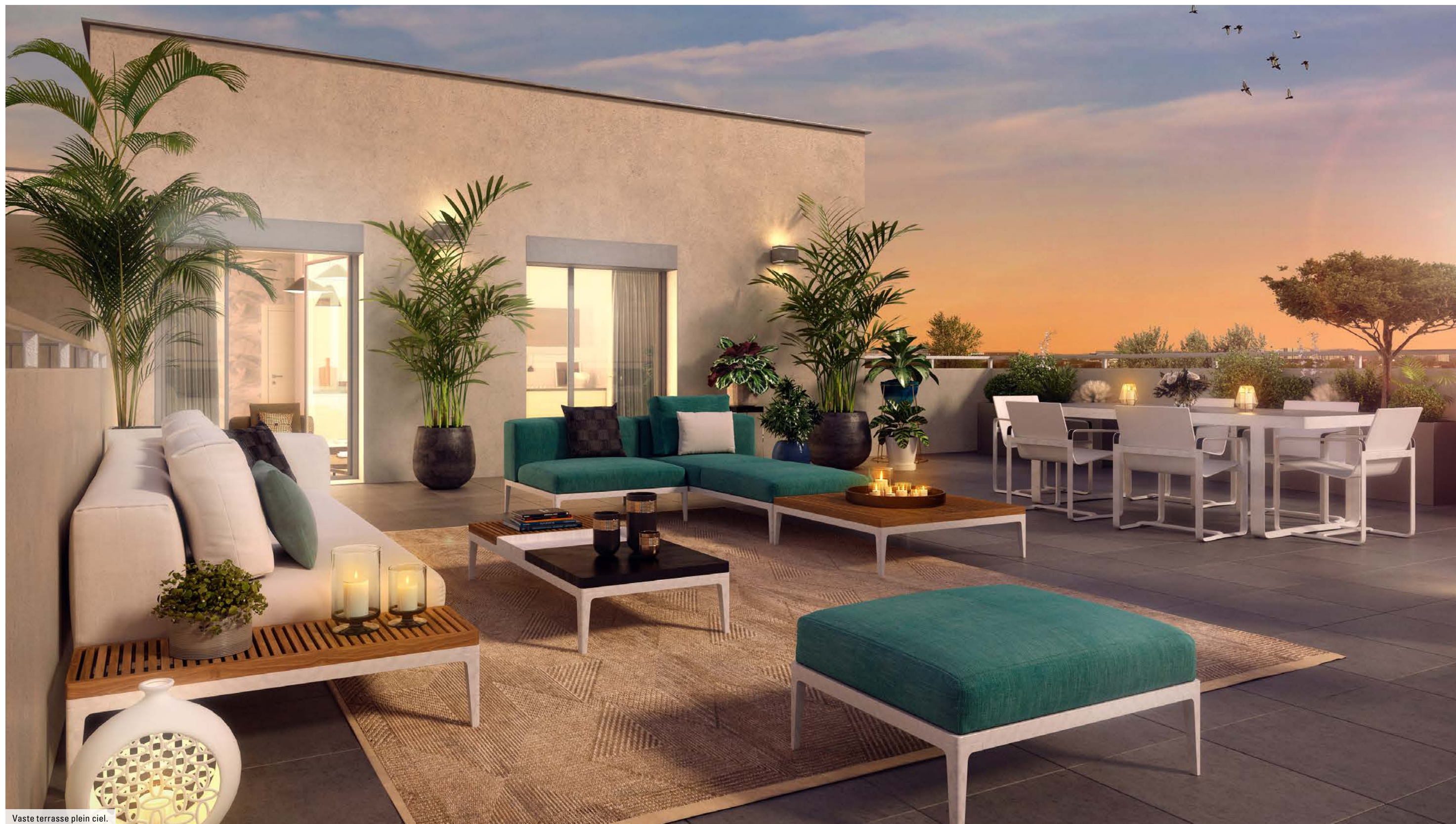
Vaste terrasse plein ciel.