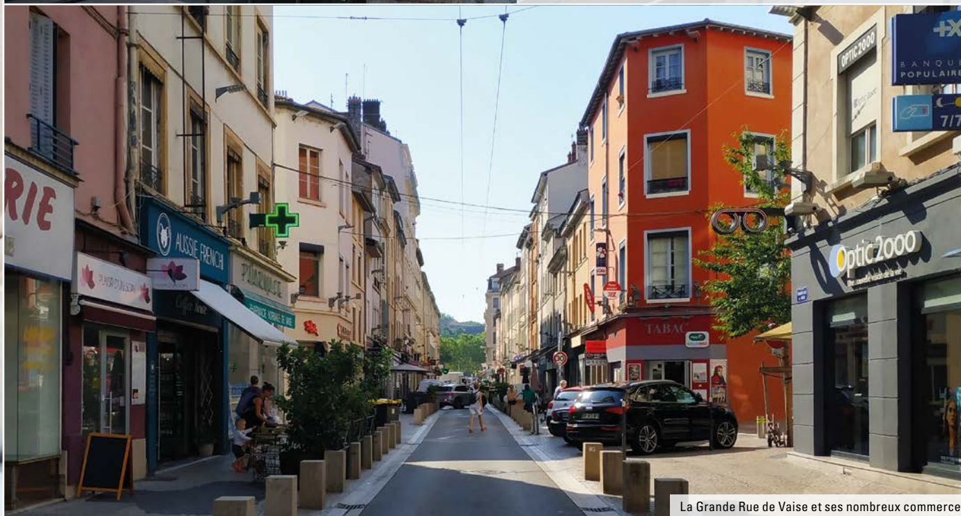
La Grande Rue de Vaise et ses nombreux commerces.

Un cadre de vie calme et préservé à moins de 10 minutes de la Presqu'île