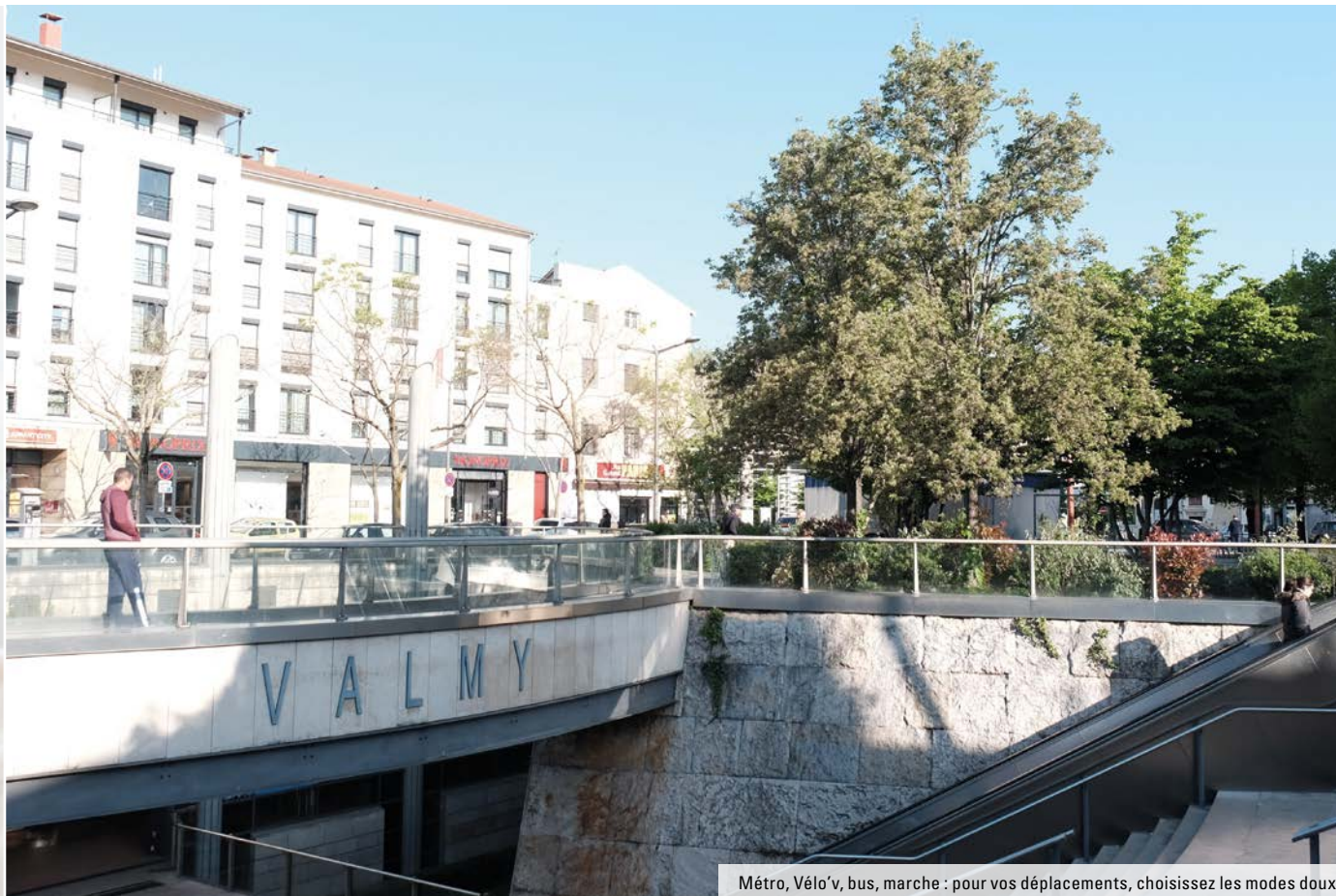
Méto, Vélo'v, bus, marche : pour vos déplacements, choisissez les modes doux !