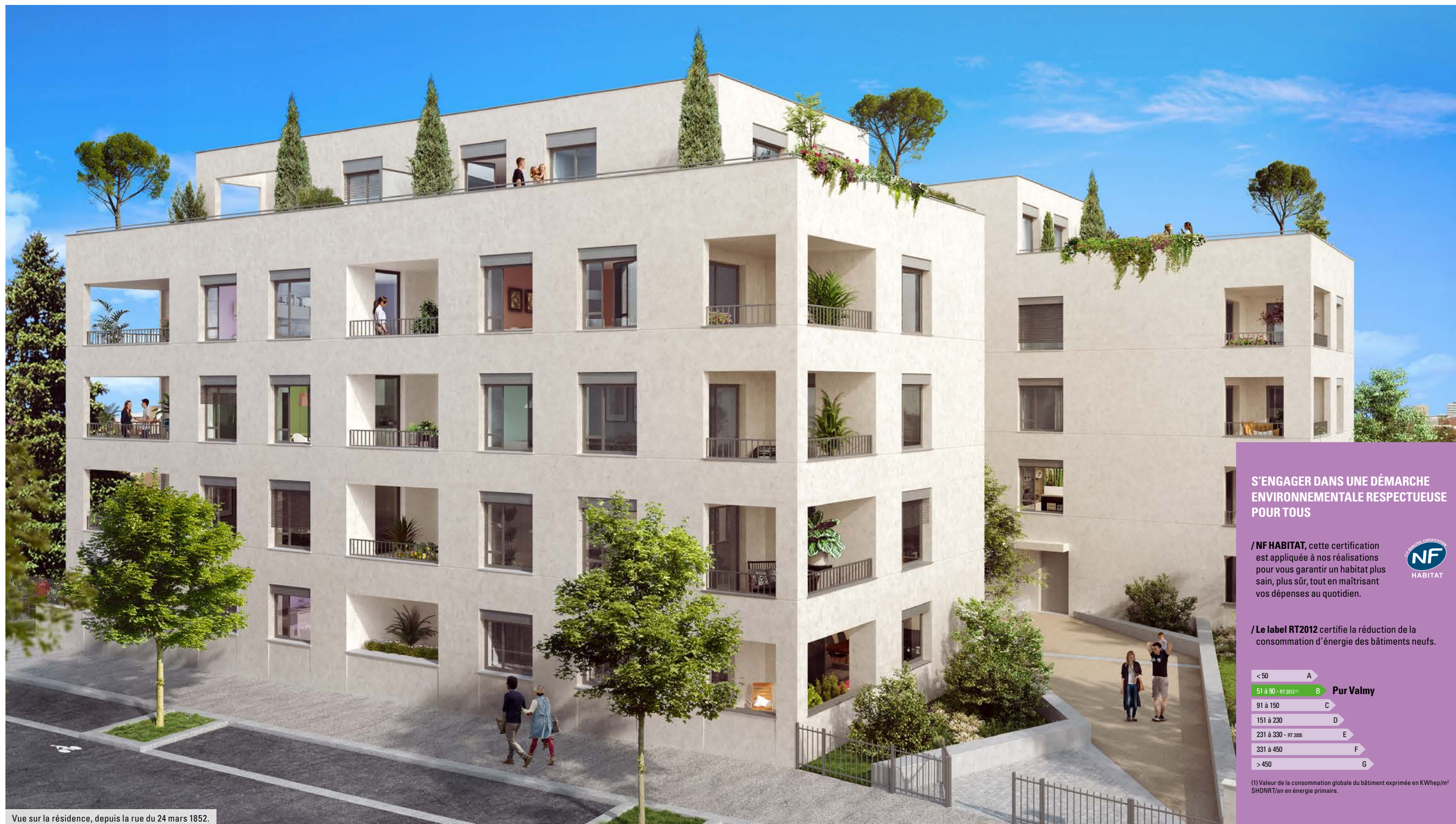
Vue sur la résidence, depuis la rue du 24 mars 1852.