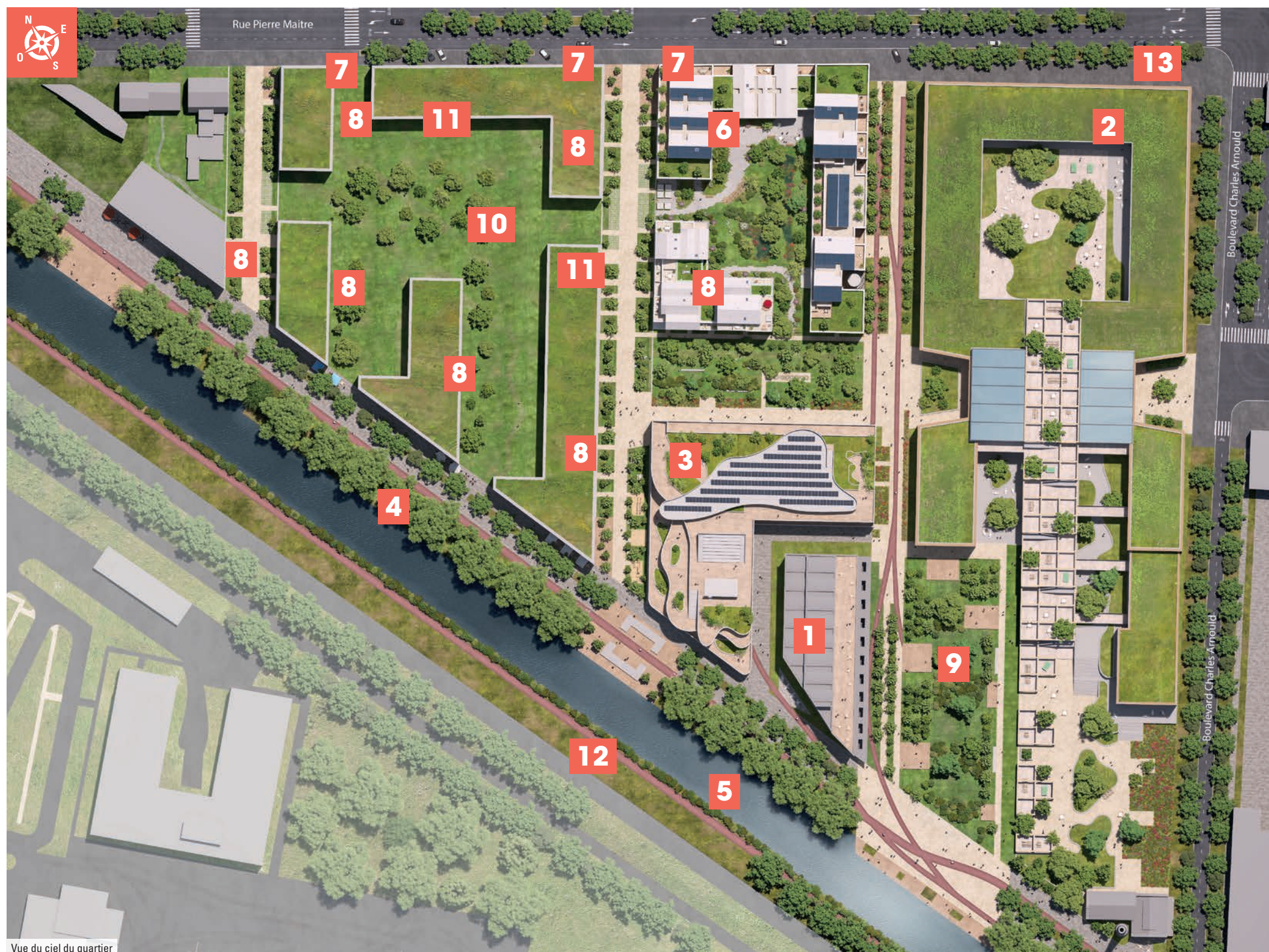
Vue du ciel du quartier