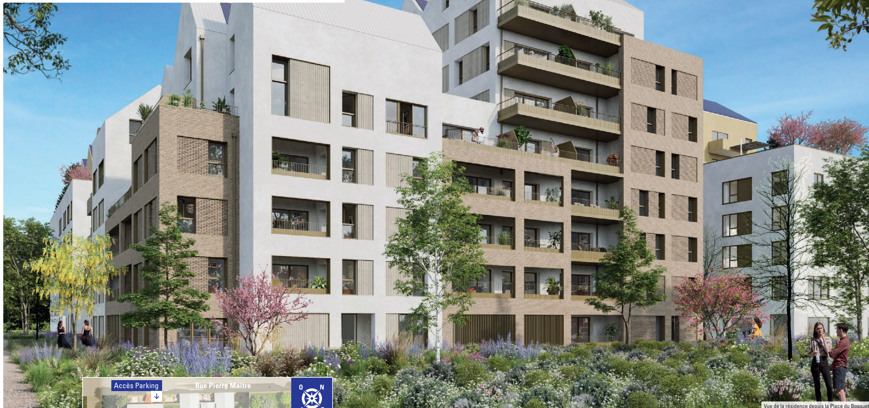
Vue de la résidence depuis la Place du Bosquet

UNE ARCHITECTURE CONTEMPORAINE SUBLIMÉE PAR DES MATÉRIAUX DE QUALITÉ.