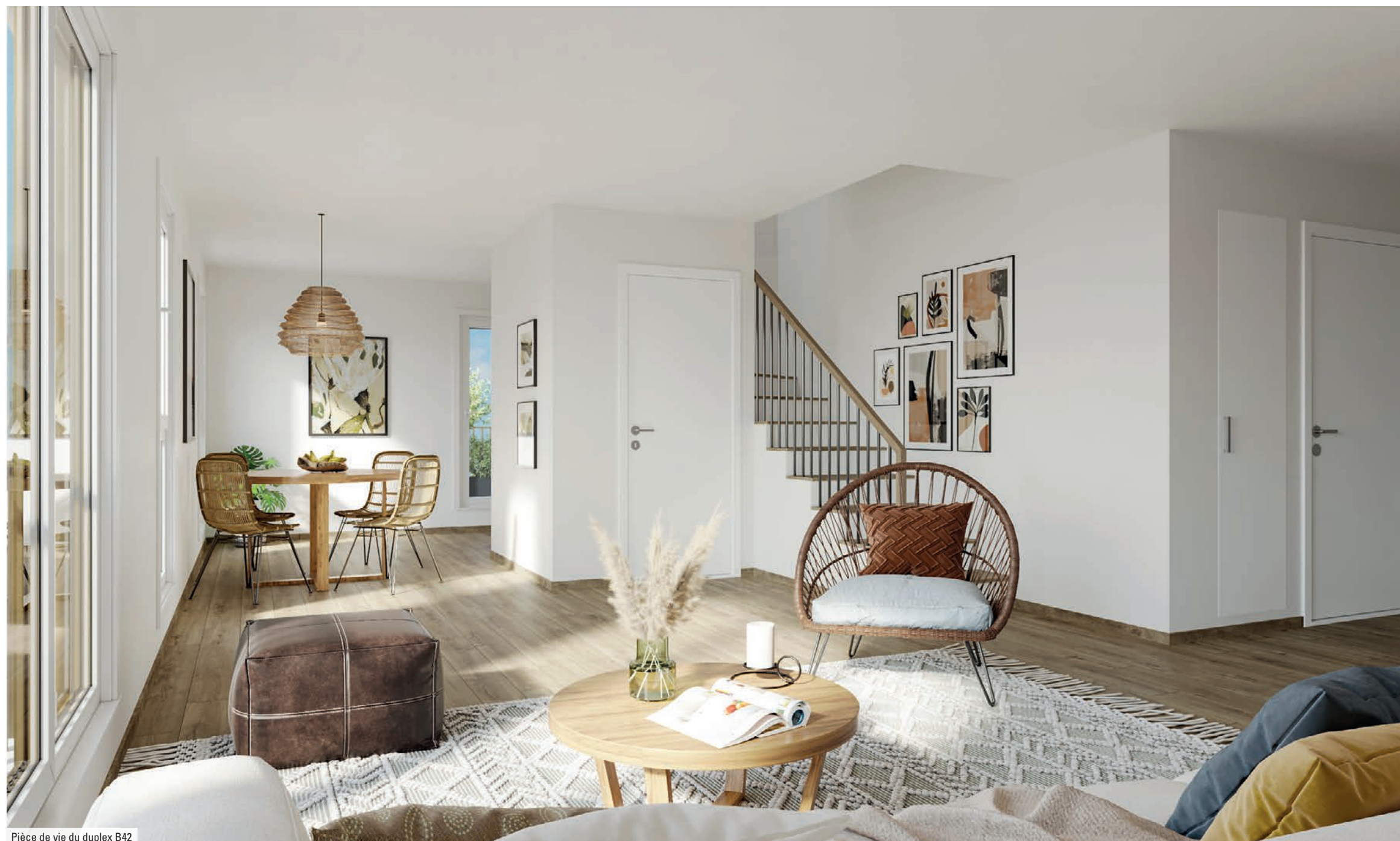
Pièce de vie du duplex B42