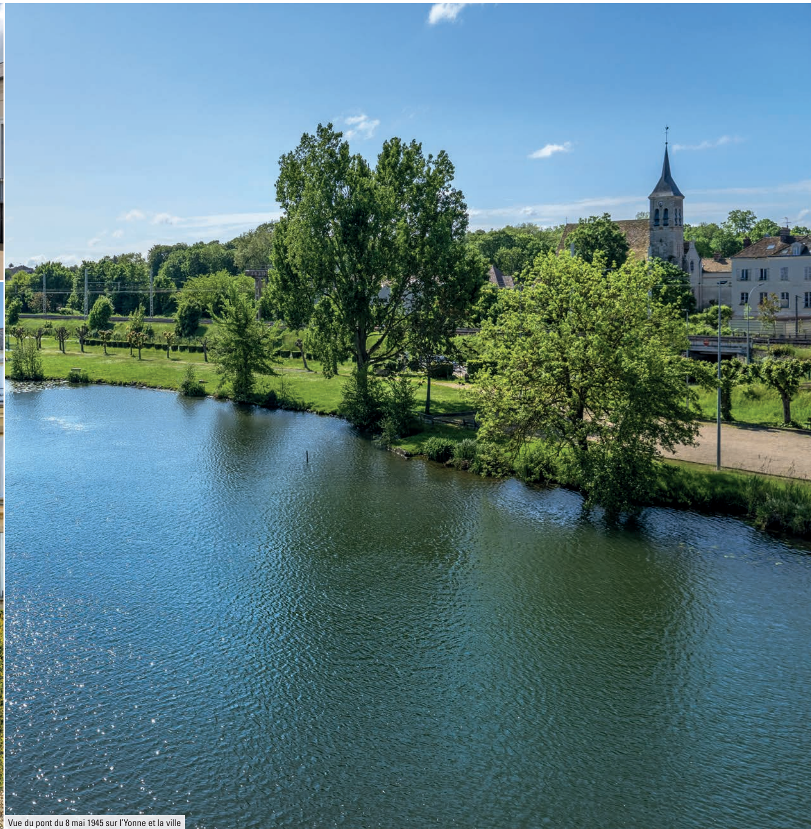
Vue du pont du 8 mai 1945 sur l'Yonne et la ville