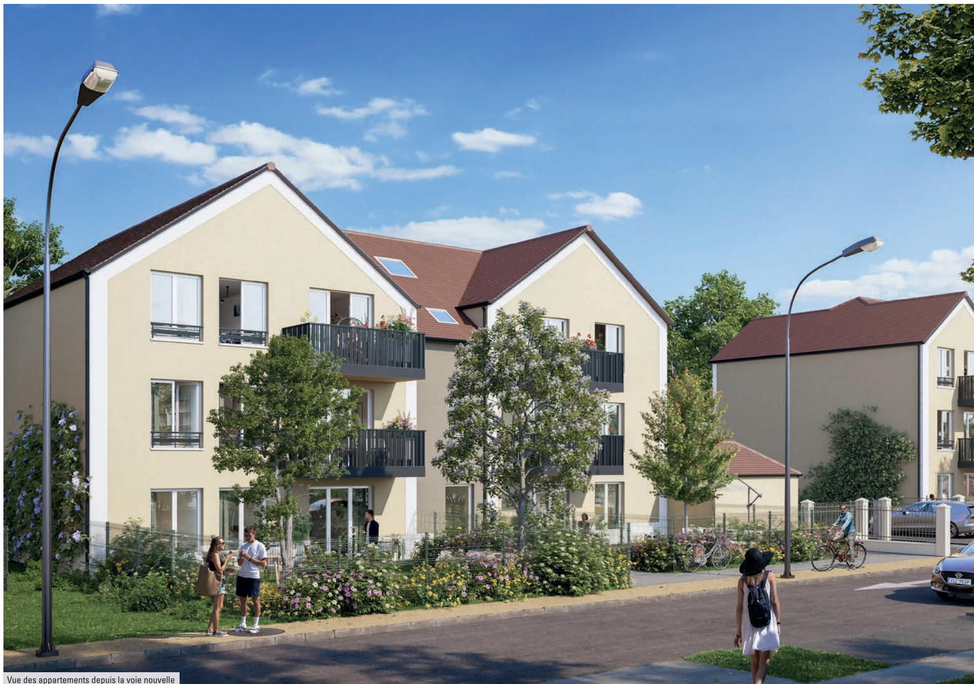
Vue des appartements depuis la voie nouvelle