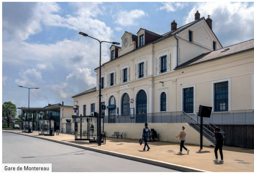
Gare de Montereau