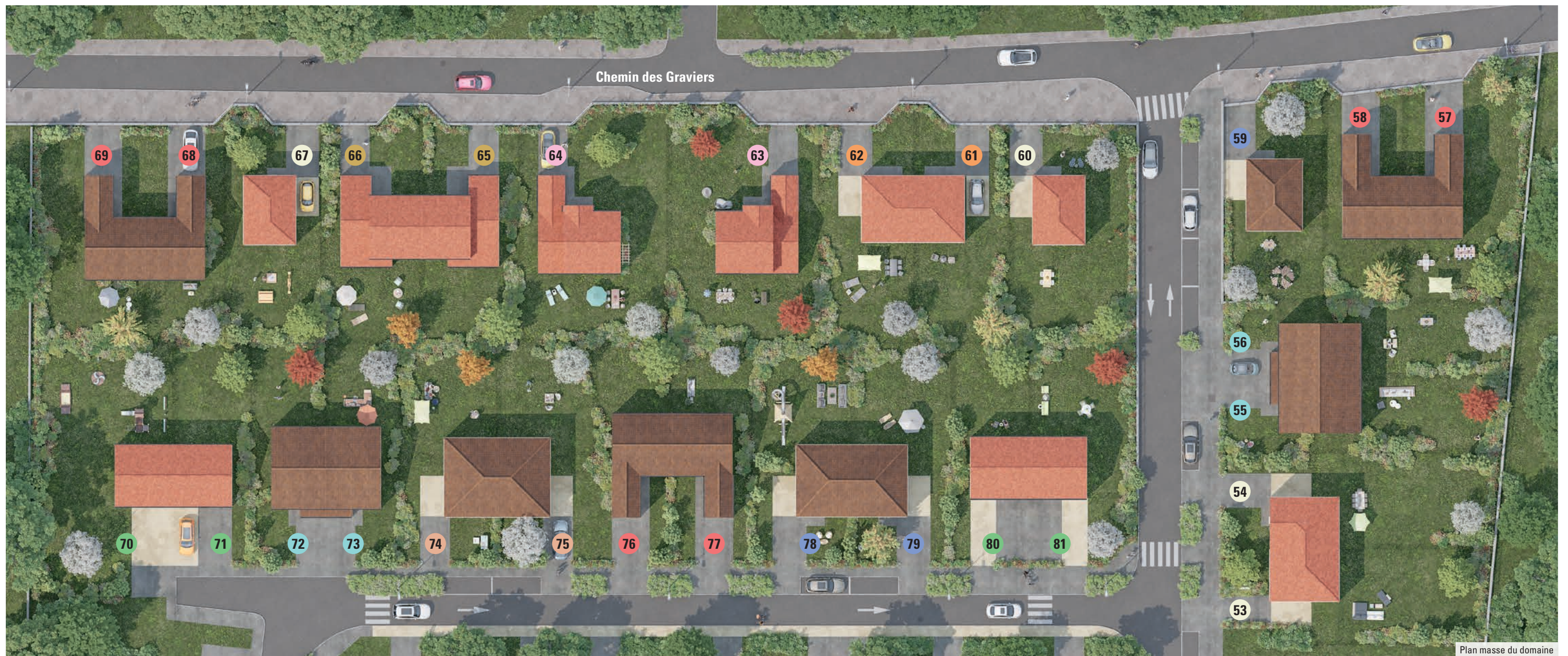
Plan masse du domaine