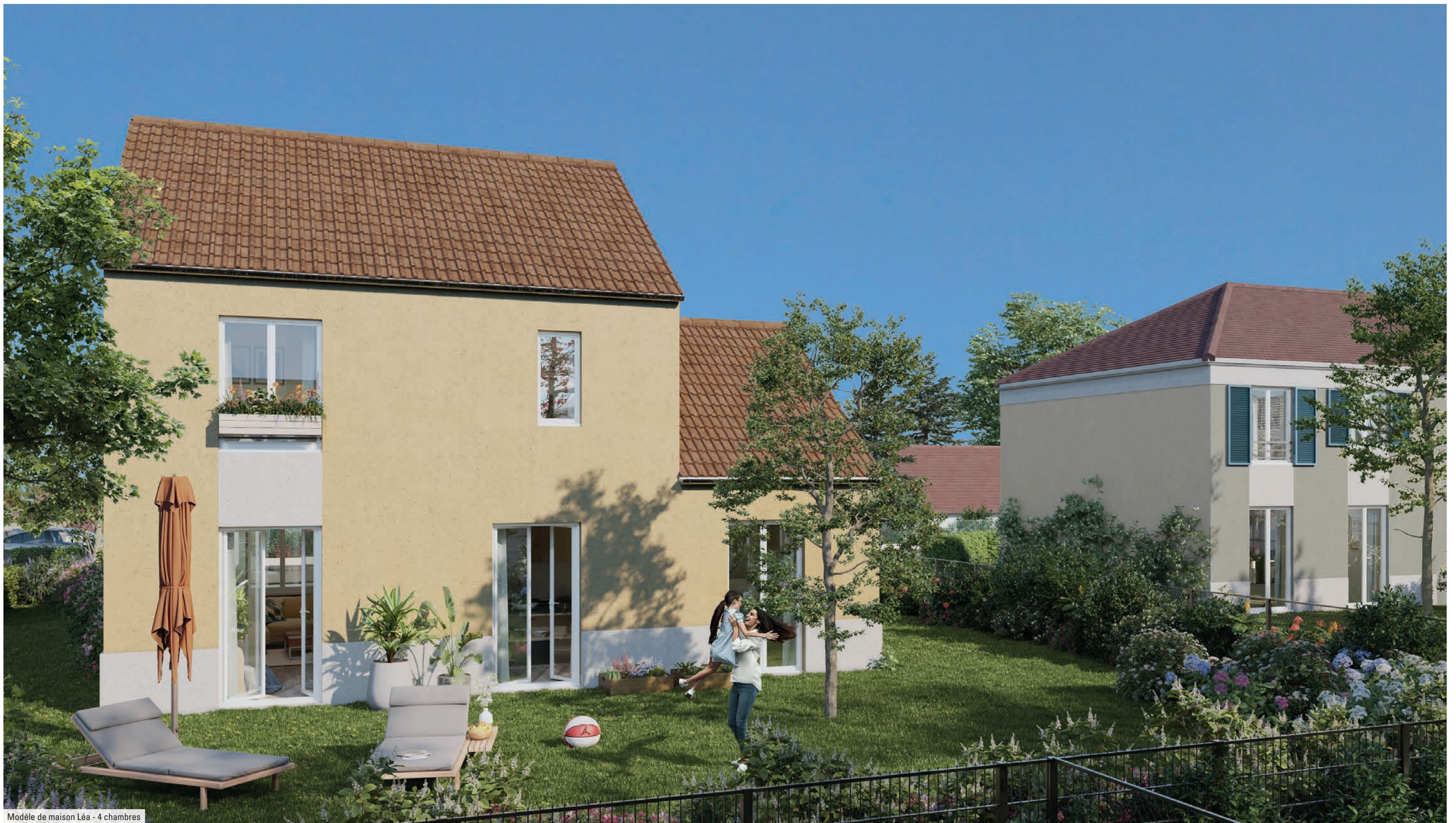
Modèle de maison Léa - 4 chambres

Choisissez la maison qui vous ressemble pour vivre le confort au quotidien.