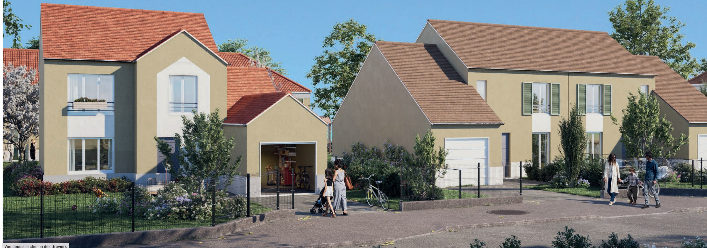
Vue depuis le chemin des Graviers

L'incomparable qualité de vie offerte par une maison neuve Kaufman & Broad