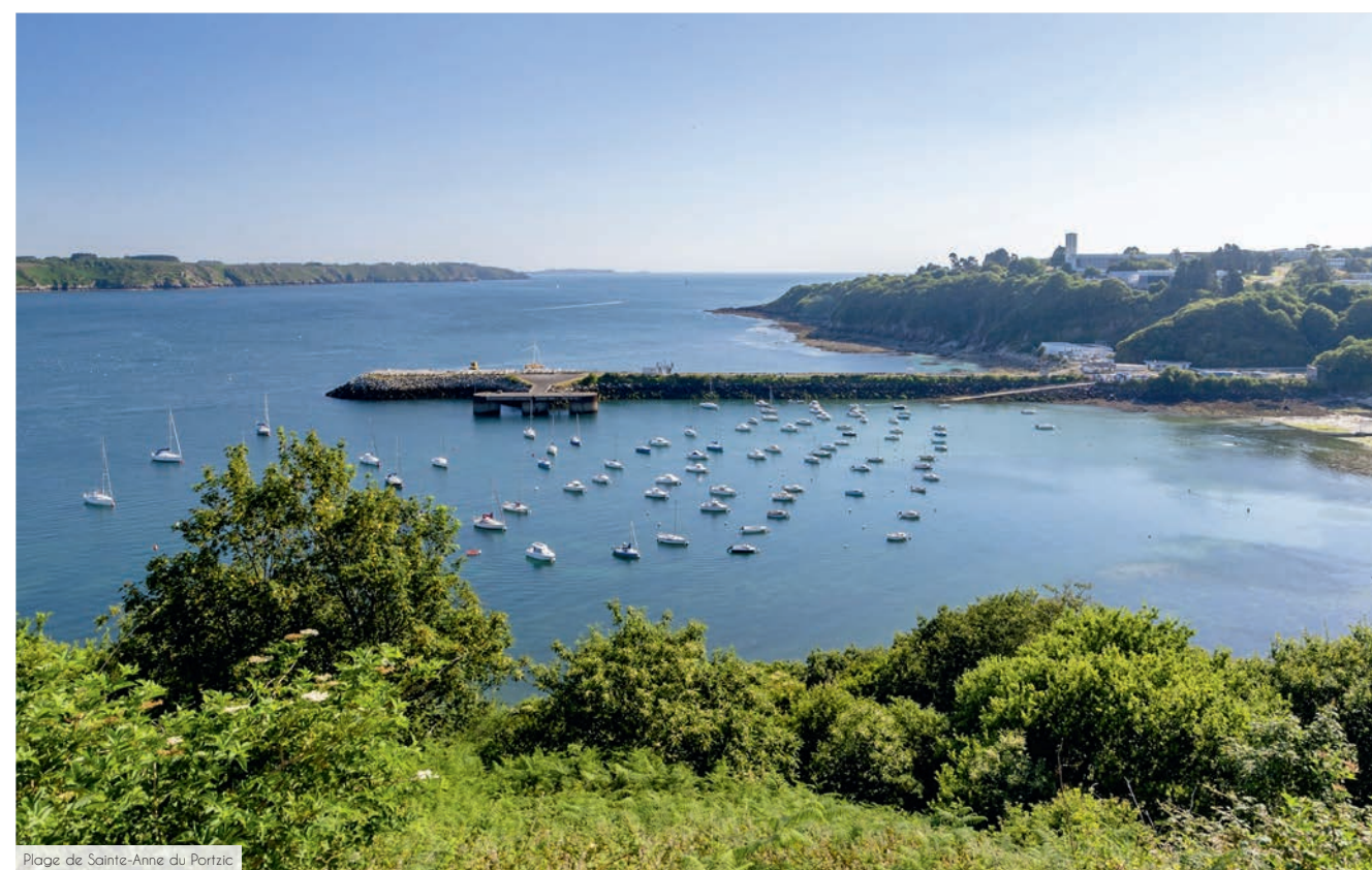
Plage de Sainte-Anne du Portzic