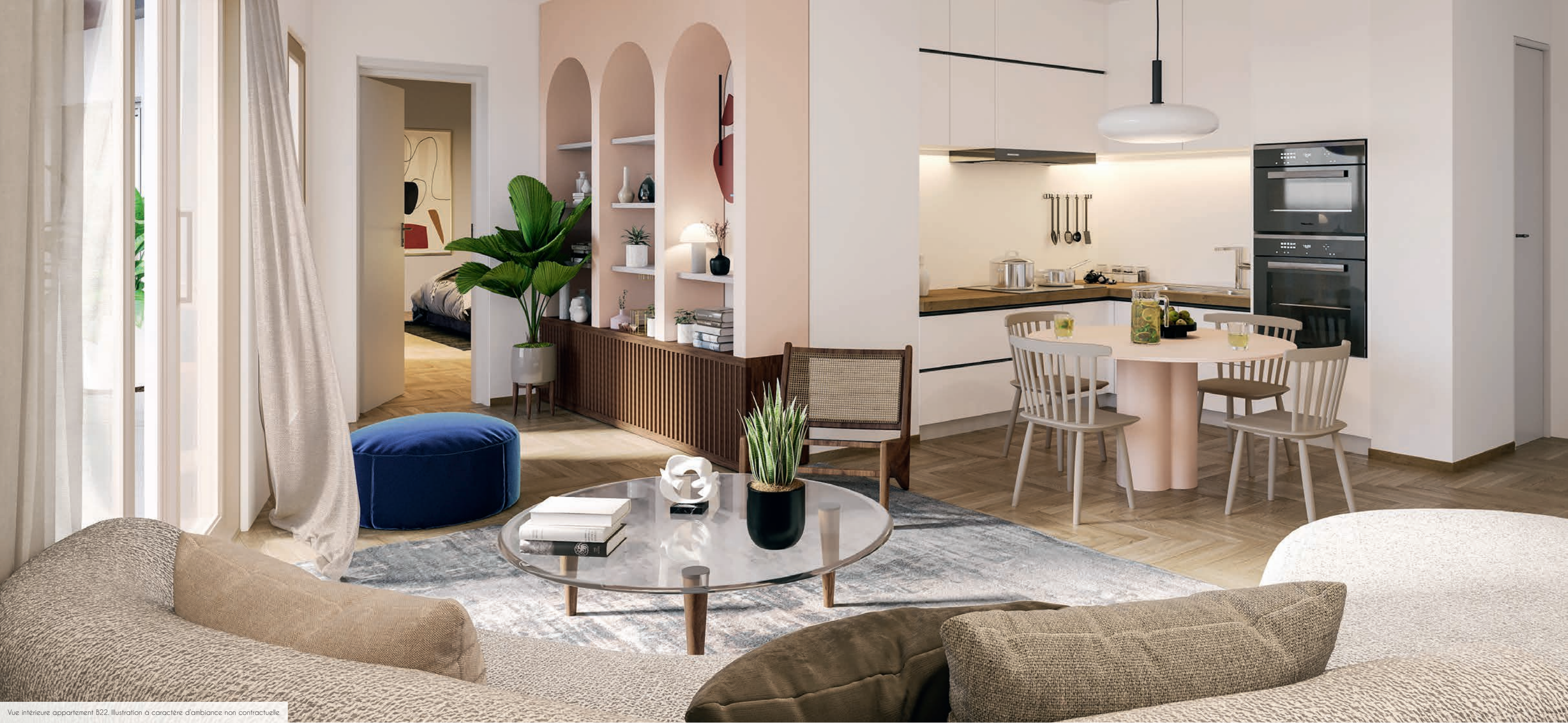
Vue intérieure appartement 822. Illustration à caractère d'ambiance non contractuelle