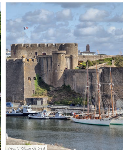
Vieux Château de Brest