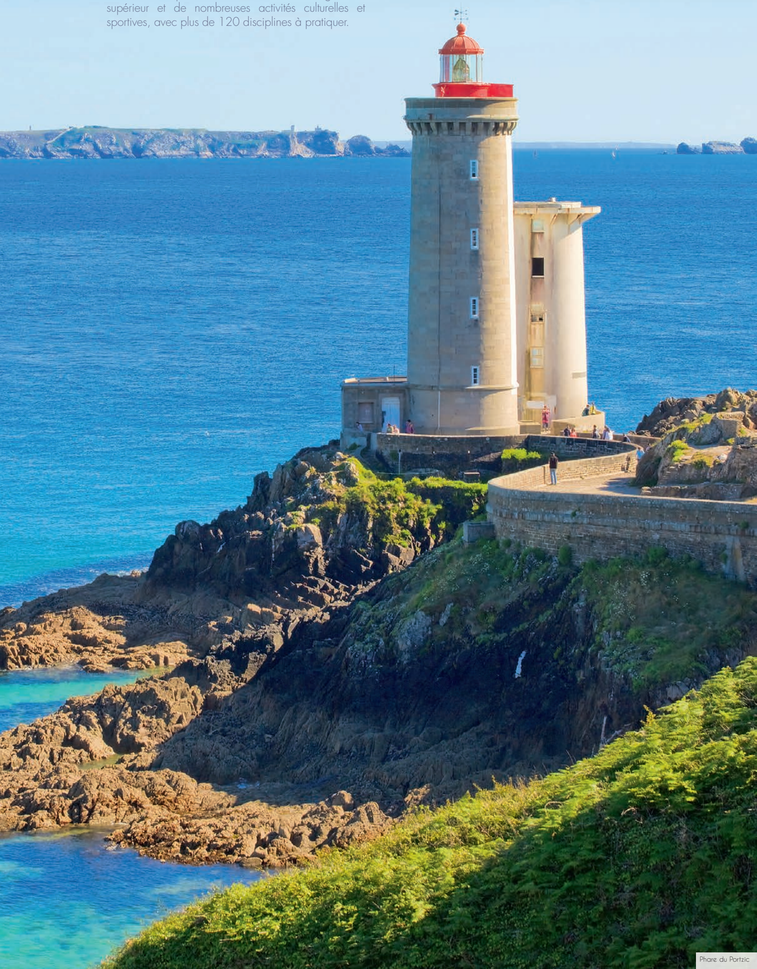
Phare du Portzic

Résolument attractive, elle abrite diverses entreprises et le technopôle Brest-Iroise, acteur majeur de l'innovation dans la région. La ville est également facile d'accès, et se situe à 2h30* de Rennes, 3h15 de Nantes et 3h30* de Paris en TGV, permettant ainsi de rester connecté aux grandes métropoles environnantes.