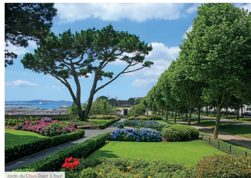
Jardin du Cours Dajot à Brest