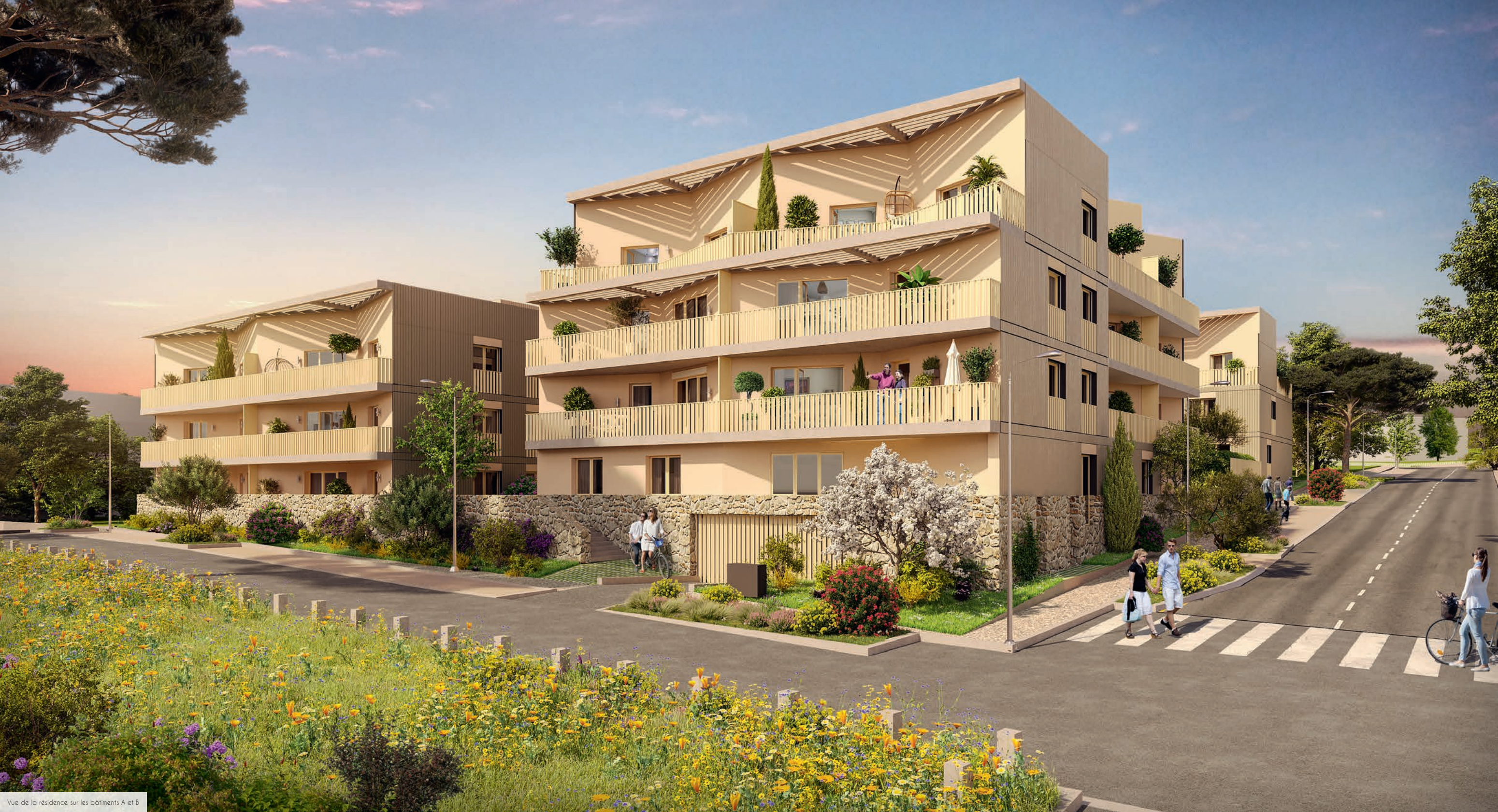
Vue de la résidence sur les bâtiments A et B