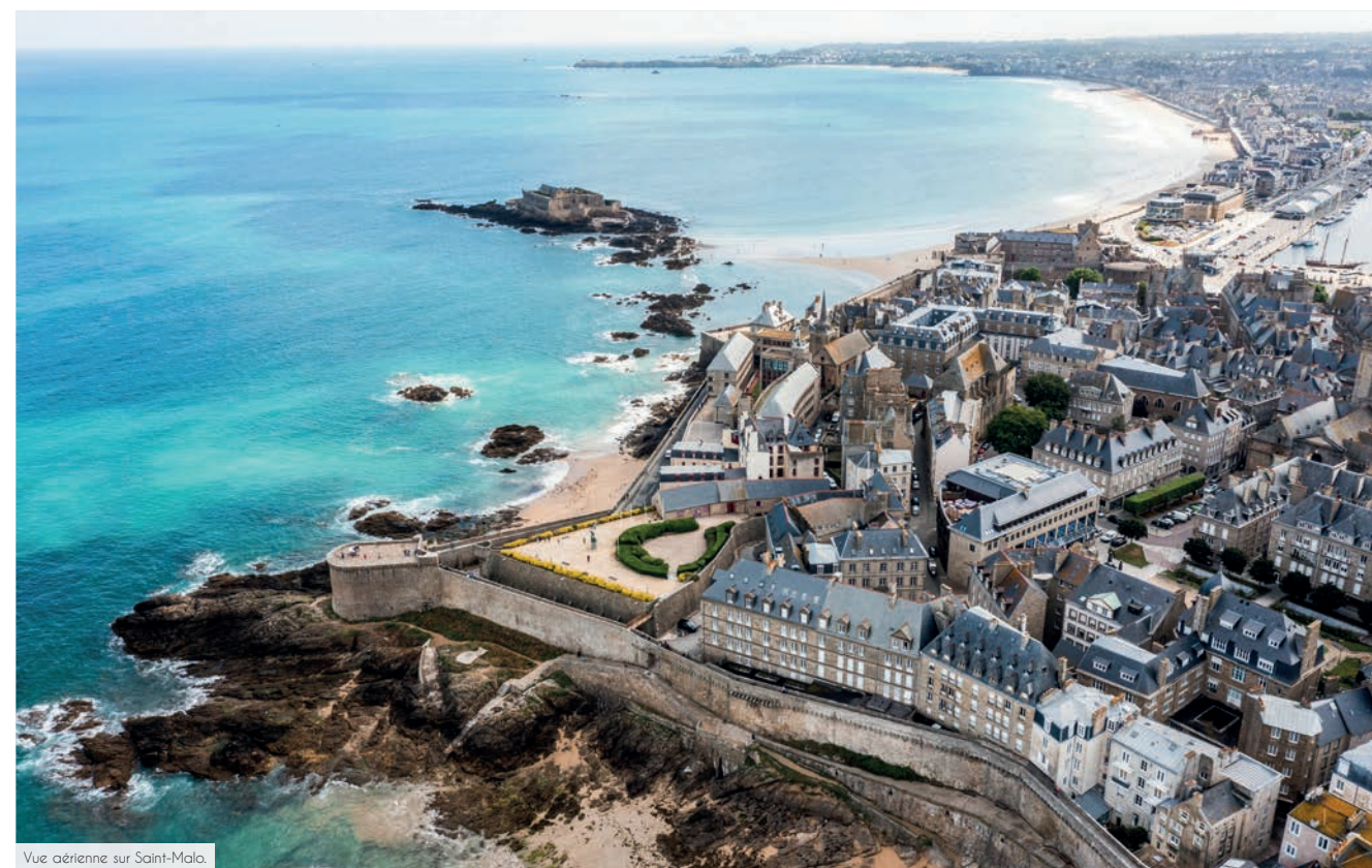
Vue aérienne sur Saint-Malo.