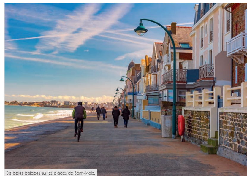
De belles balades sur les plages de Saint-Malo.