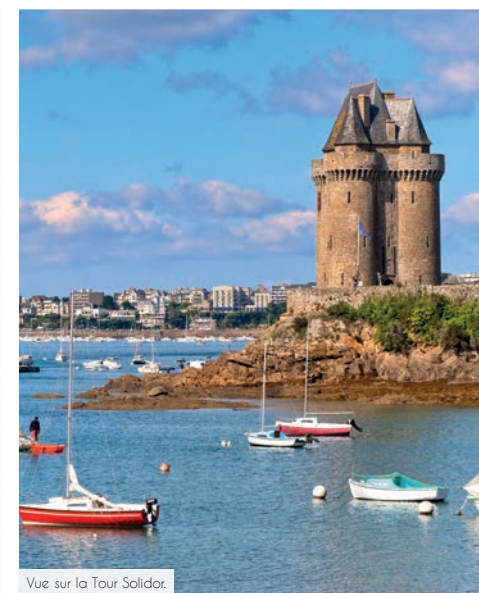
Vue sur la Tour Solidor.