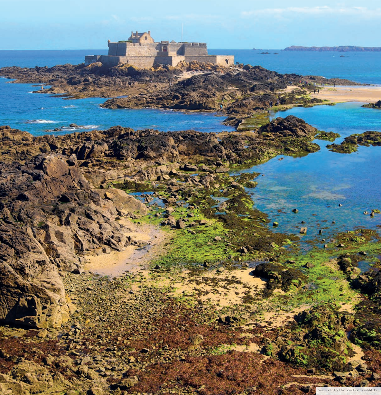
Vue sur le Fort National de Saint-Malo.

Afin d'encourager les mobilités douces et de permettre à tous de profiter de son bel environnement lors de balades à vélos, 55 km de pistes cyclables ont été installés dans la ville. Facilement accessible et connectée, elle bénéficie d'une situation stratégique et ne se situe qu'à 45 min* de Rennes en voiture, tandis que 2h15* de TGV suffisent pour accéder à Paris.