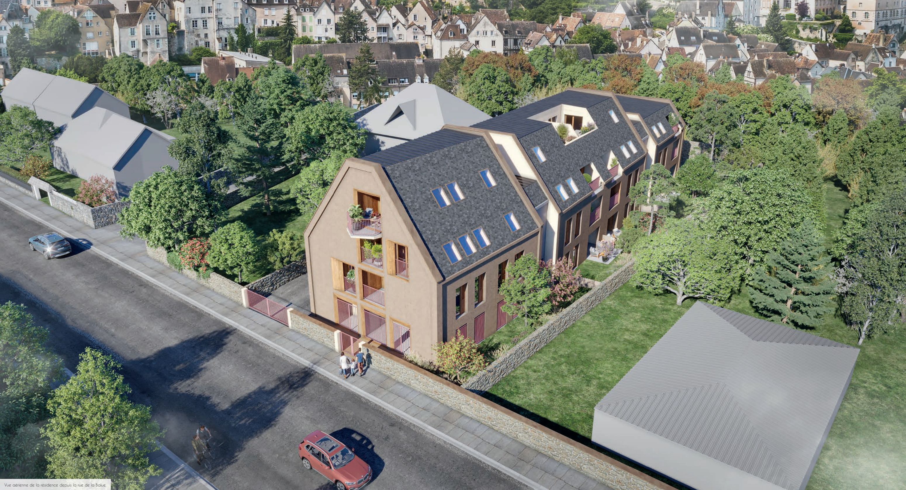
Vue aérienne de la résidence depuis la rue de la Baluze.