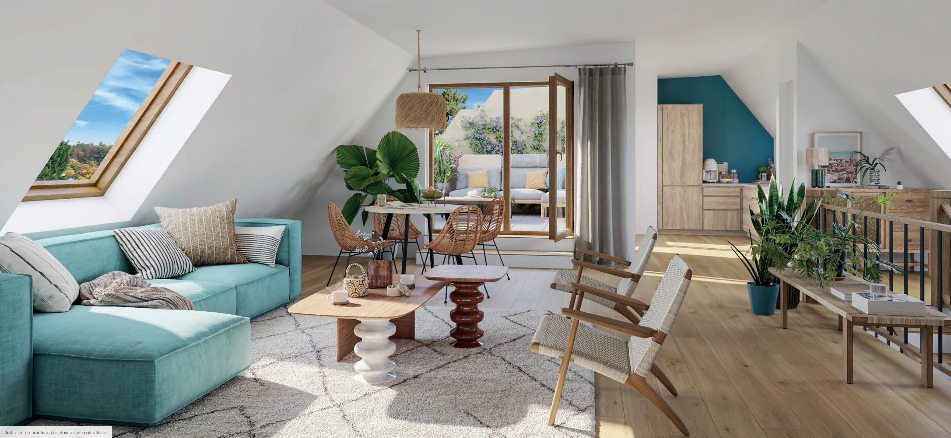
Illustration à caractère d'ambiance non contractuelle