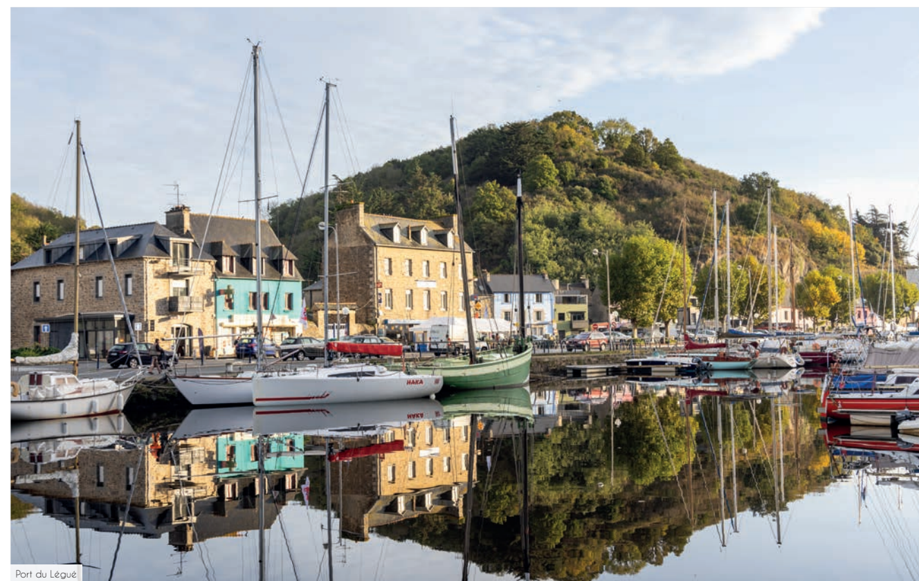
Port du Legué