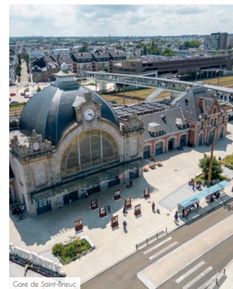
Gare de Saint-Brieuc