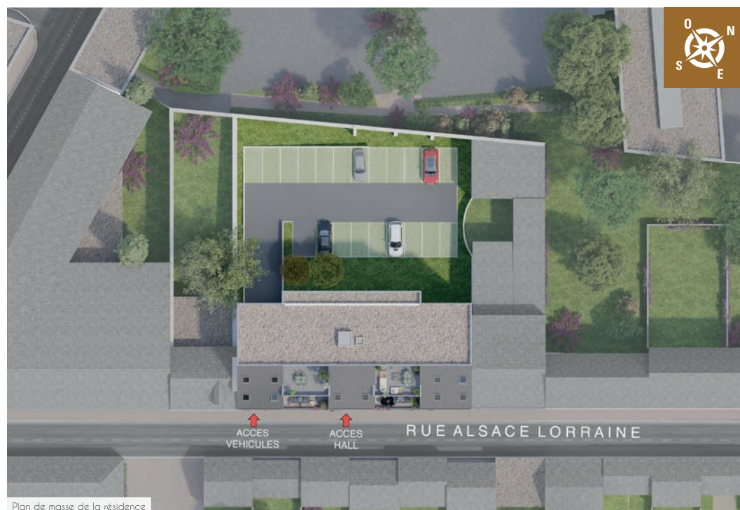
Plan de masse de la résidence