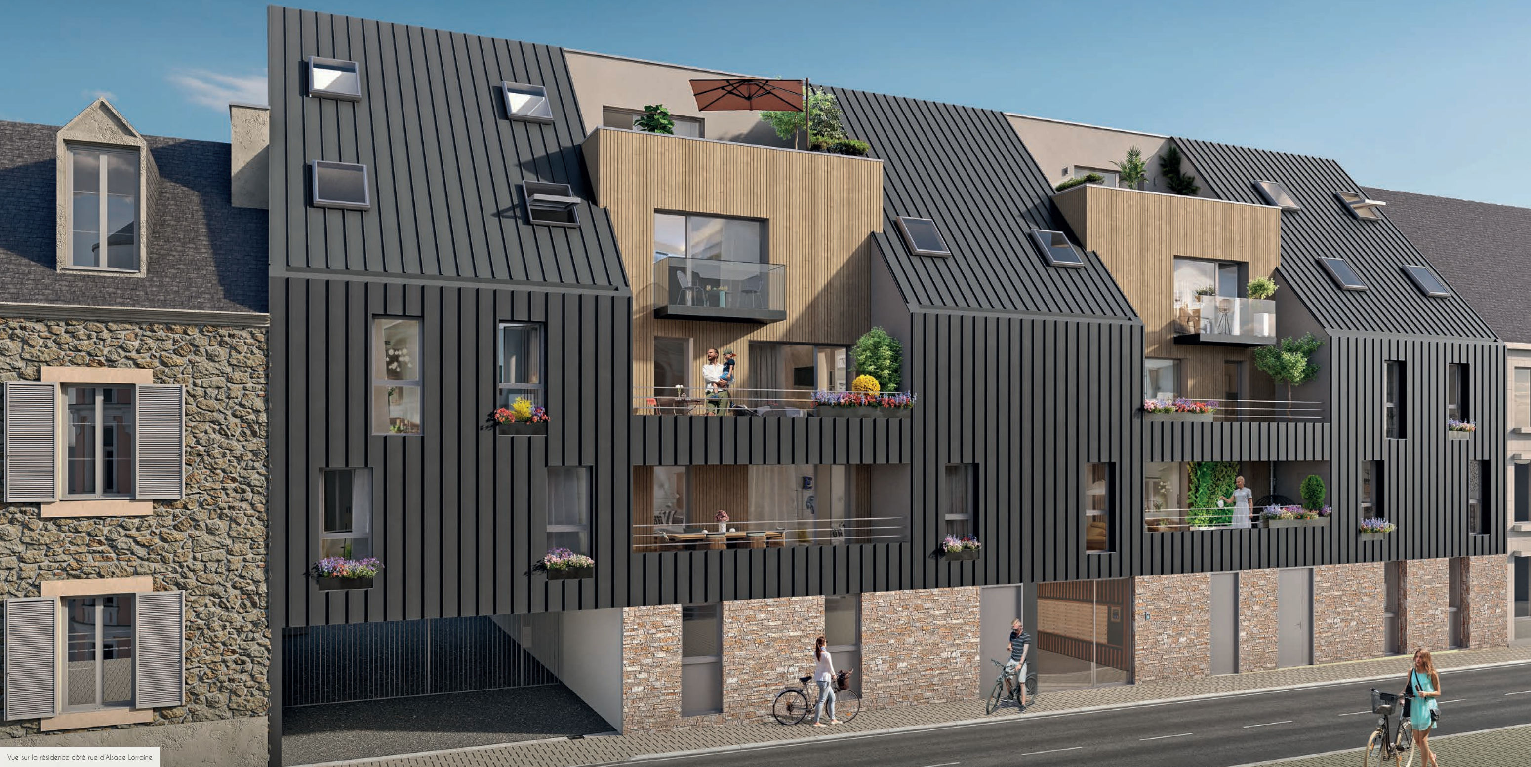
Vue sur la résidence côté rue d'Alsace Lorraine