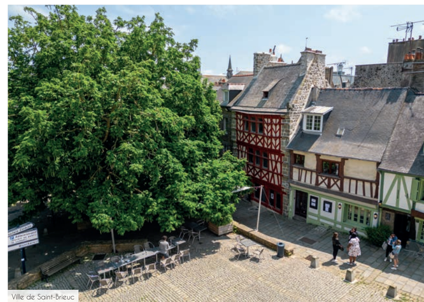
Ville de Saint-Brieuc