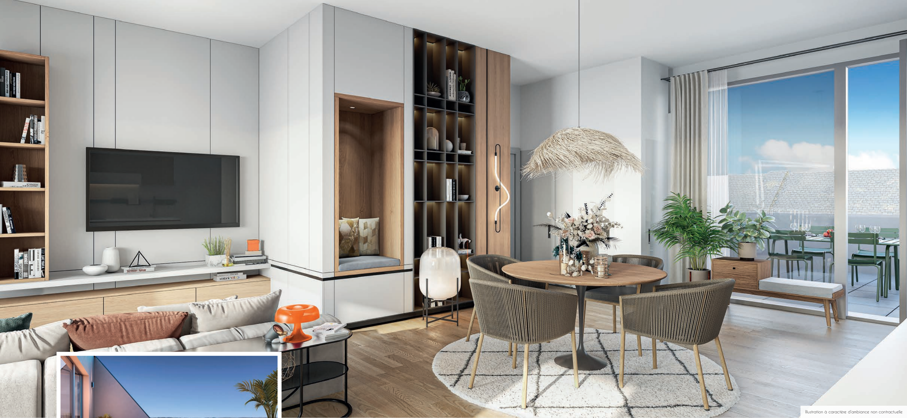
Illustration à caractère d'ambiance non contractuelle