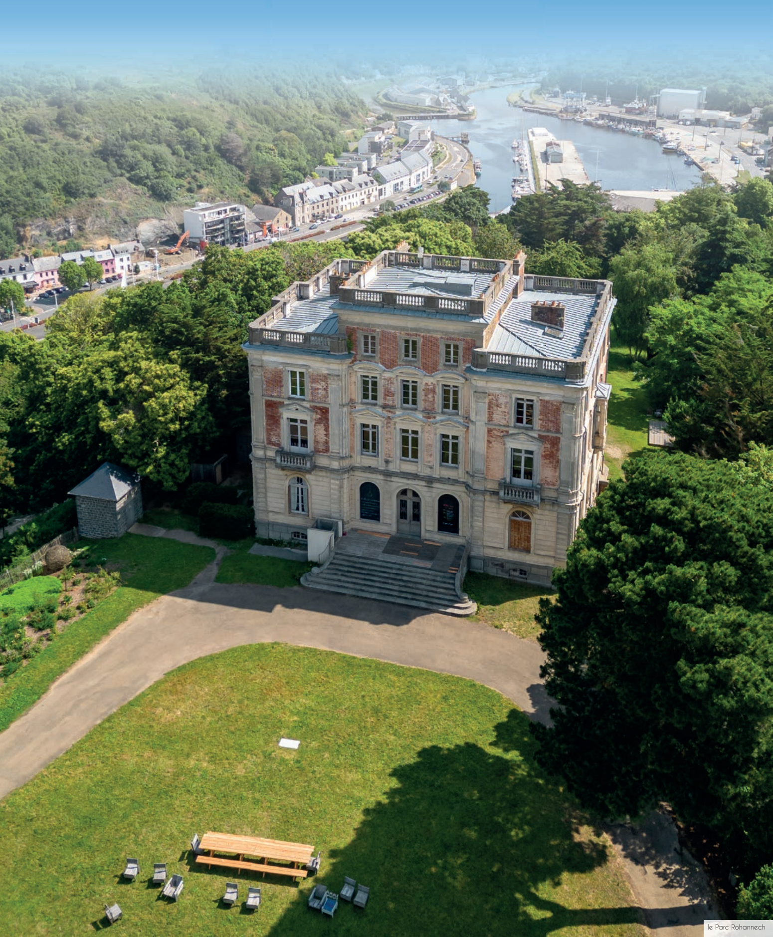
le Parc Rohannech

Saint-Brieuc s'étend vers la mer, invitant à profiter des reflets de l'océan. Le cœur de la ville bat au rythme d'un centre animé, offrant de nombreuses expériences culturelles, gastronomiques et commerçantes. Son réseau éducatif réunit dans un rayon de 3 kilomètres* les écoles de la maternelle au lycée. Avec des centres médicaux et un hôpital, la ville veille au bien-être et à la tranquillité de ses habitants, plaçant leur confort au premier plan. Saint-Brieuc propose un cadre de vie exceptionnel où l'histoire se marie à la modernité, où la mer rencontre la terre.