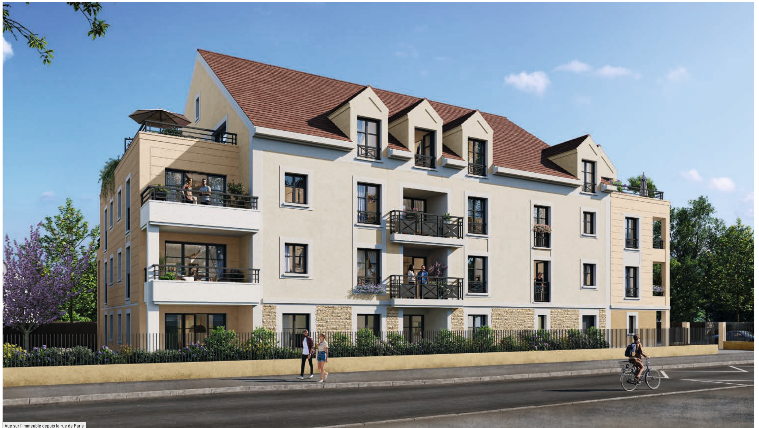
Vue sur l'immeuble depuis la rue de Paris