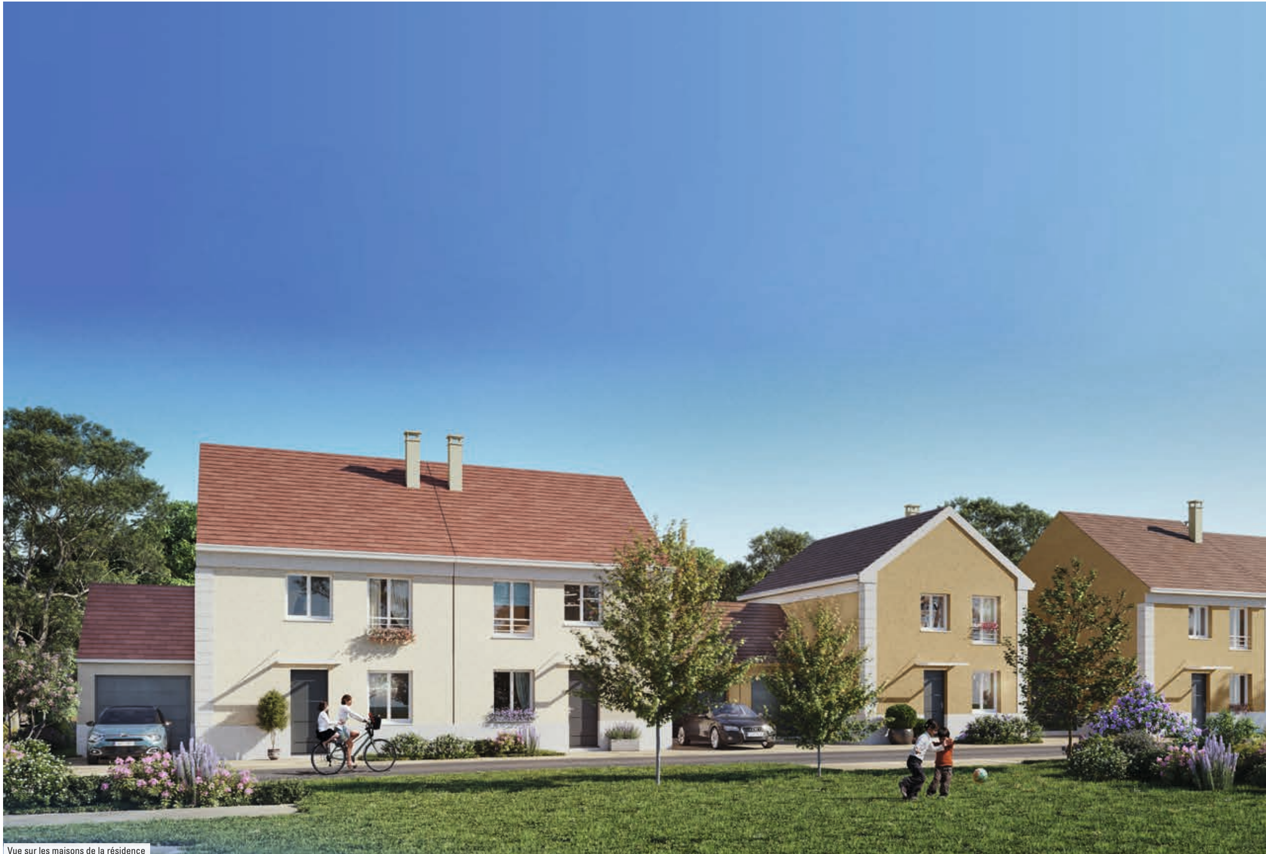
Vue sur les maisons de la résidence

Le confort d'une maison aux espaces inspirés par votre style de vie.