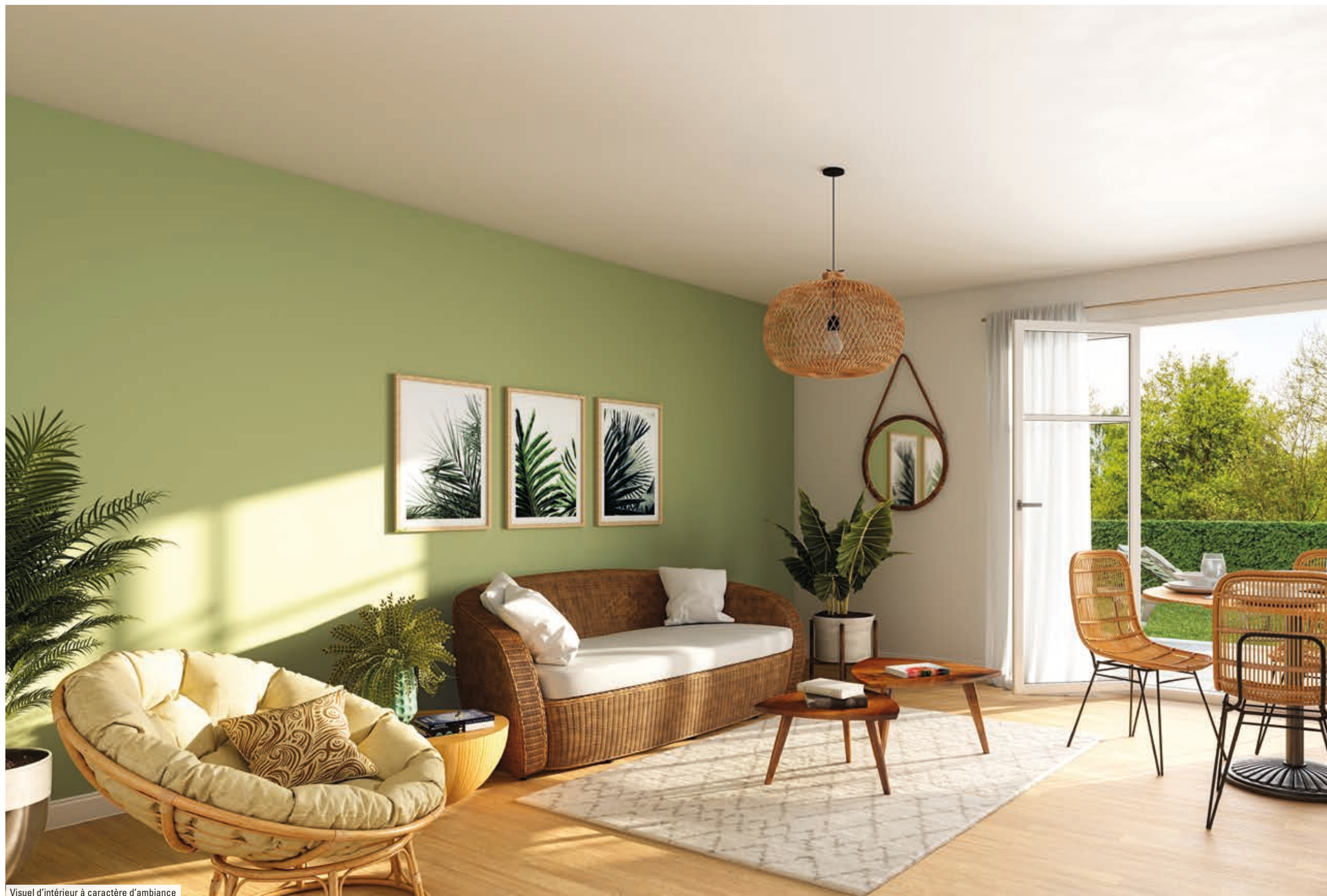
Visuel d'intérieur à caractère d'ambiance