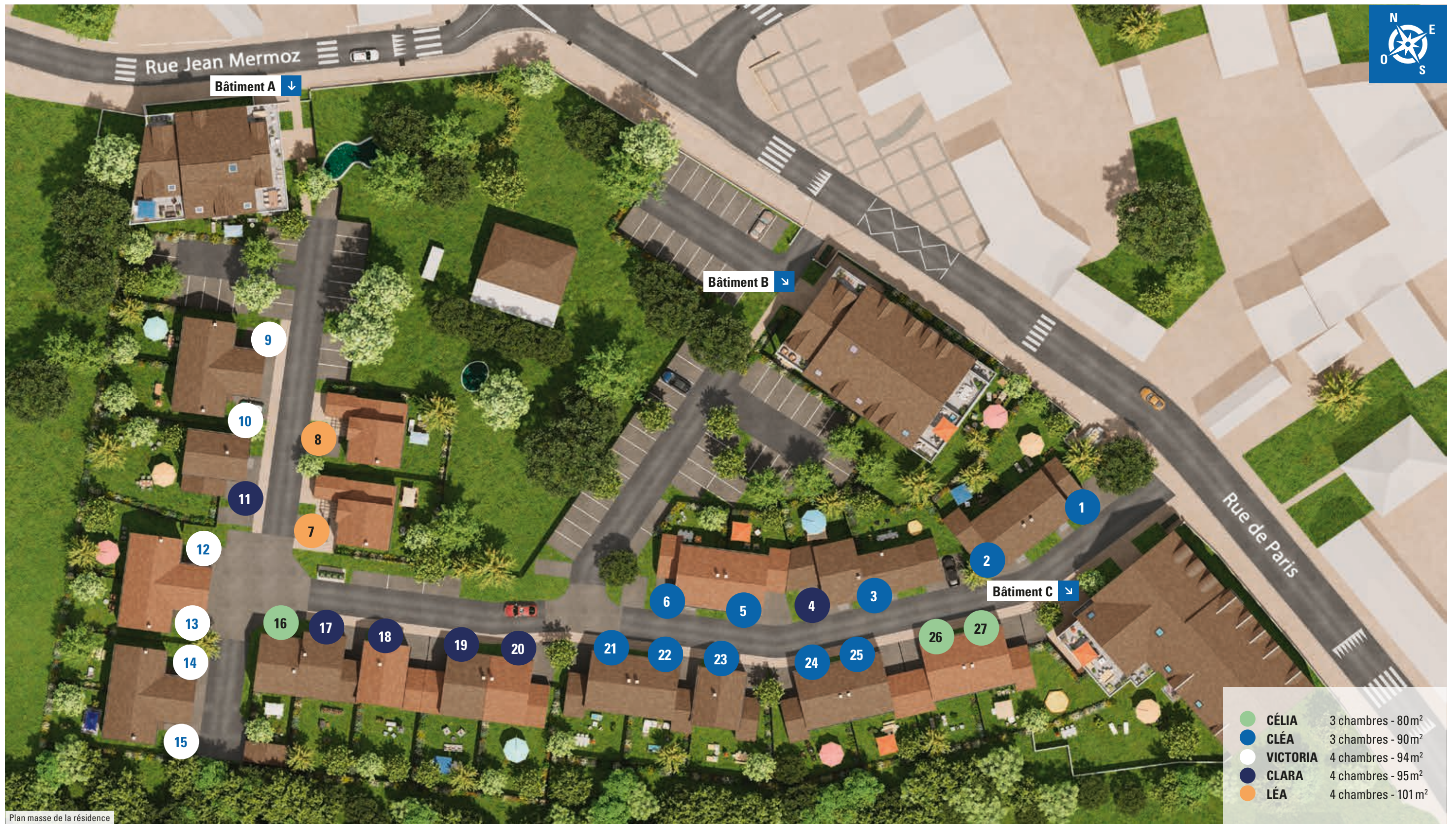
Plan masse de la résidence