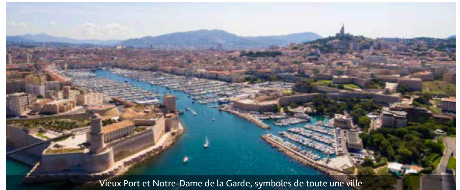
Vieux-Port et Notre-Dame de la Garde, symboles de toute une ville