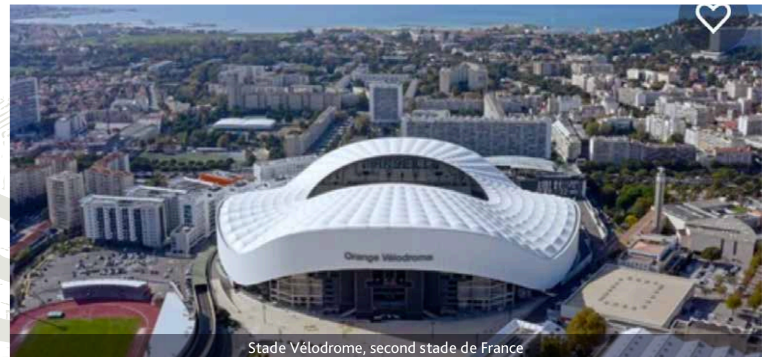
Stade Vélodrome, second stade de France

L'arrivée du B.U.S (Boulevard Urbain Sud) entrainera dans son sillage un tout nouveau quartier à la fois accessible, moderne, écologique, paisible et vivant.