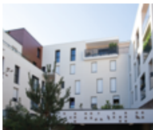
LOGEMENTS Le Félix Faure NANTES