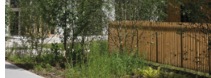
LOGEMENTS ET BUREAUX îlink NANTES