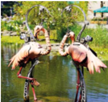
Bestiaire de la place Napoléon