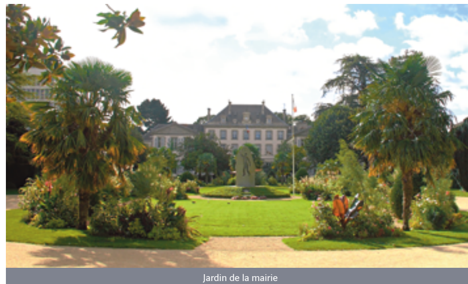
Jardin de la mairie

Ce quartier résidentiel présente de multiples avantages avec ses commerces et services de proximité, établissements scolaires et un accès rapide à la gare ainsi qu'aux transports en commun (arrêt de bus au pied de la résidence).