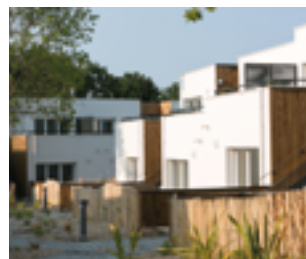
LOGEMENTS Le domaine de Sainte Marguerite PORNICHET