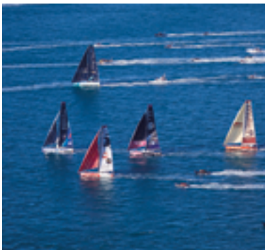
Le Vendée Globe

À mi-chemin entre Nantes et La Rochelle mais aussi proche du Puy du Fou et des Sables-d'Olonne, La Roche-sur-Yon est la capitale vendéenne par excellence. Principal centre urbain et pôle économique de la Vendée, la ville tient son nom du roc sur lequel elle a été construite et de la rivière, l'Yon, qui la traverse.