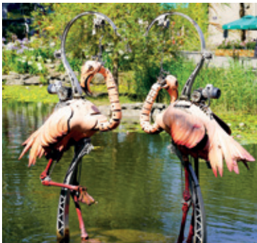
Bestiaire de la place Napoléon