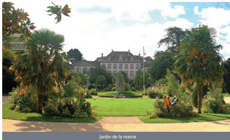
Jardin de la mairie

Ce quartier résidentiel présente de multiples avantages avec ses commerces et services de proximité, établissements scolaires et un accès rapide à la gare ainsi qu'aux transports en commun (arrêt de bus au pied de la résidence).