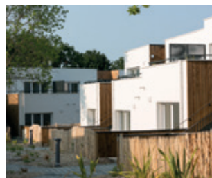
LOGEMENTS Le domaine de Sainte Marguerite PORNICHET