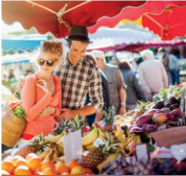
Marché de La Roche-sur-Yon