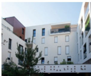
LOGEMENTS Le Félix Faure NANTES