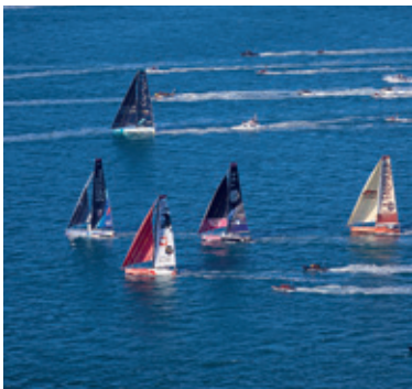
Le Vendée Globe

À mi-chemin entre Nantes et La Rochelle mais aussi proche du Puy du Fou et des Sables-d'Olonne, La Roche-sur-Yon est la capitale vendéenne par excellence. Principal centre urbain et pôle économique de la Vendée, la ville tient son nom du roc sur lequel elle a été construite et de la rivière, l'Yon, qui la traverse.