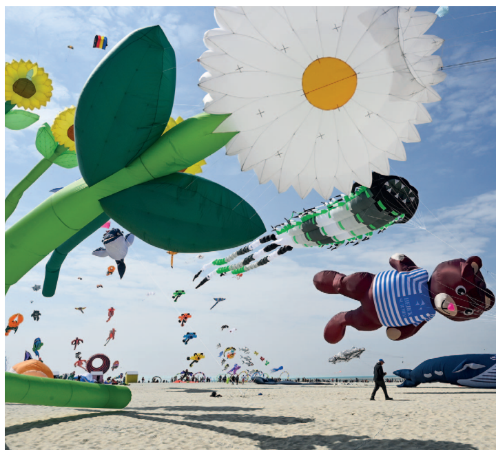
Les Rencontres Internationales de Cerfs-Volants à Berck-sur-Mer

Berceau du char à voile, Berck-sur-Mer est aussi le paradis des activités nautiques et des sports de vent sur la côte d'Opale. Kitesurf, canoë kayak, paddle, planche à voile, cerf-volant... : un rendez-vous incontournable pour les passionnés de glisse et de sensations décoiffantes. Les Rencontres Internationales de Cerfs-Volants qui attirent plus de 500 000 personnes tous les ans au mois d'avril ou la course de char à voile des 6 Heures de Berck signent des moments forts de la vie berckoise.