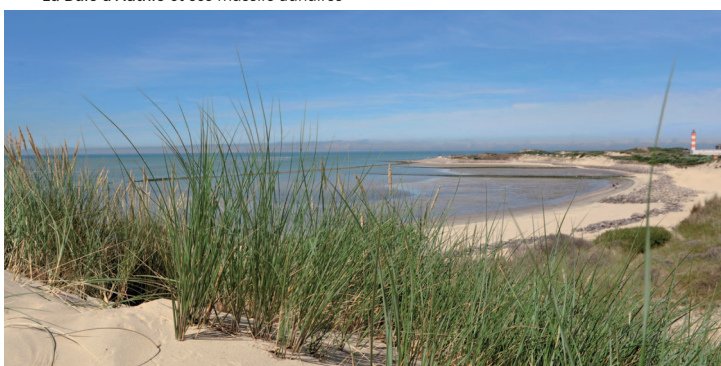
La Baie d'Authie et ses massifs dunaires

Son développement touristique est également l'autre point fort de cette station balnéaire dynamique prisée par les vacanciers et les amoureux d'air pur . Son immense plage de sable fin balayée par le vent qui s'étend sur près de 12 kilomètres, son magnifique patrimoine naturel préservé, ses quartiers pittoresques, son centre-ville animé, ses cabines de plage aux tons pastels et ses événements internationaux participent activement à son art de vivre et à sa renommée.