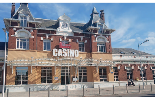
Le Casino de Berck-sur-Mer

A l'occasion d'un séjour ou pour y résider à l'année, vivez en toute simplicité le meilleur de Berck-sur-Mer.