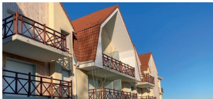
Les Hauts de S' Val à Saint-Valéry-sur-Somme