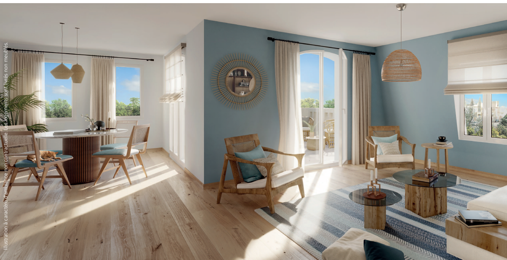
Illustration à caractère d'ambiance non contractuelle. Les logements sont livrés non meublés.