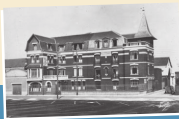
La Villa Sylvia à la moitié du XX ème siècle