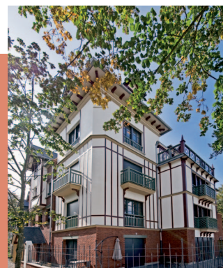
Villa Victoria à Saint-Valéry-sur-Somme

Acteur local et régional engagé aux côtés de ceux qui, chaque jour, contribuent à façonner le visage des villes et territoires de demain, VINCI Immobilier compte parmi les intervenants économiques majeurs dans les Hauts de France, avec des réalisations qui font référence dans cette région. Pour vous, la garantie de pouvoir compter sur une réelle proximité.