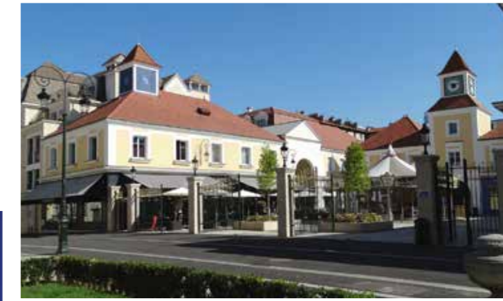
Place du Théâtre

Une architecture soignée, des façades élégantes et des appartements dotés de tous les éléments de design et de confort capables de répondre aux attentes d'aujourd'hui. Une qualité qui s'apprécie d'abord au présent et prend toute sa valeur avec le temps.