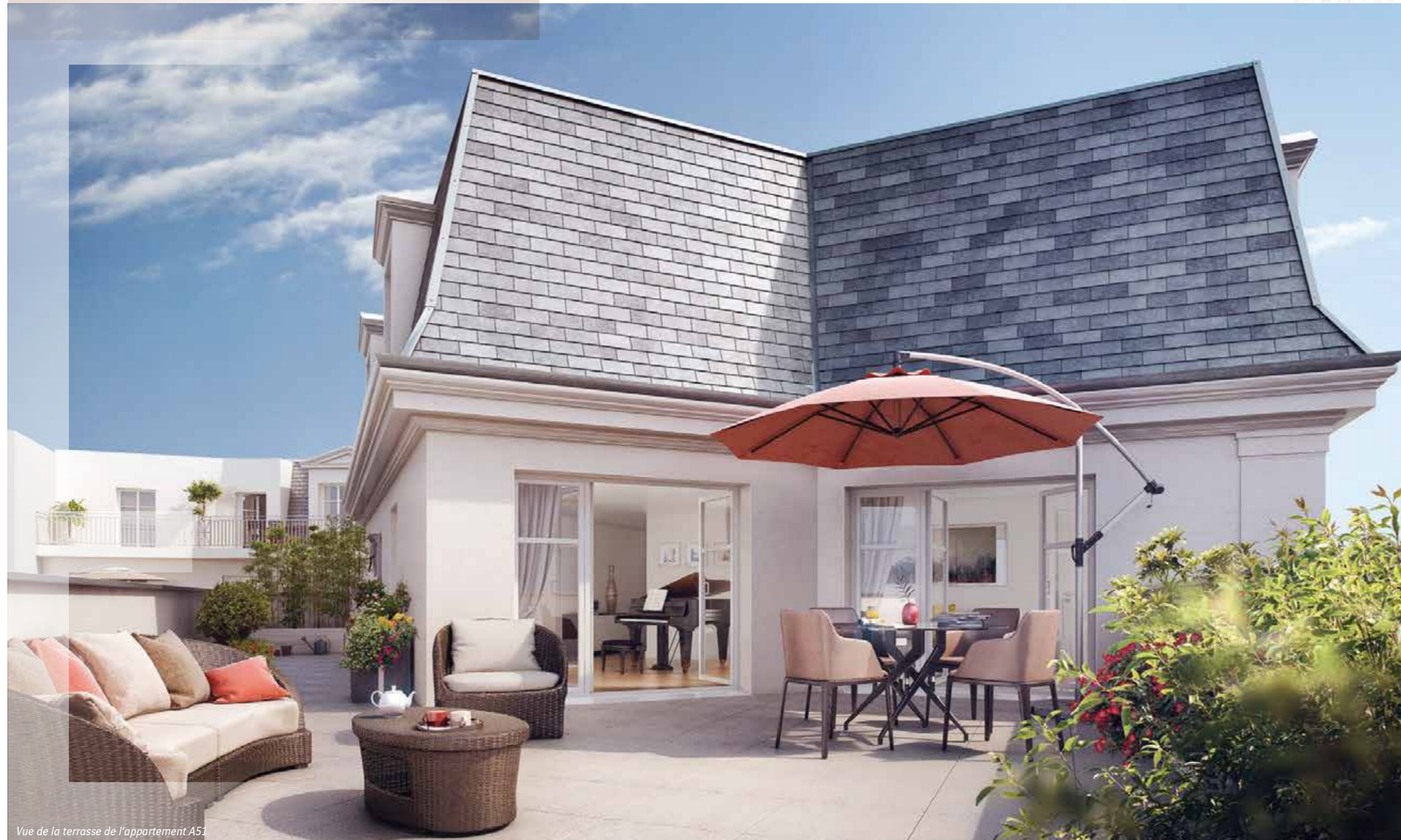
Vue de la terrasse de l'appartement A51

La conception des plans a fait l'objet de toutes les attentions : dispositions bien conçues, volumes généreux pour les espaces de réception, balcons et terrasses pour la plupart des appartements. Du studio au 5 pièces, Éloquence offre le privilège d'une adresse située au cœur de l'animation commerçante tout en ménageant la quiétude des résidents.