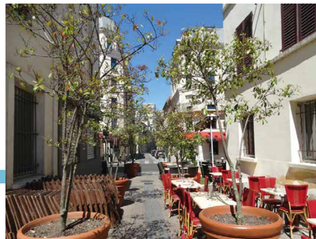
La rue Auguste Blanche