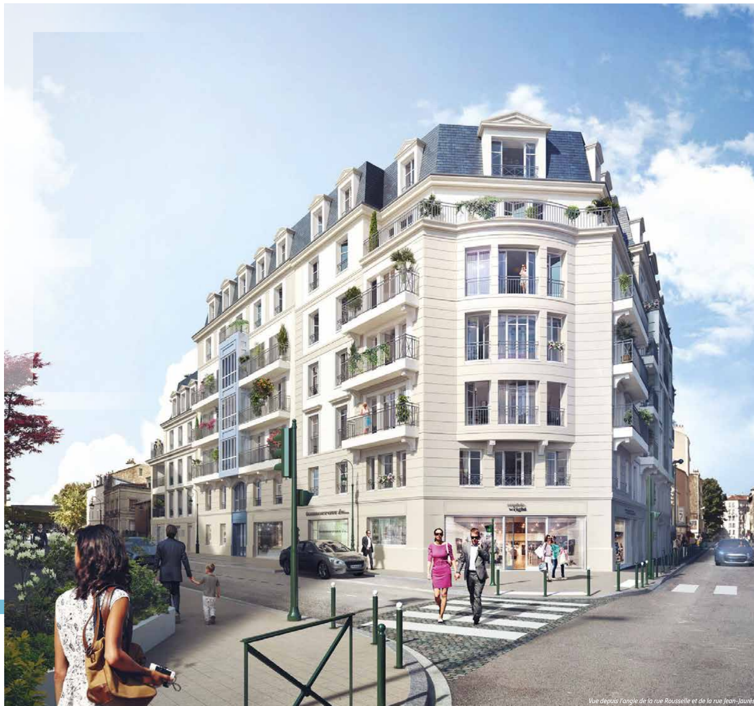
Vue depuis l'angle de la rue Rouselle et de la rue Jean-Jaurès