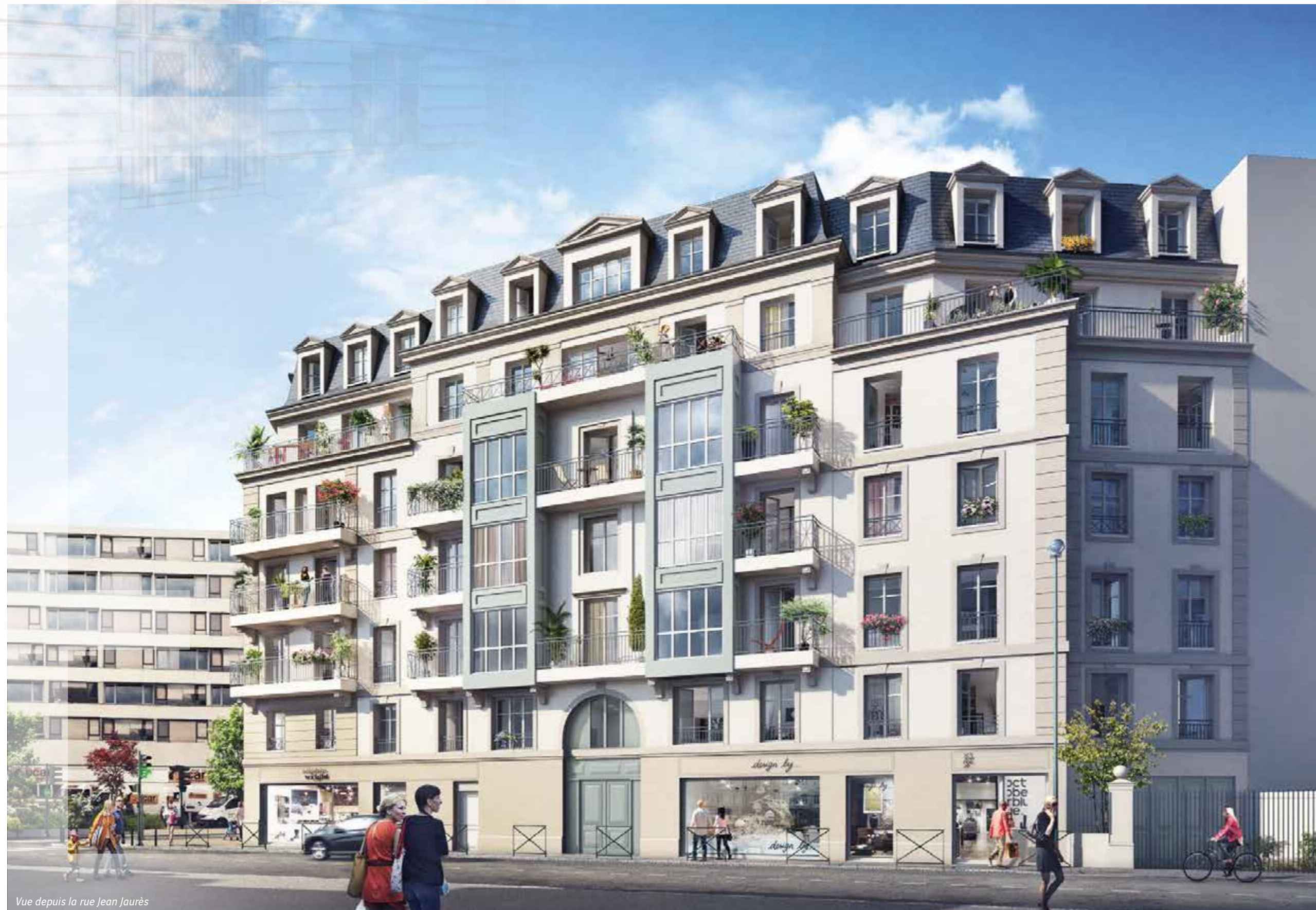
Vue depuis la rue Jean Jaurès

À proximité de l'esplanade de l'Hôtel de ville, Éloquence présente fièrement sa silhouette séquencée. Édifié sur 6 étages, ce bel immeuble d'angle affiche une écriture classique et une façade rythmée de nombreuses baies. Une toiture d'ardoise et zinc ponctuée de lucarnes coiffe cette résidence rassurante. Un large pan coupé à l'angle des deux rues, tel un signal architectural, fait face à la nouvelle place. Des bow-windows à dominante métallique ponctuent les façades et leur confèrent couleur et modernité. Les balcons et les retraits aux derniers étages animent l'ensemble, tout en harmonie.