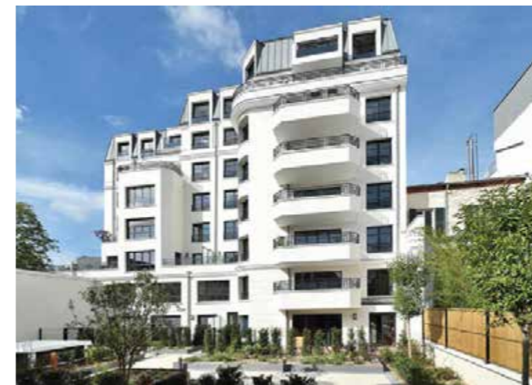
16 Victor Hugo