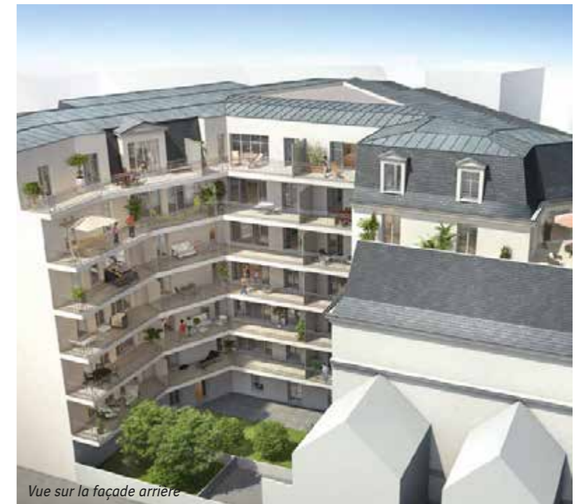
Vue sur la façade arrière