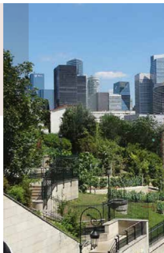
Au pied du quartier d'affaires de La Défense