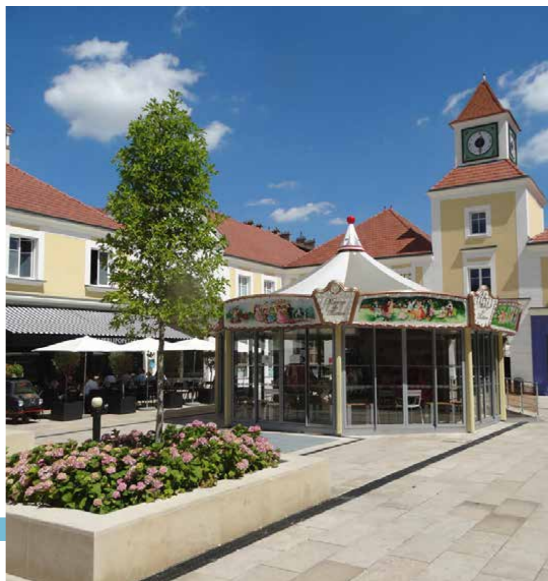
Les commerces de la place du Théâtre

Les fleurons de l'industrie avaient donné le coup d'envoi. La Défense a transformé l'essai et Puteaux s'est hissée parmi les communes les plus prisées de l'Île-de-France. Pourtant, la ville se targue d'avoir su entretenir jalousement son esprit village. En témoignent les lampadaires qui ponctuent les ruelles et les placettes pavées. En célébrant son passé villageois, la ville fascine par sa singularité et par cet art de vivre si tranquille, tout en étant près de La Défense et Paris.