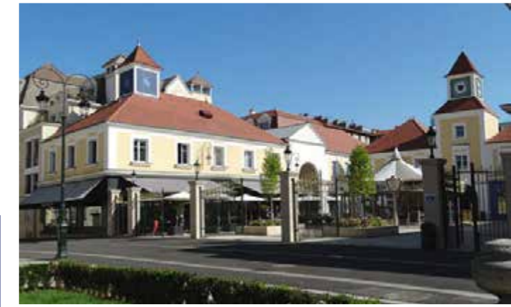
Place du Théâtre

Une architecture soignée, des façades élégantes et des appartements dotés de tous les éléments de design et de confort capables de répondre aux attentes d'aujourd'hui. Une qualité qui s'apprécie d'abord au présent et prend toute sa valeur avec le temps.