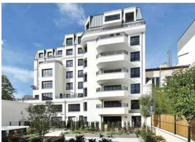
16 Victor Hugo