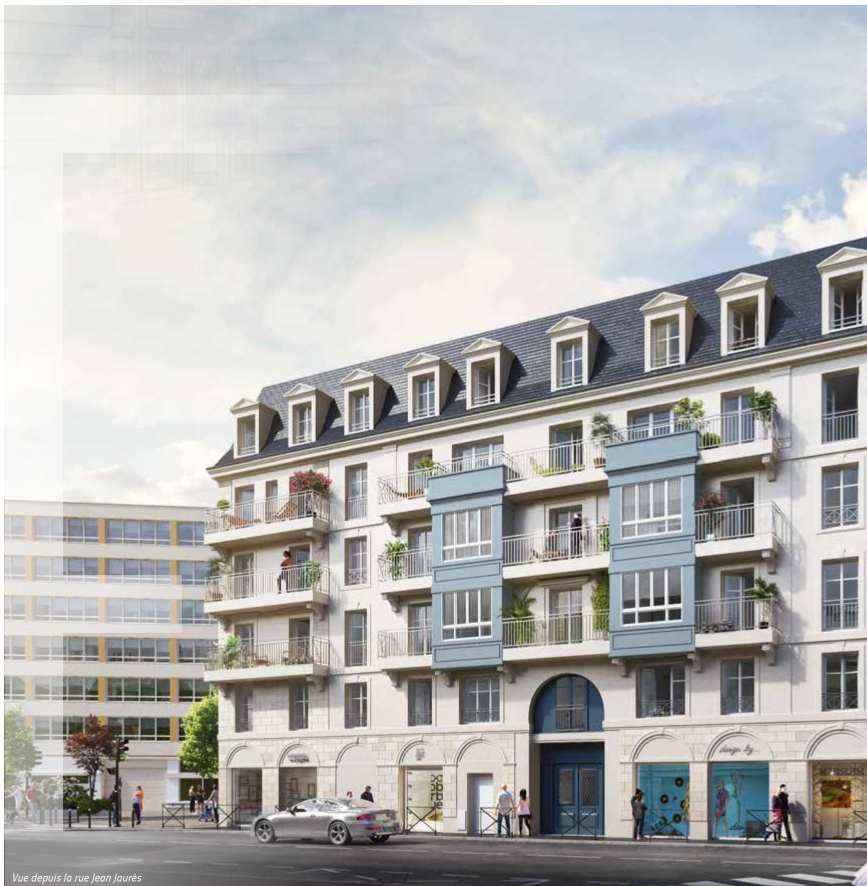
Vue depuis la rue Jean Jaurès

À proximité de l'esplanade de l'Hôtel de ville, Éloquence présente fièrement sa silhouette séquencée. Ce bel immeuble d'angle affiche une écriture classique et une façade rythmée de nombreuses baies. Une toiture d'ardoise et zinc ponctuée de lucarnes coiffe cette résidence rassurante. Un large pan coupé à l'angle des deux rues, tel un signal architectural, fait face à la nouvelle place. Des bow-windows à dominante métallique ponctuent les façades et leur confèrent couleur et modernité. Les balcons et les retraits aux derniers étages animent l'ensemble, tout en harmonie.