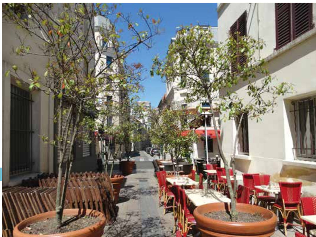
La rue Auguste Blanche