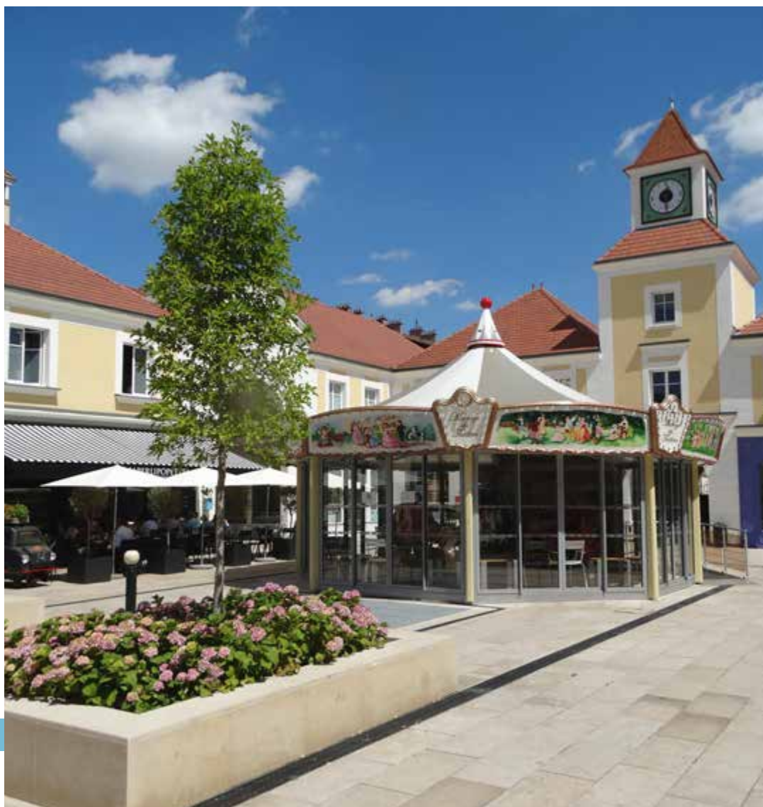
Les commerces de la place du Théâtre

Les fleurons de l'industrie avaient donné le coup d'envoi. La Défense a transformé l'essai et Puteaux s'est hissée parmi les communes les plus prisées d'Île-de-France. Pourtant, la ville se targue d'avoir su entretenir jalousement son esprit village. En témoignent les lampadaires qui ponctuent les ruelles et les placettes pavées. En célébrant son passé villageois, la ville fascine par sa singularité et par cet art de vivre si tranquille, tout en étant près de La Défense et Paris.