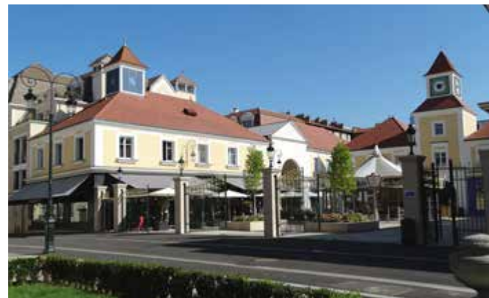
Place du Théâtre

Une architecture soignée, des façades élégantes et des appartements dotés de tous les éléments de design et de confort capables de répondre aux attentes d'aujourd'hui. Une qualité qui s'apprécie d'abord au présent et prend toute sa valeur avec le temps.