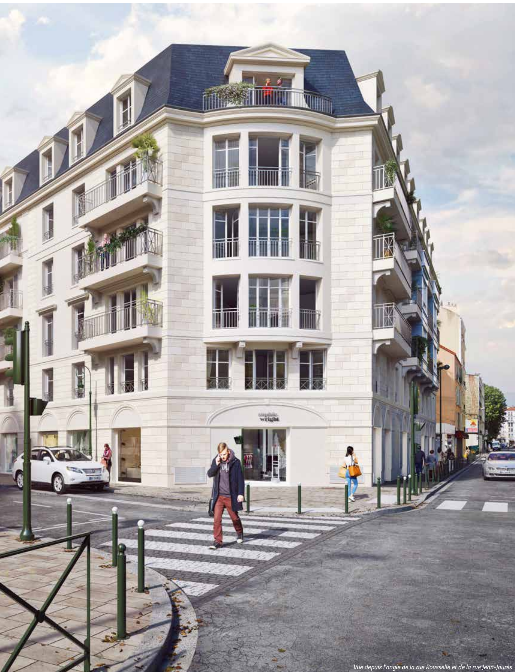
Vue depuis l'angle de la rue Rousselle et de la rue Jean-Jaurès