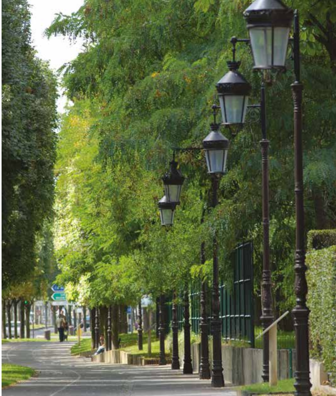
Les bords de Seine

Longée par la Seine, Puteaux témoigne de la douceur de vivre des villes au bord de l'eau. Son île, avec une roseraie, un parcours de santé en sous-bois et un kiosque à musique préservent les Putéo-liens de la ville trépidante. La piscine et les festivals annoncent la belle saison. De l'autre côté du pont, le Bois de Boulogne et ses musées offrent d'autres destinations de promenade. De l'artothèque à la Maison de Camille, de la Roseraie au Jardin des Vignes, Puteaux trouve l'équilibre parfait entre nature et culture.