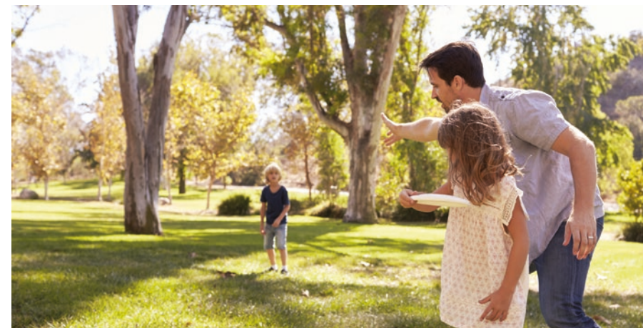
Le Parc de l'Orangerie