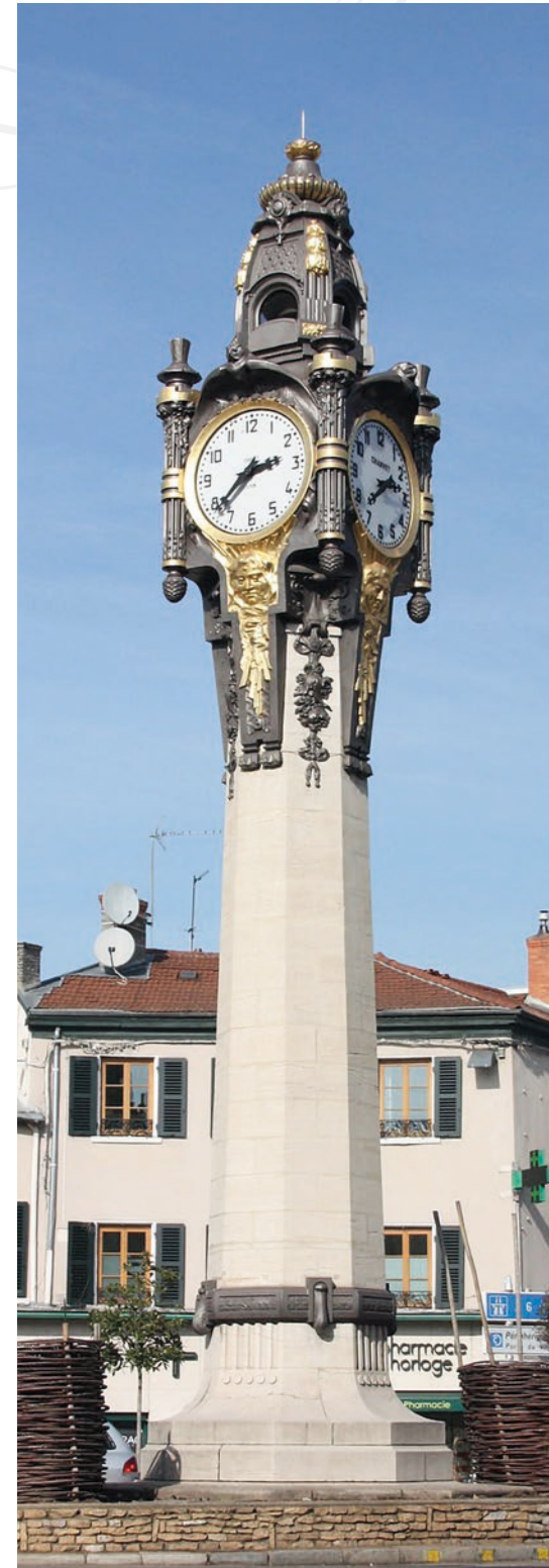
À Tassin, tous les chemins mènent à l'Horloge

23 491 habitants Top 5 des communes de la Métropole de Lyon pour son attractivité commerciale 3 650 entreprises en 2020 3 gares SNCF : Ecully la Demi-Lune, Tassin et Alai