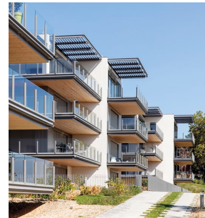
Logements - DEBROUSSE PARC - LYON 5 e

Pour vous, la garantie de pouvoir compter sur une réelle proximité.