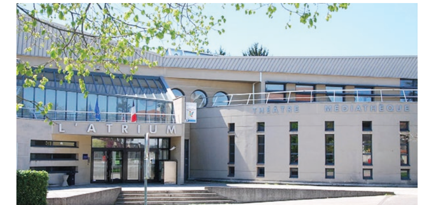
L'Atrium propose une médiathèque, une bibliothèque et un théâtre

L'Atrium, espace culturel situé au cœur de la ville, propose un accès privilégié à des spectacles de danse, de théâtre et de musique de qualité, à travers une programmation riche et variée. Des expositions photos et événements artistiques pour les petits et les grands viennent compléter cette offre. De plus, la médiathèque « Médialune », implantée au sein de l'Atrium, met à disposition des Tassilunois plus de 45.000 livres, 16.000 CD, 3.500 DVD, 10 liseuses et 50 abonnements à la presse, pour tous les âges, ainsi qu'un accès wifi gratuit.