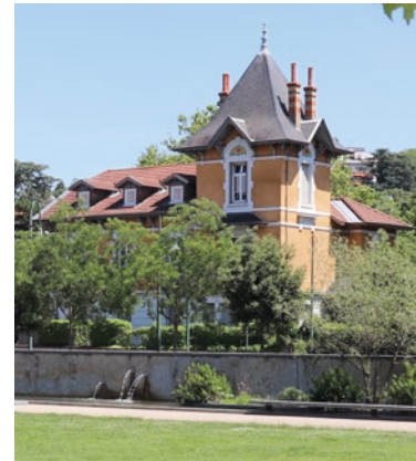
La Maison de la Métropole