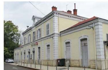
Une des trois gares de la commune