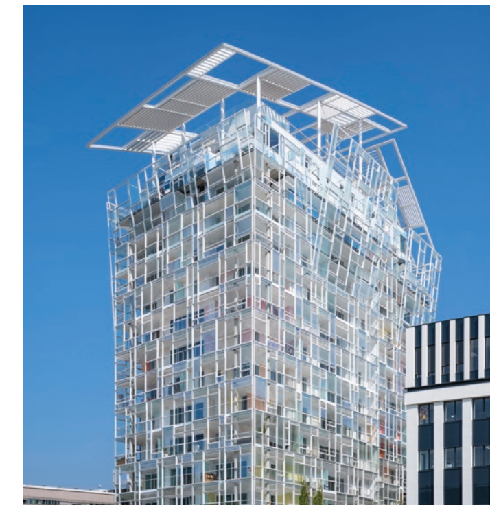
Logements - YCONE - LYON 2 e