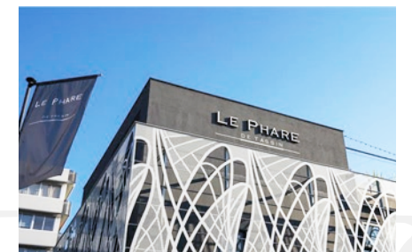
À 2 min de la résidence, le nouveau centre commercial "Le Phare"