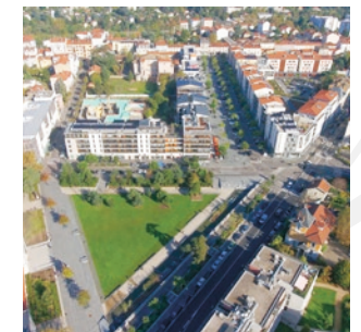
L'avenue Charles de Gaulle et la promenade commerçante des Tuileries