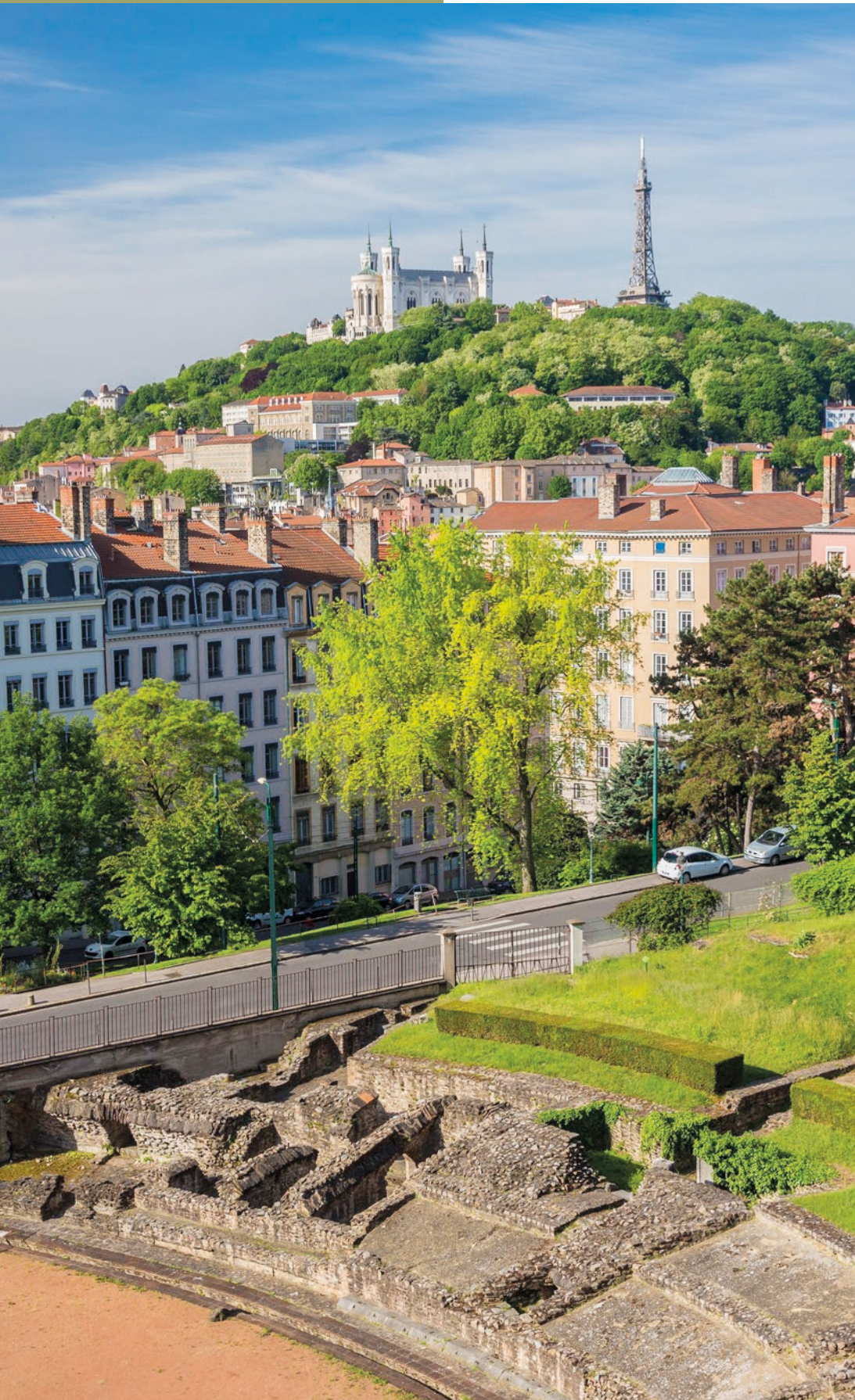
L'amphithéâtre des Trois Gaules et la colline de Fourvière