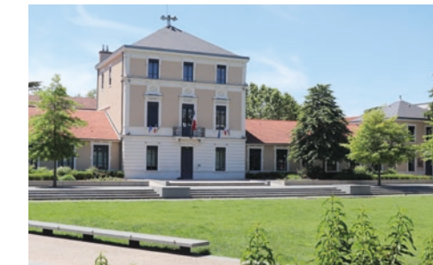
La Mairie de Tassin-la-Demi-Lune