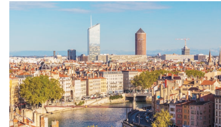
Lyon, les quais de Saône, les tours de la Part-Dieu et les Alpes en toile de fond

La capitale des Gaules, mondialement connue pour la richesse de son architecture inscrite au patrimoine mondial de l'Unesco, attire chaque année de très nombreux visiteurs également séduits par la renommée de sa gastronomie. La métropole lyonnaise brille aussi par son économie florissante, portée par la puissance de son industrie et par le dynamisme de son secteur de la recherche et du développement.