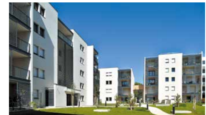
Royance à Royan

Acteur local et régional engagé aux côtés de ceux qui, chaque jour, contribuent à façonner le visage des villes et territoires de demain, VINCI Immobilier compte parmi les intervenants économiques majeurs en Nouvelle-Aquitaine avec des réalisations qui font références dans la région. Pour vous, la garantie de pouvoir compter sur une réelle proximité.