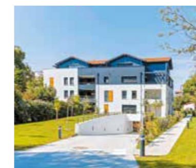
Vill'Amarine à Soorts-Hossegor