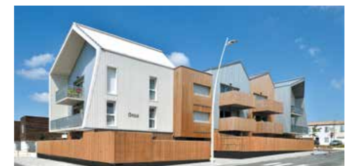
Ônia à La Rochelle