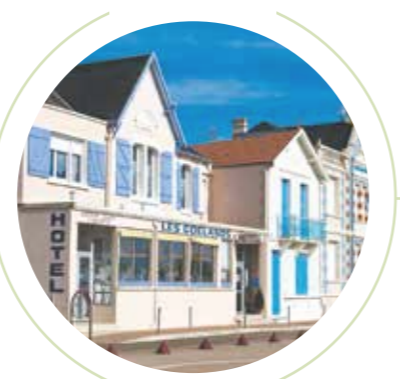
Front de mer