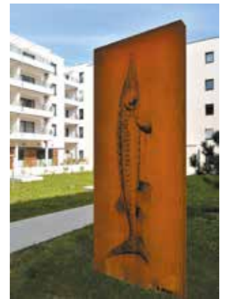
"Le Totem de l'Esturgeon" réalisé par Marianne Peltzer Résidence Les Balcons de Royance

Tout en soutenant les artistes et la création contemporaine française, VINCI Immobilier invite ainsi l'art dans le quotidien et dans la ville.