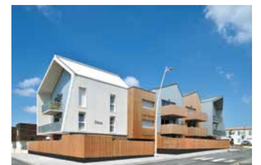
Ônia à La Rochelle