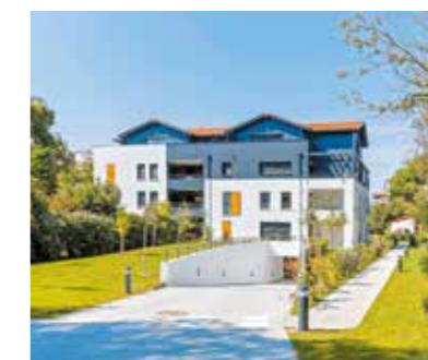
Vill'Amarine à Soorts-Hossegor