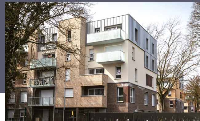
L'ORÉE DE BARBIEUX • CROIX

collaborateurs conçoivent et réalisent des opérations qui contribuent à l'amélioration du cadre de vie et de travail, en immobilier tertiaire comme en logements. La maîtrise de l'ensemble de nos métiers et notre capacité d'innovation permanente nous permettent de répondre à vos attentes, en vous apportant des solutions sur-mesure qui anticipent les futures mutations des modes de vie.