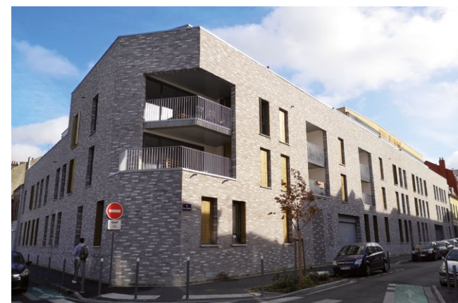
IN' SIDE • LILLE

De la signature du contrat de réservation à la remise des clés, vous bénéficiez d'interlocuteurs responsables et attentifs qui vous assurent à chaque instant un haut niveau de transparence et de confiance.