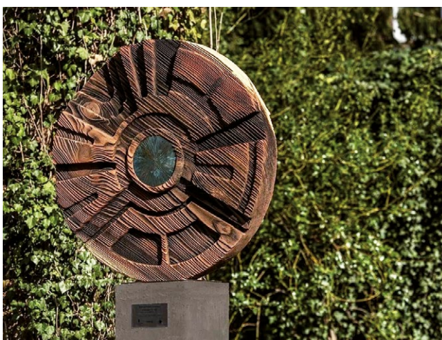
SCULPTURE BOIS © ARNAUD POTTIER • RÉALISATION FÉVRIER 2021

Qu'elle soit sculpture, peinture, lumière, vidéo ou autre, l'œuvre participe à l'amélioration de la qualité de vie des occupants ou des visiteurs et se laisse contempler par tous, sans distinction. Tout en soutenant les artistes et la création contemporaine française, VINCI Immobilier invite ainsi l'art dans le quotidien et dans la ville.