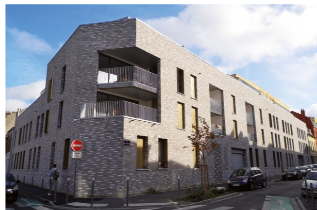
IN' SIDE - LILLE

De la signature du contrat de réservation à la remise des clés, vous bénéficiez d'interlocuteurs responsables et attentifs qui vous assurent à chaque instant un haut niveau de transparence et de confiance.