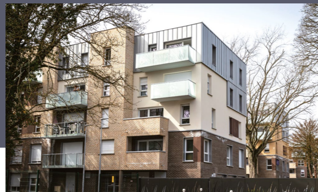
L'ORÉE DE BARBIEUX - CROIX

collaborateurs conçoivent et réalisent des opérations qui contribuent à l'amélioration du cadre de vie et de travail, en immobilier tertiaire comme en logements. La maîtrise de l'ensemble de nos métiers et notre capacité d'innovation permanente nous permettent de répondre à vos attentes, en vous apportant des solutions sur-mesure qui anticipent les futures mutations des modes de vie.