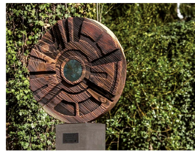
SCULPTURE BOIS © ARNAUD POTTIER - RÉALISATION FÉVRIER 2021

Qu'elle soit sculpture, peinture, lumière, vidéo ou autre, l'œuvre participe à l'amélioration de la qualité de vie des occupants ou des visiteurs et se laisse contempler par tous, sans distinction. Tout en soutenant les artistes et la création contemporaine française, VINCI Immobilier invite ainsi l'art dans le quotidien et dans la ville.