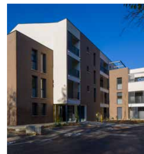
Résidence E-MAJ, 43 chemin des Carmes, 31400 Toulouse

Pour vous, la garantie de pouvoir compter sur une réelle proximité.