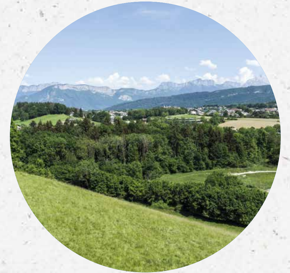
Une vue époustouflante depuis les terrasses et balcons