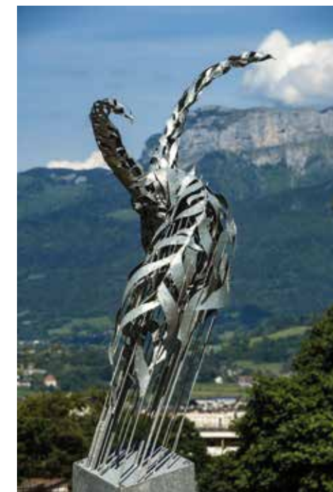
Œuvre d'art Scénographie - Seynod

Tout en soutenant les artistes et la création contemporaine française, VINCI Immobilier invite ainsi l'art dans le quotidien et dans la ville.