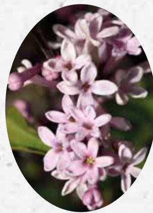
Syringa Josee Lilas de Chine