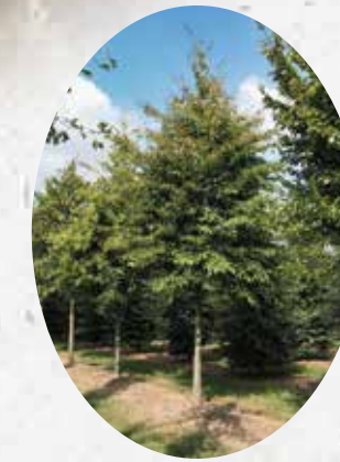
Carpinus Betulus Charme commun. Caduc.