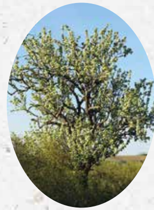
Pyrus Pyraster Poirier sauvage européen. Caduc.