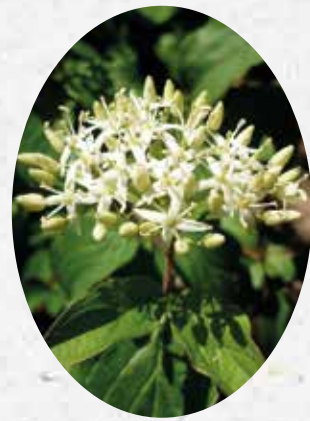
Cornus Sanguinea Carnouiller sanguin