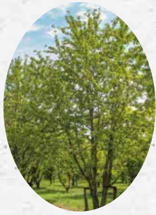
Prunus Avium Merisier des oiseaux. Caduc.