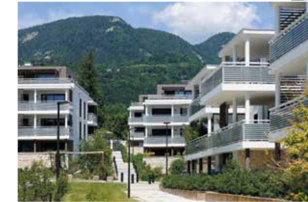
Gex - Castle Park

Acteur local et régional engagé aux côtés de ceux qui, chaque jour, contribuent à façonner le visage des villes et territoires de demain, VINCI Immobilier compte parmi les intervenants économiques majeurs en Région Auvergne-Rhône-Alpes avec des réalisations qui font référence dans la région. Pour vous, la garantie de pouvoir compter sur une réelle proximité.