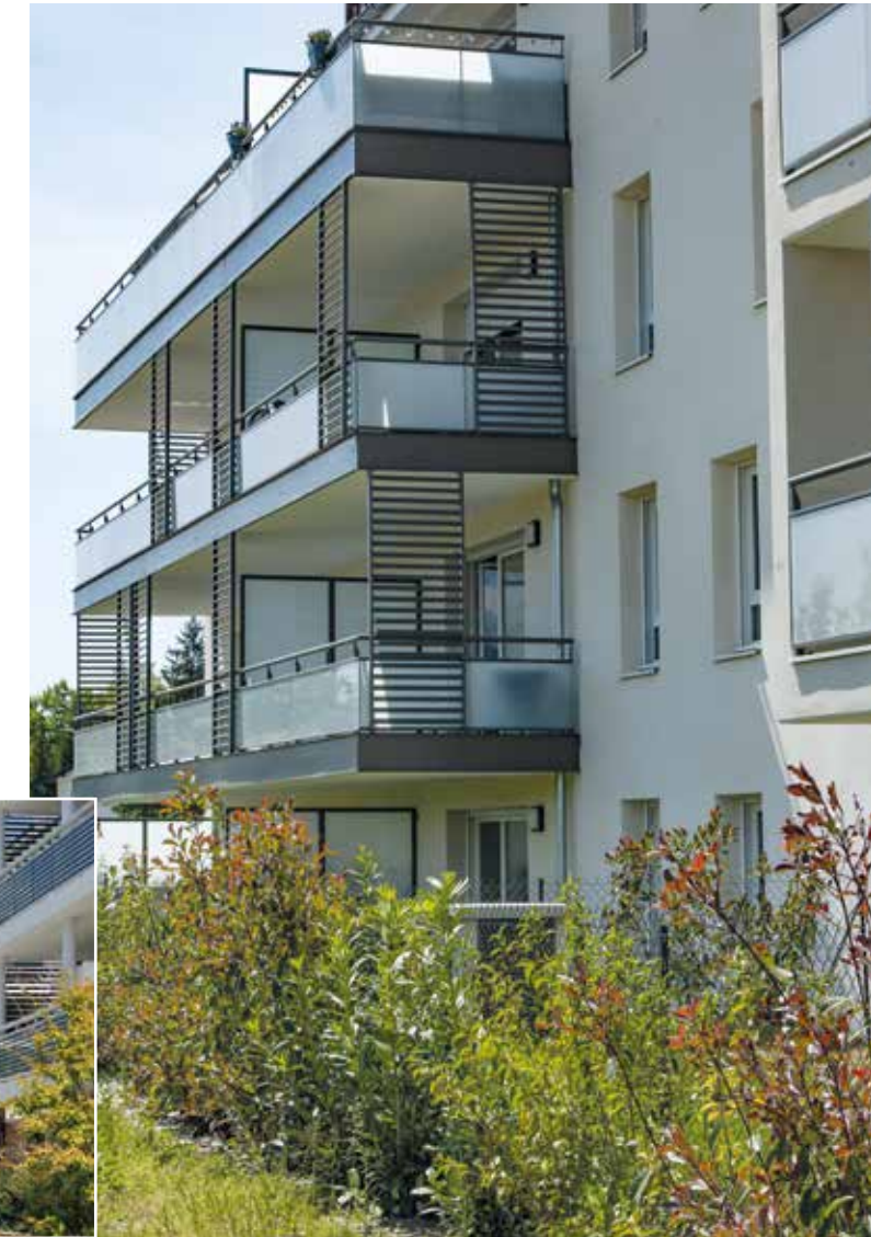
Poisy - 5 Sens