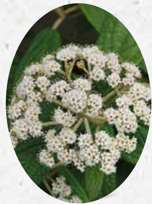
Viburnum Lantana Viorne lantane