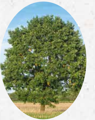
Quercus Robur Chêne pédonculé. Caduc.