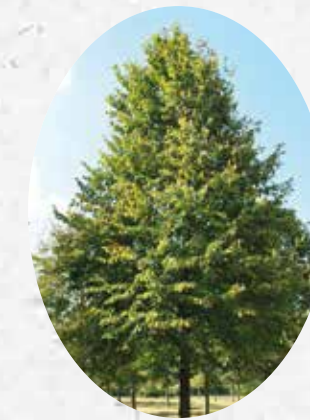
Tilia Cordata Tilleul à petites feuilles. Caduc.