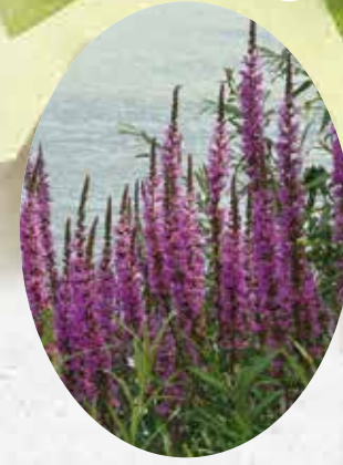
Lythrum Salicaria Salicaire commune