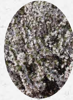
Prunus Tomentosa Cerisier tomenteux à fleurs. Caduc.