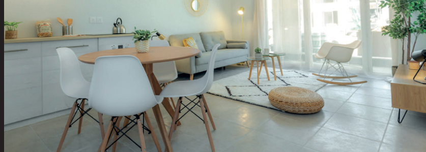
Appartement décoré de la résidence Symbiose - Carros

La maîtrise de l'ensemble de nos métiers et notre capacité d'innovation permanente nous permettent de répondre à vos attentes, en vous apportant des solutions sur-mesure qui anticipent les futures mutations des modes de vie.