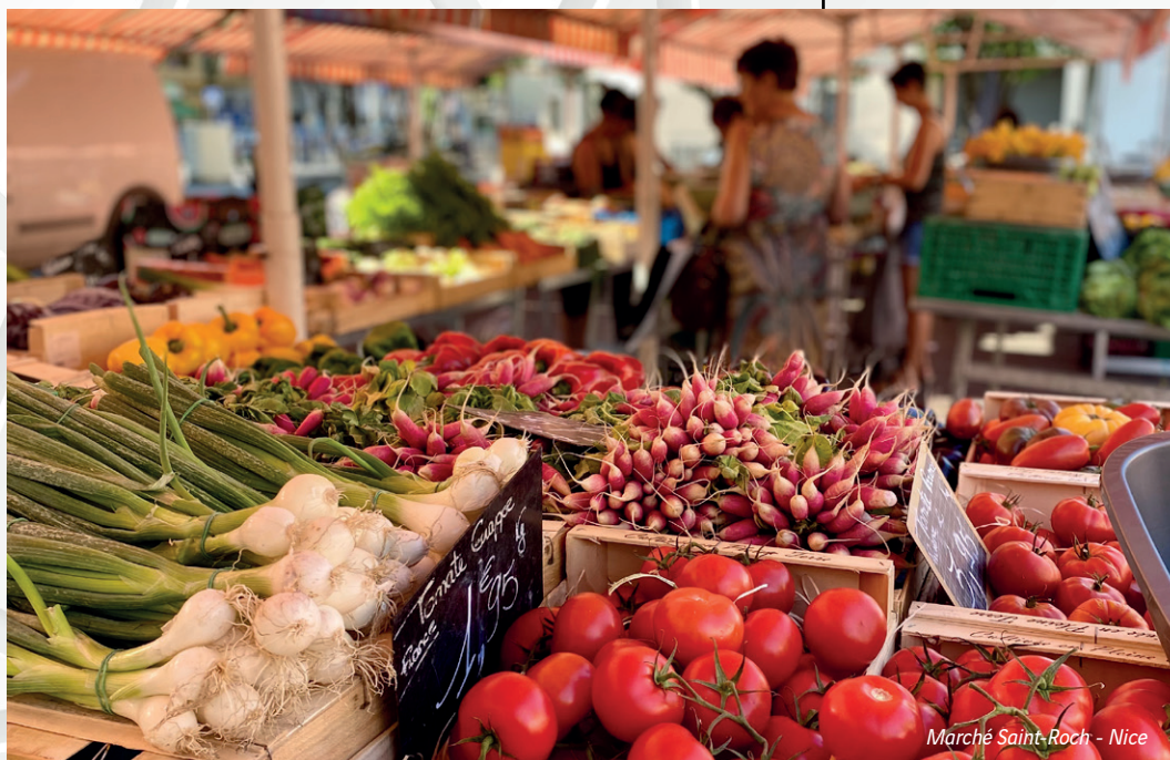
Marché Saint-Roch - Nice

“ Un quartier ouvert sur la ville, à deux pas des collines et de la Méditerranée. ”