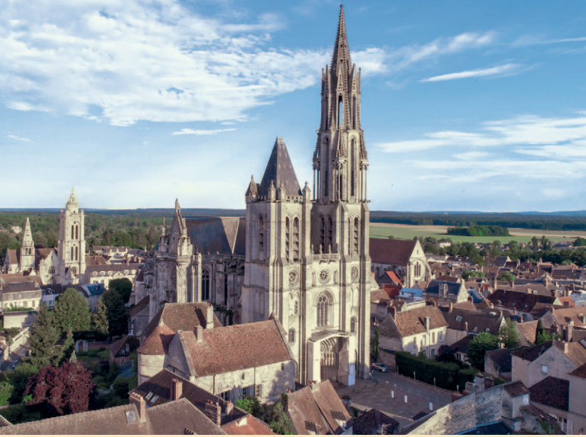
La Cathédrale Notre-Dame et le cœur historique de Senlis