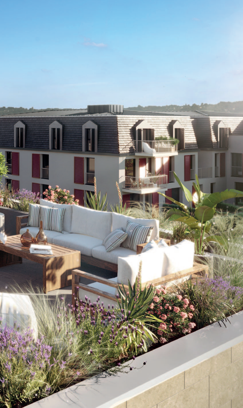
Illustration à caractère d'ambiance non contractuelle. Les logements sont livrés non meublés.