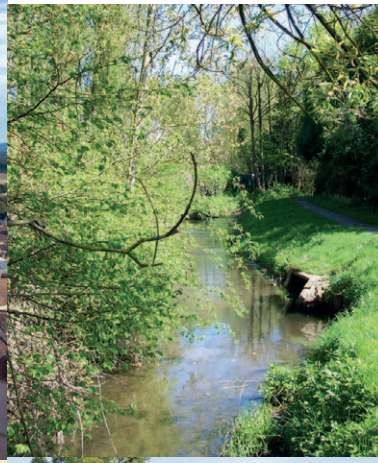
La rivière de l'Aunette