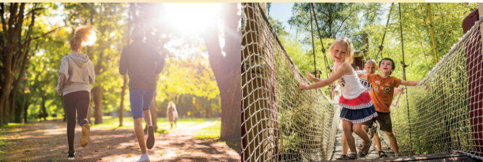
Accrobranche à la Mer de Sable