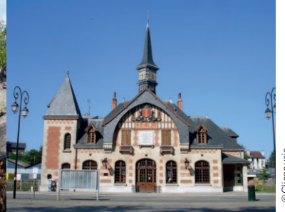
La gare de Senlis