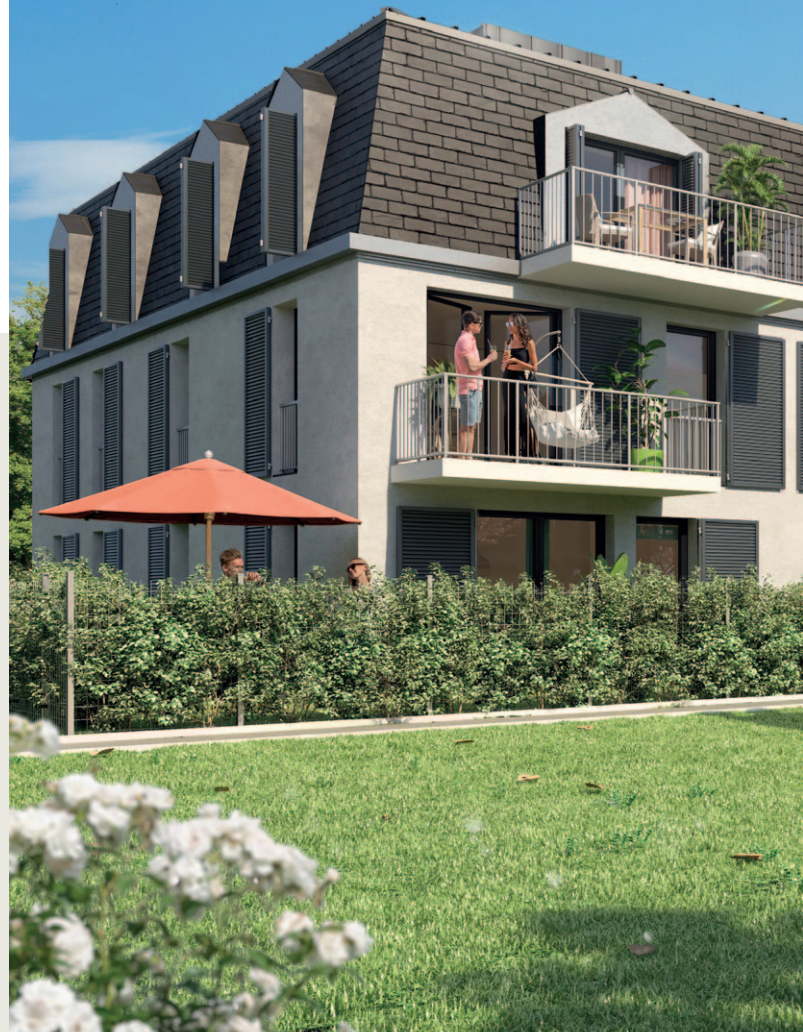
Illustration à caractère d'ambiance non contractuelle. Les logements sont livrés non meublés.

Conception : Paul Mathieu - ARVAL Architecture / Crépy-en-Valois