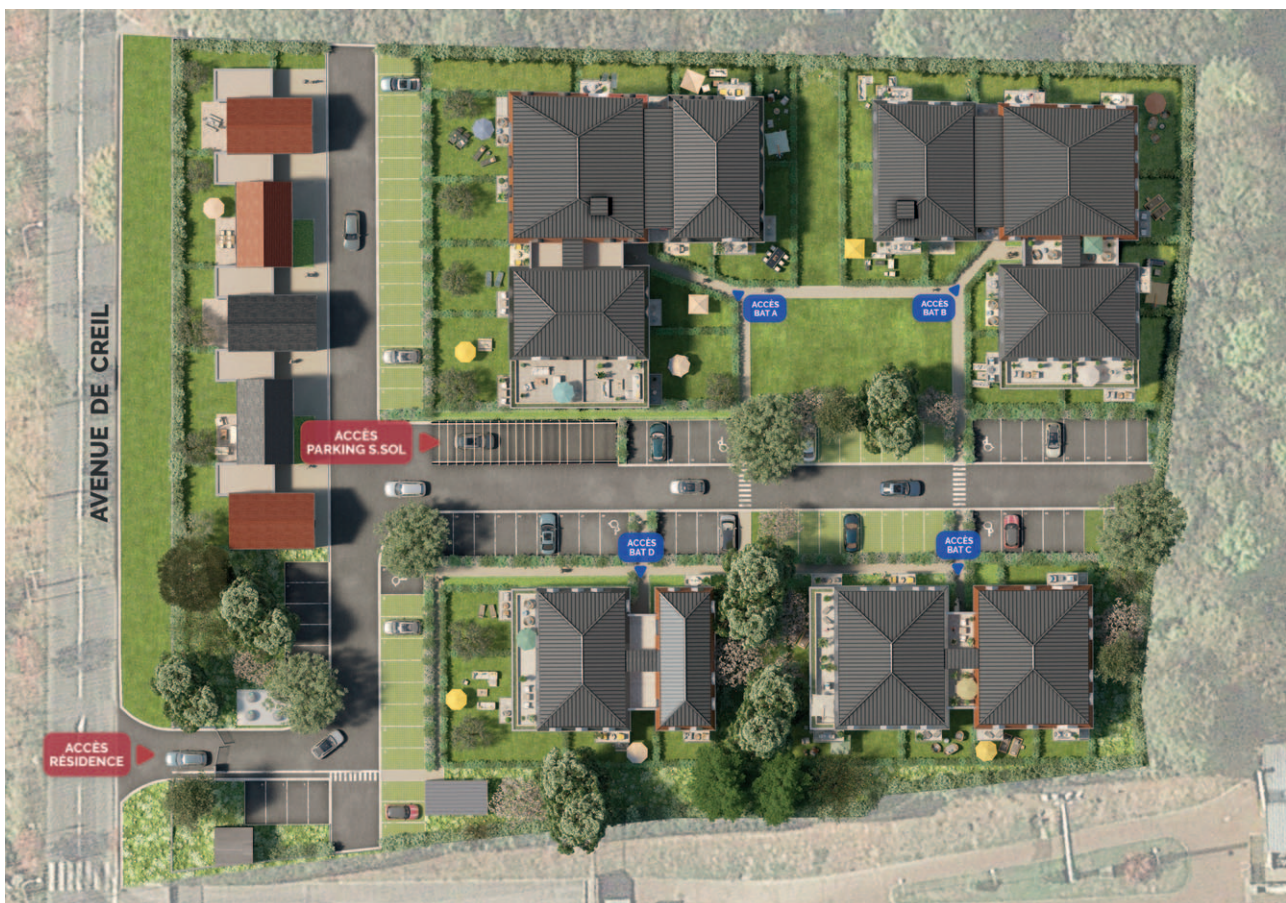
Plan de masse de la résidence

Conception : Paul Mathieu - ARVAL Architecture / Crépy-en-Valois