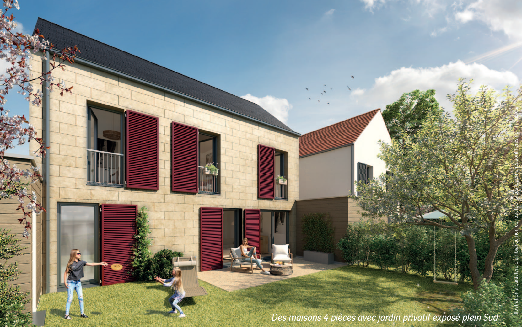
Des maisons 4 pièces avec jardin privatif exposé plein Sud

Illustration à caractère d'ambiance, non contractuelle. Les logements sont livrés avec matériaux.