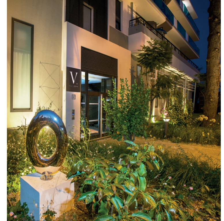
Résidence Villa Vespins - Cagnes-sur-Mer Artiste de l'œuvre : Laetitia ORTIZ VINAY