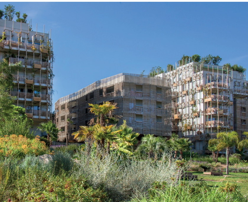
Résidence Nice Le Ray

Tout en soutenant les artistes et la création contemporaine française, VINCI Immobilier invite ainsi l'art dans le quotidien et dans la ville.