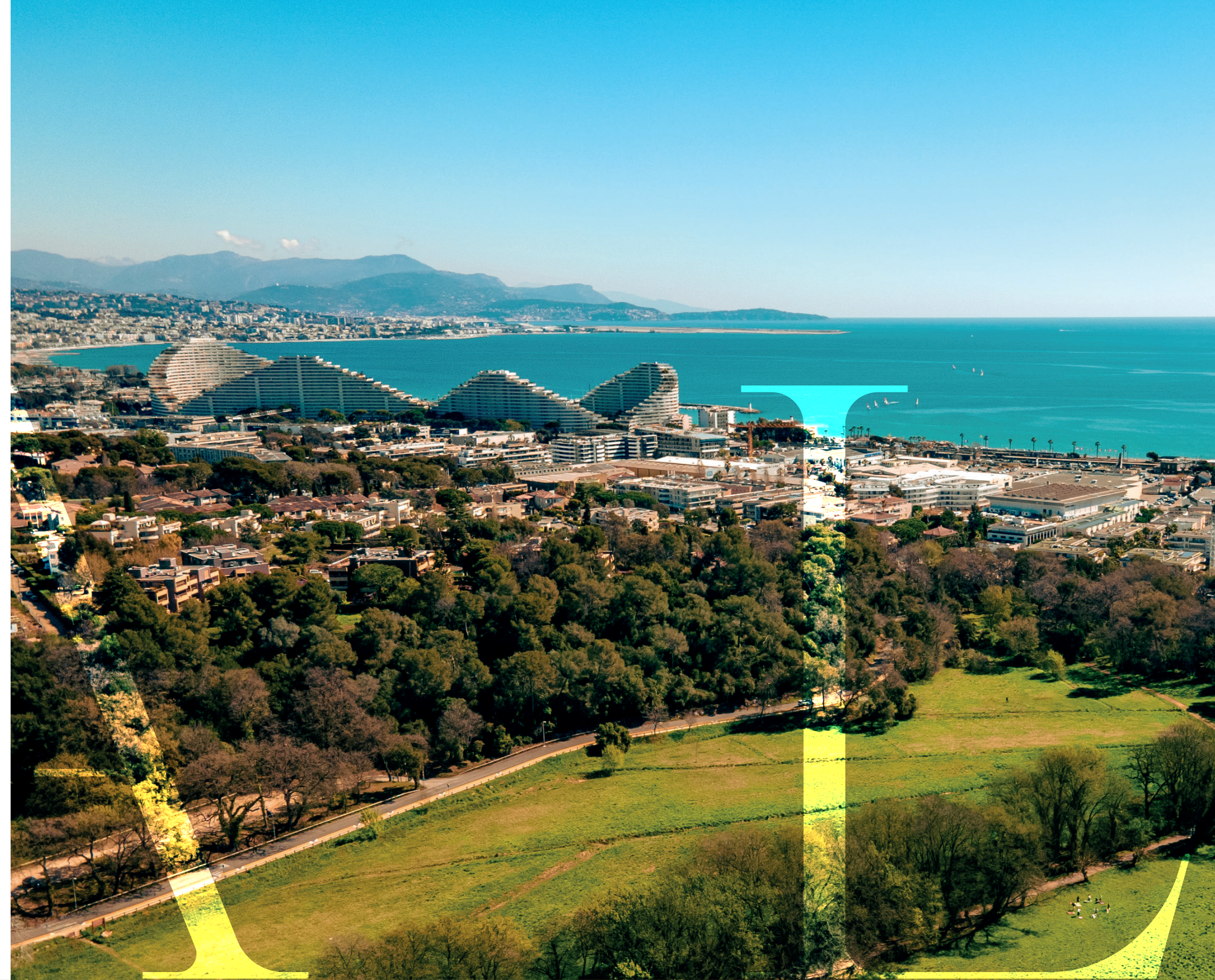
Parc de Vaugrenier - Marina Baie des Anges

Entre vie active et vacances, Villeneuve-Loubet est le lieu rêvé pour une nouvelle tranche de vie.