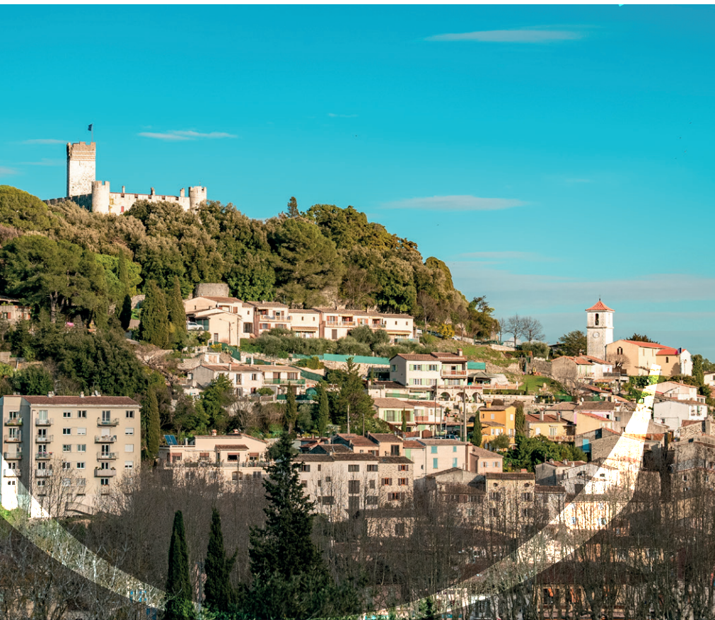
Village médiéval de Villeneuve-Loubet