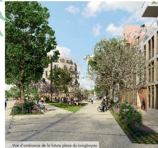
Vue d'ambiance de la future place du Longboyau

Connectée à la capitale, par le RER C accessible par les gares de Saules, d'Orly-Ville et de Pont de Rungis, et, prochainement par les lignes 14 et 18 du métro, Orly profite d'un réseau de transports en commun dense. Le tramway T9 ainsi que plusieurs lignes de bus et noctiliens parcourent la métropole et assurent des déplacements facilités aux habitants.