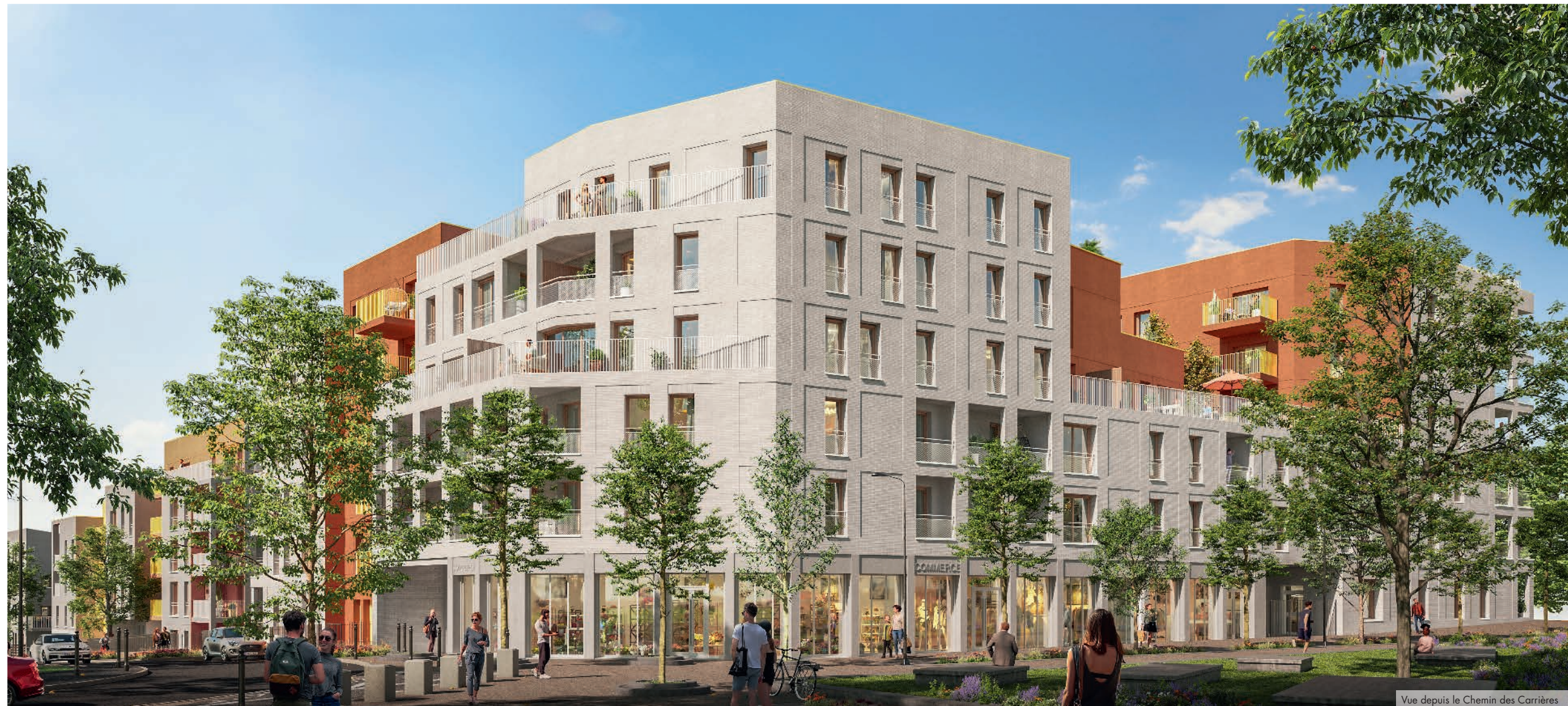
Vue depuis le Chemin des Carrières

un quotidien pratique. Côté transports, de nombreuses lignes de bus et le RER C facilitent les déplacements, sans oublier l'arrivée des futures lignes 14 et 18 du Grand Paris Express**, à la gare du Pont de Rungis, qui permettront de rejoindre Paris en 28 min*.