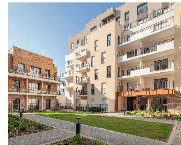
Résidence Botanic Parc - VILLEJUIF (94)

Constituer une canopée urbaine protectrice, intégrer des espaces naturels paysagers, favoriser les jardins de pleine terre, densifier le végétal... Notre objectif s'inscrit bien au-delà d'un impératif environnemental, nous faisons le choix de dessiner une ville plus proche de nos envies, de nos usages, de nos besoins ; une ville meilleure, respectueuse de ses habitants et des générations futures.