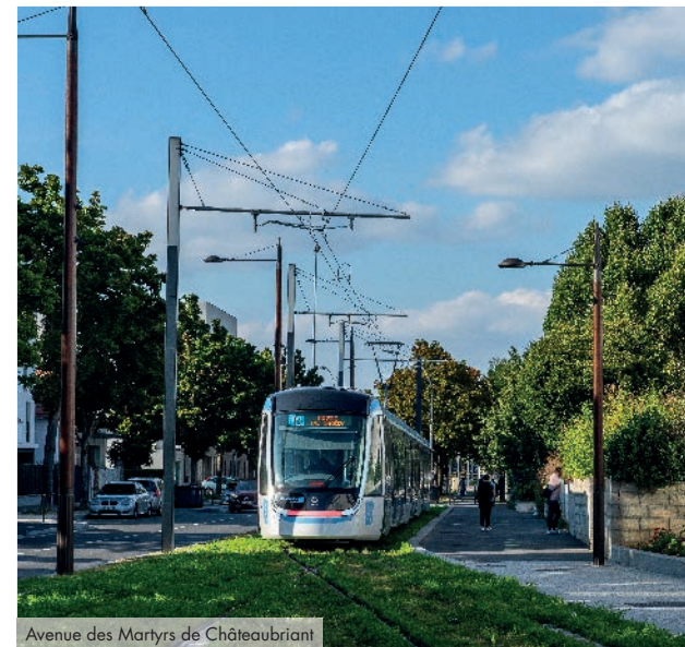
Avenue des Martyrs de Châteaubriant

Agréable et attractive, Orly dispose d'une offre éducative diversifiée, nourrie par une vingtaine d'établissements scolaires, de la maternelle au lycée. Côté loisirs, les habitants bénéficient d'un grand choix d'activités sportives grâce à un centre équestre, une piscine municipale et des gymnases, auxquels s'ajoute un centre culturel regroupant cinéma, théâtre ou expositions, satisfaisant ainsi les envies de chacun.