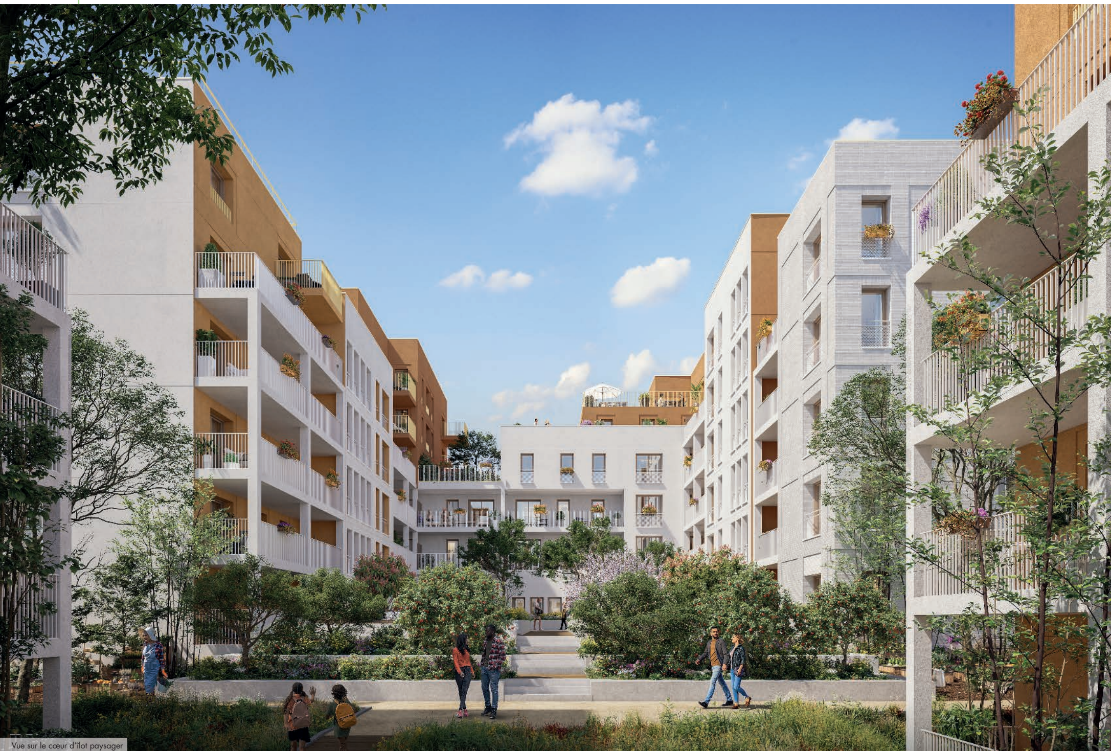
Vue sur le cœur d'îlot paysager