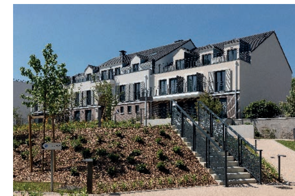
Résidence Inspiration 30 - THIAIS (94)