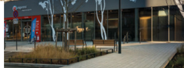
LOGEMENTS & LOCAL COMMERCIAL ANGERS