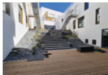
RÉSIDENCE GÉRÉE - Ovélia Patio Margot CHANTEPIE