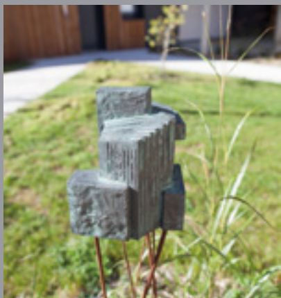
« Volume libre » œuvre réalisée par l'artiste Tanguy Robert sur la résidence Le Parc du chêne à Vertou.

Tout en soutenant les artistes et la création contemporaine française, VINCI Immobilier invite ainsi l'art dans le quotidien et dans la ville.