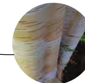
Bouleau de l'Himalaya