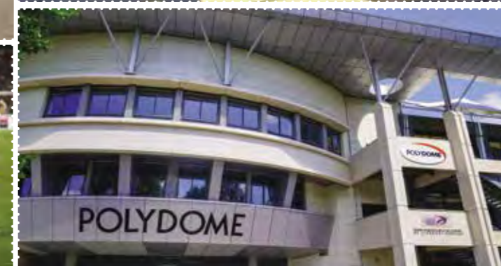
L'AVENTURE MICHELIN Musée