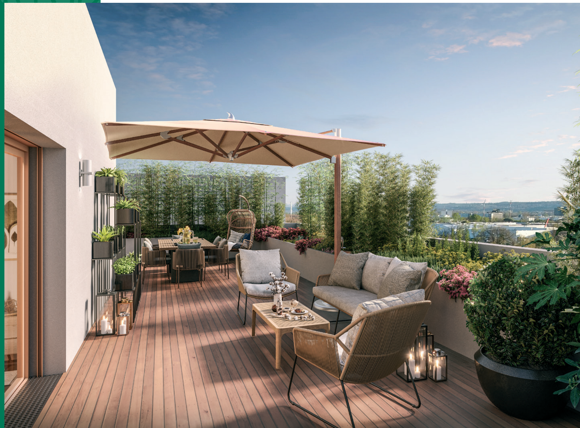
Vue d'une terrasse