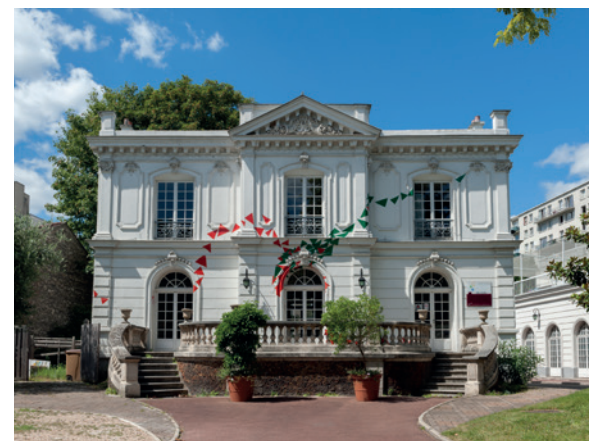
^ Centre culturel de Villeneuve-la-Garenne < Parc des Chanteraines