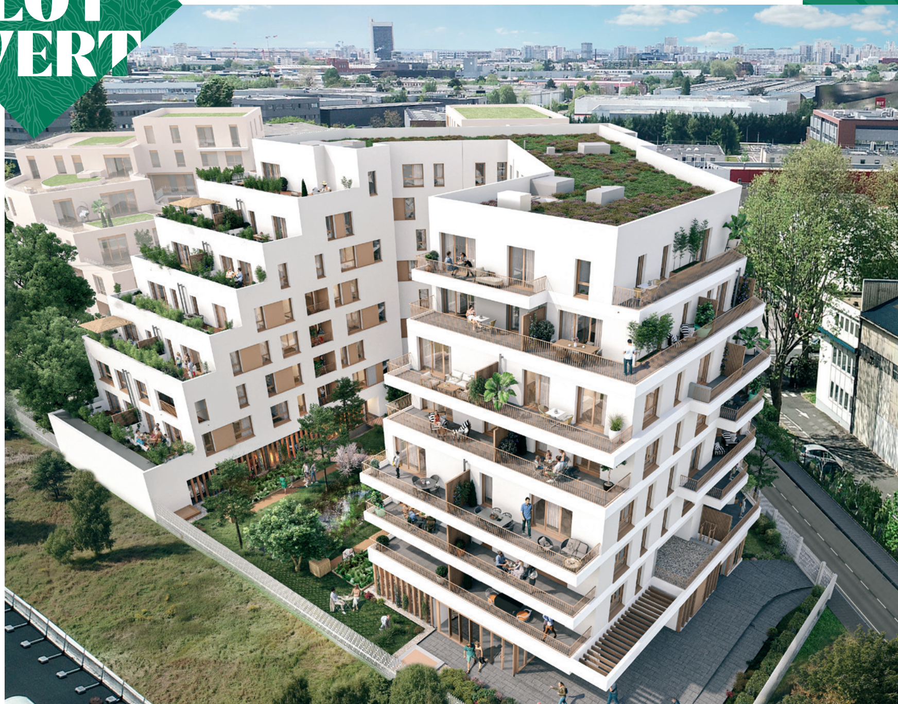
Vue depuis la rue Camille du Gast