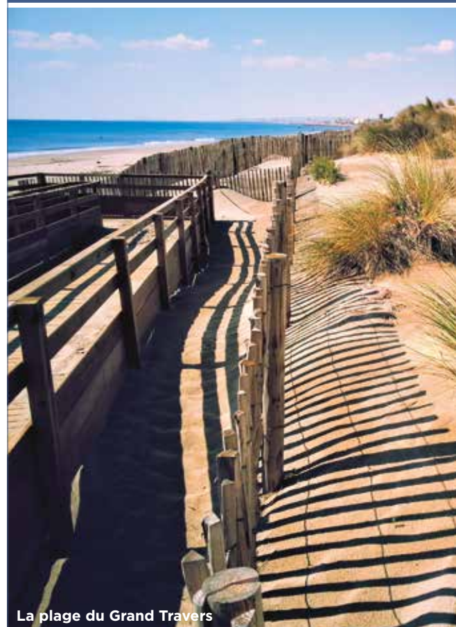
La plage du Grand Travers