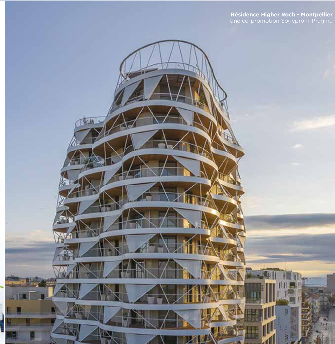
Résidence Higher Roch - Montpellier Une co-promotion Sogeprom-Pragma