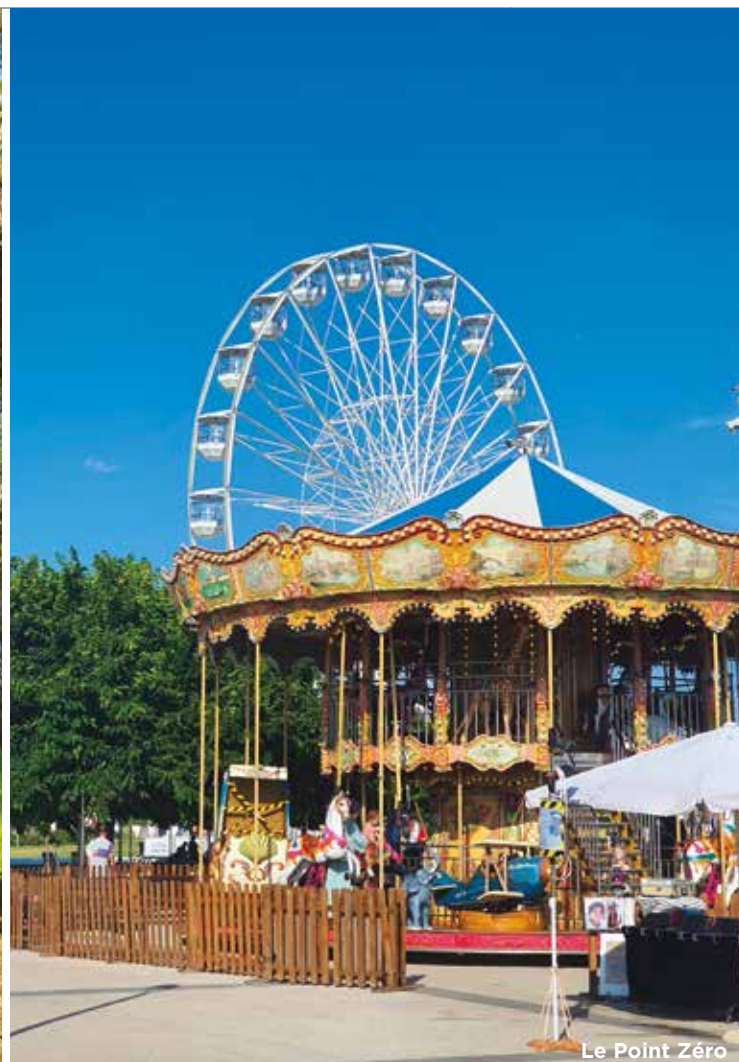
Le Point Zéro