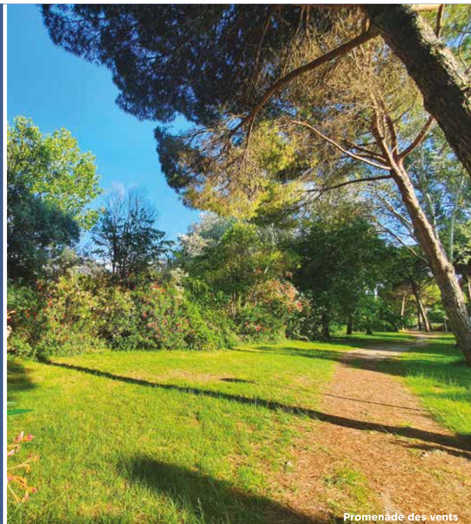
Promenade des vents

carré saphir , c'est la rencontre entre un cadre de vie rare et un habitat d'exception. Une adresse privilégiée à La Grande Motte, à quelques pas seulement de la mer et proche de toutes les commodités. Une architecture contemporaine tournée vers un cœur d'îlot paysager. Des prestations pensées dans les moindres détails pour vous garantir confort et plaisir d'habiter. carré saphir , c'est l'opportunité de devenir propriétaire d'un appartement de standing dans un cadre recherché.