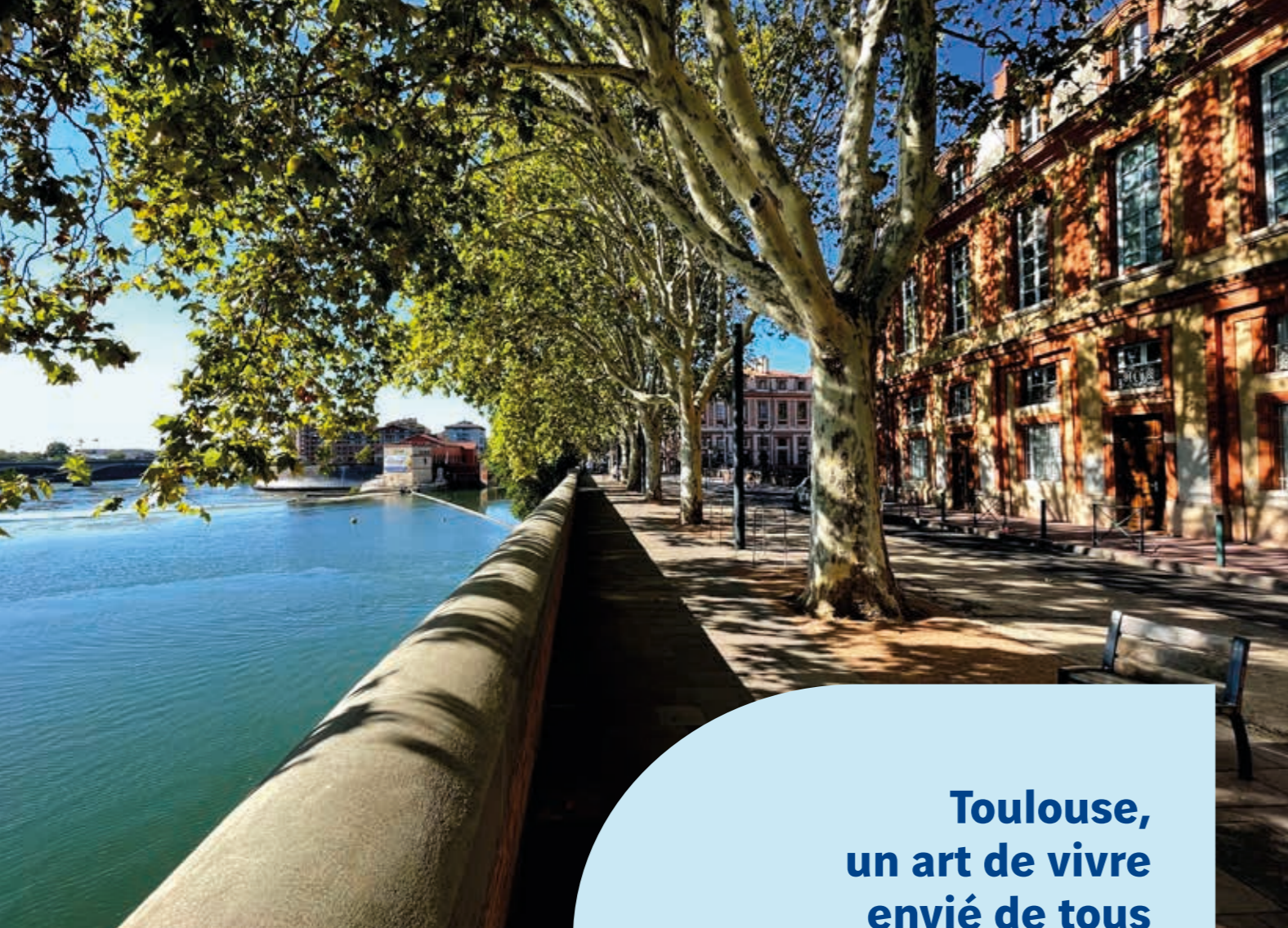
Toulouse - Quai Saint-Pierre

L'une des villes phares de la métropole toulousaine