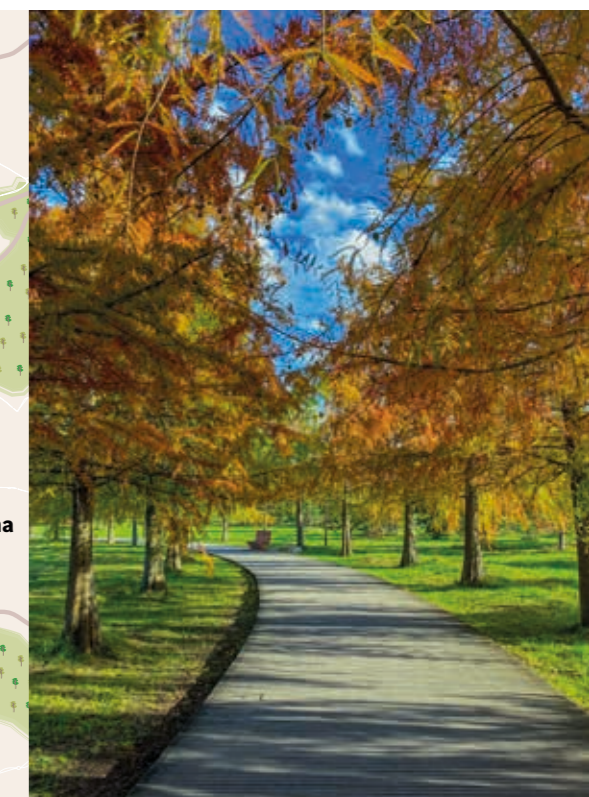
Parc de la ZAC Andromède à Blagnac