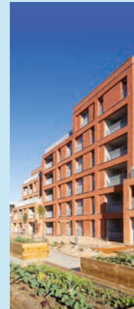
RÉSIDENCE LIVE IN OSMOSE BAT B TOULOUSE