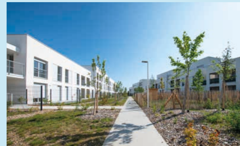
RÉSIDENCE NUANCES OPALINE TOULOUSE