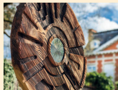
"Civilisation 12" Sculpture en bois d'Arnaud Pottier Résidence "L'Orée de Barbieux" à Croix