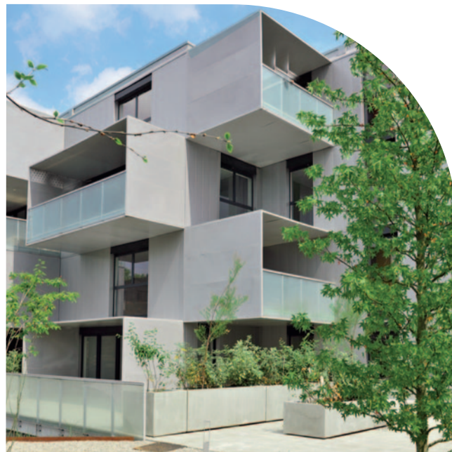
New Line à Lille