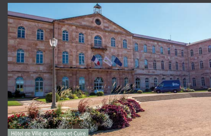
Hôtel de Ville de Caluire-et-Cuire