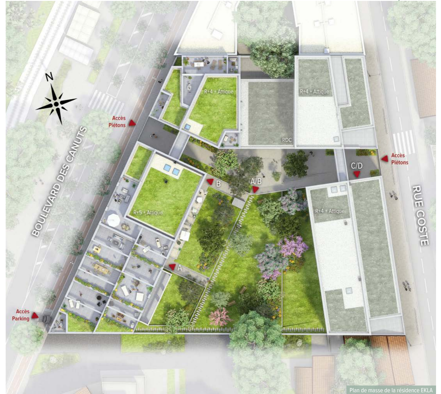
Plan de masse de la résidence EKLA

plantations. Élevés sur 5 et 6 étages, les immeubles jouent sur une architecture rythmée aux lignes épurées. Briques de parement de teinte claire, toitures végétalisées et jardin arboré signent un dialogue équilibré entre ville et nature. Ouverte sur l'horizon, EKLA révèle une vue sur les collines des Monts d'Or et la métropole lyonnaise.